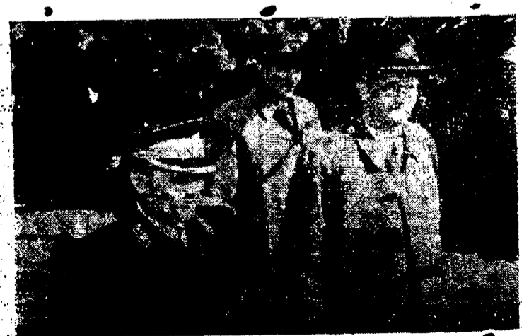
Como suele acontecer en las "democracias populares", las elecciones generales yugoslavas han otorgado la abrumadora mayoría del 91 por 100 al Frente Nacional a cuya cabeza se encuentra Tito. El mariscal aparece en esta foto acudiendo a las urnas para depositar su voto, mientras el pueblo aplaude a su "Libertador", aconsejado dulcemente por los guardias.