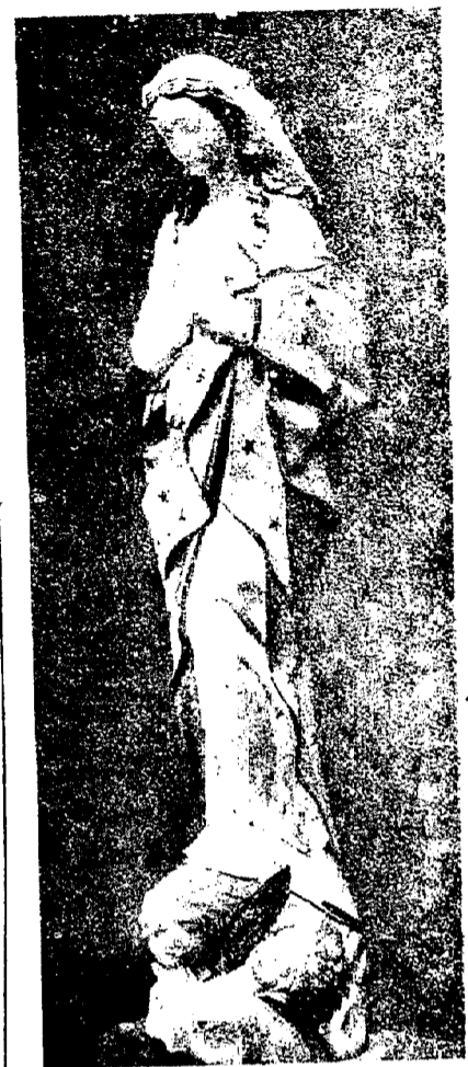
La Inmaculada Concepción, magnífica escultura en alabastro, dorado y policromada, de quien es autor el brillante escultor corquense Martínez Bueno, que en esta obra—propiedad del Ayuntamiento de Cuenca—se sitúa en la más brillante línea de los imaginarios españoles.

Nuestro paisano, el gran escultor Martínez Bueno, estuvo entre nosotros en las pasadas fiestas de la Coronación Canónica de la Virgen de la Luz. Su visita tuvo un signo mariano por doble razón: estar presente en los mencionados actos y hacer entrega a la Corporación Municipal de una imagen de la Inmaculada Concepción de que es autor.