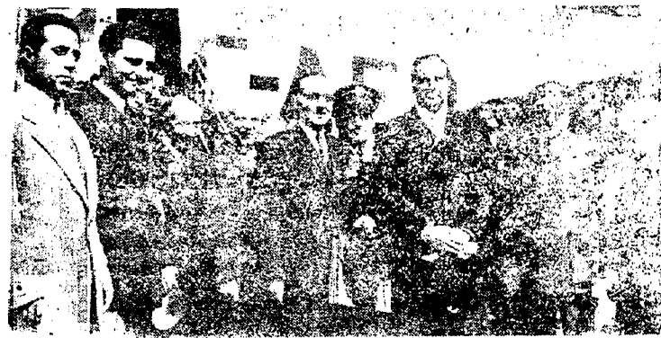
El Excmo. Sr. D. Felipe Takla Bey ha llegado a España para firmar un tratado de amistad entre el Líbano y nuestra patria, hecho que ha sido realizado en Madrid. En la foto, el ministro libanés aparece acompañado del ministro de Asuntos Exteriores, Sr. Martín Artajo, que acudió a recibirle al aeropuerto de Barajas.