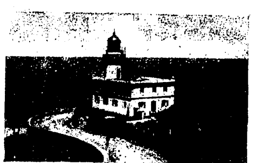
SAN SEBASTIÁN.—El Faro Iguedo