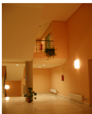
Patio del Centro Cultural Aguirre