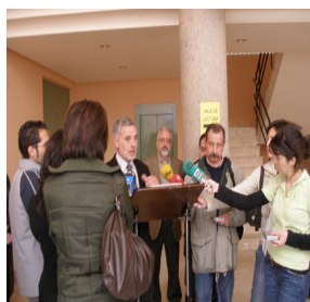
Momento de la inauguración, en abril del 2005

Por fin, en enero de 2004 se abren dos salas de la biblioteca, las más demandadas y necesitadas: la sala de estudio y la hemeroteca. Un año después, en abril de 2005, se completan salas y servicios: el préstamo y la sala infantil-juvenil.