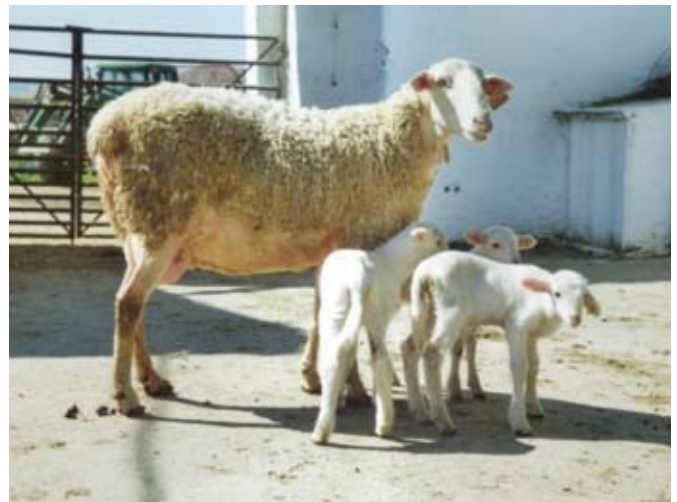
HEMBRA RAZA MANCHEGA. AÑO 2010