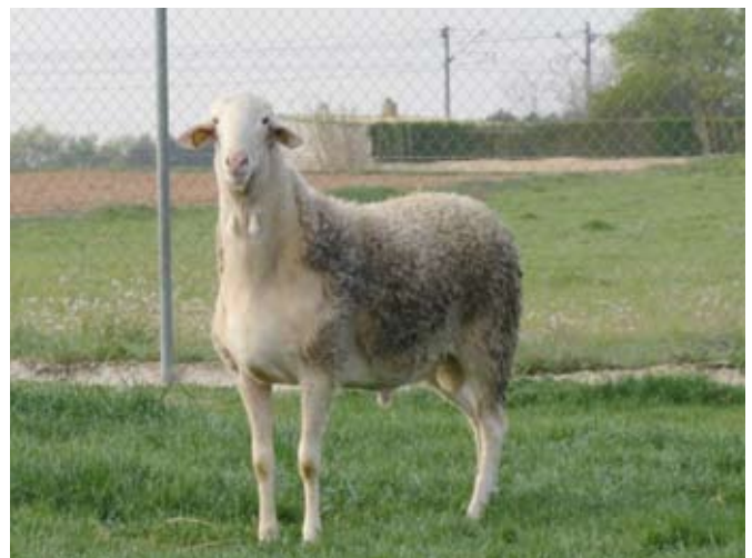
MACHO RAZA MANCHEGA. AÑO 2010