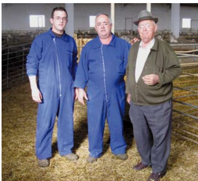
Las tres generaciones de la familia Poveda, en la nave que se construyó recientemente para los animales. También se instalaron cintas de alimentación, para optimizar la mano de obra.

De forma individual, se puede mejorar algo la ganadería, pero con las herramientas que proporciona AGRAMA y con las activida-