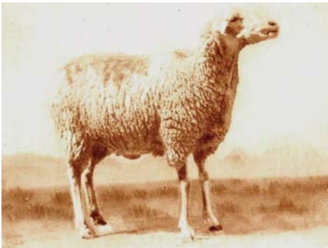
HEMBRA RAZA MANCHEGA. AÑO 1930