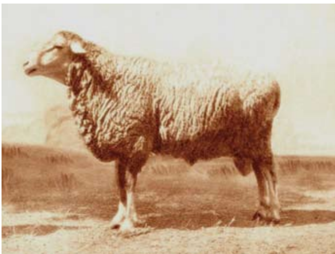
MACHO RAZA MANCHEGA. AÑO 1930