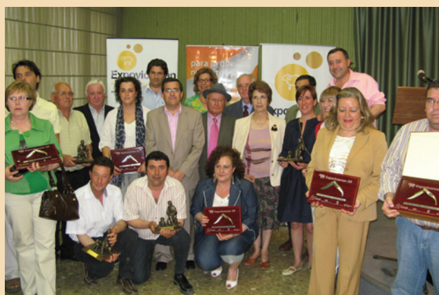
Algunos de los premiados en la XXIX edición de Expovicaman.

También hay que destacar la Subasta Nacional y Bolsa de Sementales , que se celebró el pasado día 22 de mayo, en las que se ofertaron 97 sementales (10 en la Subasta Nacional y 87 en la Bolsa de sementales). Se adjudicaron la totalidad de los animales, lo que cerró la jornada con un rotundo éxito. El precio medio alcanzó los 525 € en Subasta Nacional y 452 € en la Bolsa de Sementales, destacando algunos que sobrepasaron la barrera de los 1.000 € (RN08583 de AGRAMA-Rebaño Nacional).