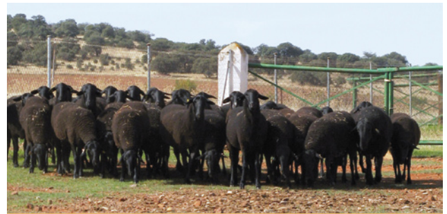
Uno de los objetivos del Programa Nacional es garantizar la conservación de las razas en peligro de extinción, como la manchega negra

Estudio, valorización y contribución de las razas ganaderas a la sociedad, diversificación de las zonas rurales, mejora de la calidad de vida y aspectos culturales.