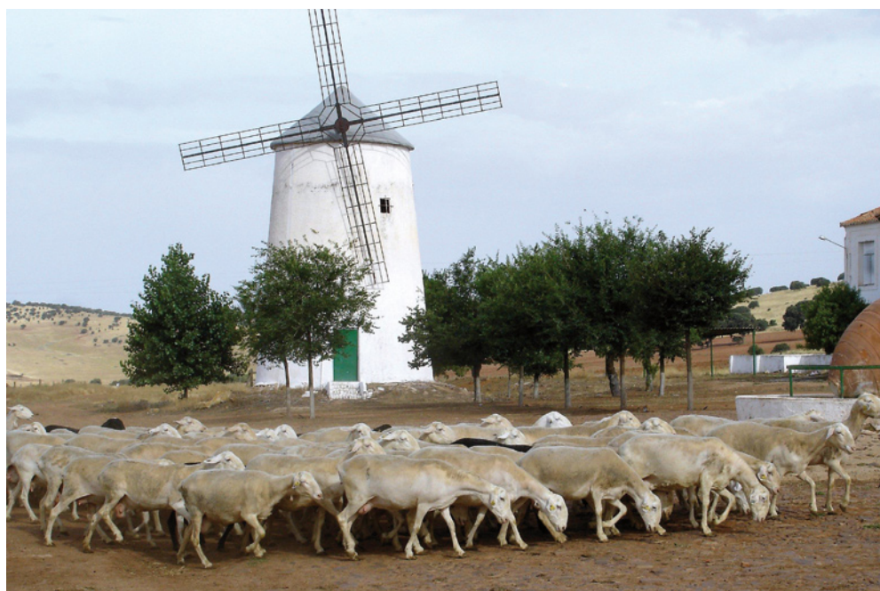
La estación del año, el momento de la lactación, la edad de la oveja y el tipo de parto son parámetros que influyen en los recuentos celulares individuales de la leche.

El recuento de células somáticas de la leche de tanque (RCST), como indicador del estado de la sanidad mamaria del rebaño, presenta una media de 1.553.000 cel/ml (logRCST: 6,11), con un porcentaje de muestras que superan el umbral RCST > 1.000.000 cel/ml del 64,63%, revelando una situación preocupante de las ganaderías de Castilla-La Mancha frente a este parámetro, con un cierto estancamiento de los resultados en el periodo de estudio. Es más positivo el balance del recuento