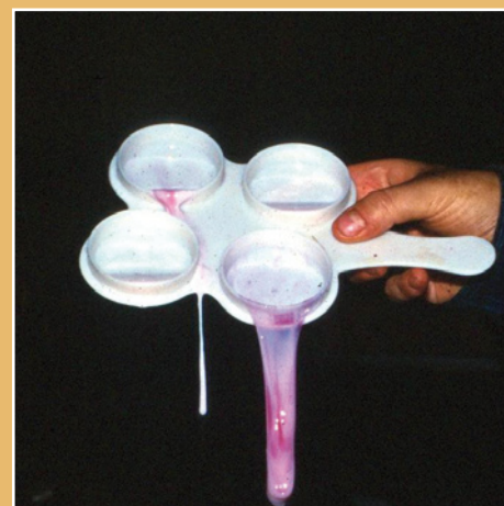
Toma de muestra de leche y reacción posterior, en este caso, claramente positiva