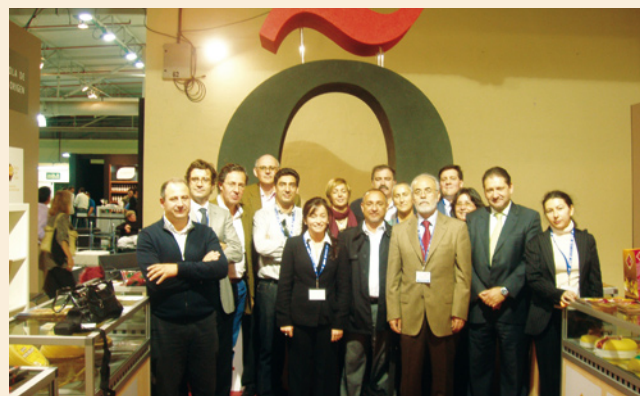
Representantes de las distintas D.O.'s en el stand de la Asociación ORIGEN.

en 2007 a iniciativa de las D.O.'s Jamón de Teruel, Turrón de Jijona y Alicante y Queso Manchego, tres organizaciones que sufren como pocas el problema del fraude y de la utilización impropia de su nombre protegido. En tan corto espacio de tiempo, la asociación ha conseguido ampliar a veintisiete el número de sus miembros, encontrándose en creciente expansión. Figuran en ella Denominaciones Protegidas de los más variados productos, si bien el número más amplio corresponde a las relacionadas con quesos. ORIGEN se ha convertido en un interlocutor válido con el Ministerio de Medio Ambiente y Medio Rural y Marino, con quien mantiene reuniones frecuentes para tratar asuntos relacionados con problemas de sus miembros y con las actividades desarrolladas.