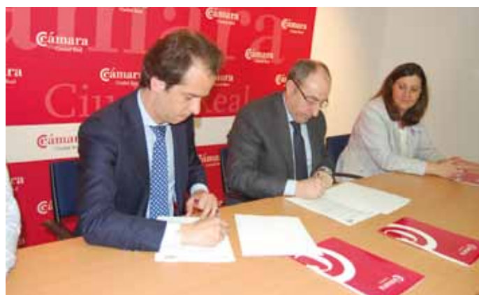
Firma del convenio entre ambas entidades

evolución del mercado del queso en EEUU durante este año; está previsto realizar un evento promocional de los quesos manchegos en Nueva York (EEUU) dirigido a prescriptores y una misión comercial inversa de compradores alemanes para reforzar la imagen de marca de los productos bajo la DO Queso Manchego; 3 jornadas formativas en técnicas de comercialización internacional; diagnósticos de internacionalización para queserías, de hecho, 20 queserías podrán solicitar la elaboración de un diagnóstico de situación de la empresa y un servicio de asesoramiento en operativa de comercio internacional”.