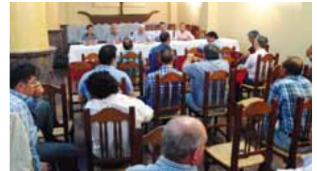
Celebración de la Asamblea de APROMANCHA

La Agrupación ha realizado este año algunos ensayos para ampliar poco a