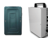
Lectores portátiles para mangas