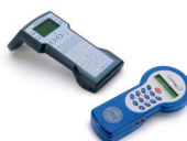
Lectores de mano