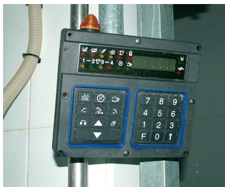
Dispositivo que permite la regulación y control los parámetros de ordeño (retirada de pezoneras, tiempo de ordeño, pulsación etc.)

También podemos encontrar pulsadores que realizan una estimulación del pezón, aumentando la velocidad de pulsación a 300 ppm, en el caso de que transcurridos 30-40 segundos tras la puesta de pezoneras no se produzca la eyección de la leche.