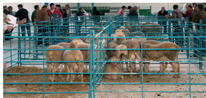
Los ganaderos observan las características de los animales, momentos antes de comenzar la Bolsa.

El pasado 9 de noviembre se celebró, en el recinto ferial del IFAB, la 60ª Bolsa de Sementales de Raza Ovina Manchega. En la misma, la última del año, se adjudicaron todos los animales ofertados, un total de 42 sementales, los cuales se repartieron entre 11 ganaderías procedentes de diversos municipios de Albacete (15 animales adjudicados), Ciudad Real (12 animales), Cuenca (9 animales) y Toledo (6 animales adjudicados). El precio de salida estaba comprendido entre los 250 y los 350 euros, según la edad del animal, Valor genético, genealogía... El precio medio de venta se situó en los 355 euros, precio al que hay que descontar las subvenciones que varios entes públicos y privados (Junta de Comunidades de Castilla-La Mancha, Diputaciones Provinciales, I.T.A.P. de Albacete, y Consejo Regulador de la Denominación de Origen Queso Manchego) otorgan a los compradores en estos eventos, y que pueden llegar a los 250 euros.