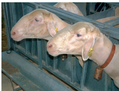
Los elementos para inmovilizar animales deben ser seguros, sin riesgo de producir heridas

Si desea ampliar la información sobre bienestar animal en el ganado ovino, puede consultar la página web del M.A.P.A., donde se recoge toda la normativa relativa a este tema.