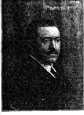
Un gran corazón republicano