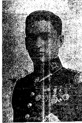
Otro mártir de la tiranía