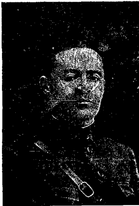
Dió su vida por la libertad de los hombres