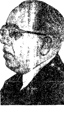
Un gobernante sereno, justo e inteligente