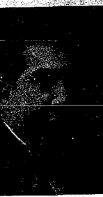
Diputado de "Acción Republicana", elegido por nuestra Provincia.