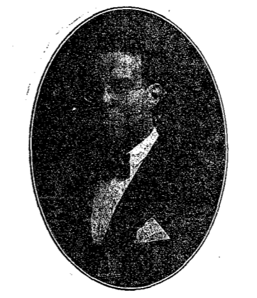
Leal defensor del Trabajo y la Justicia