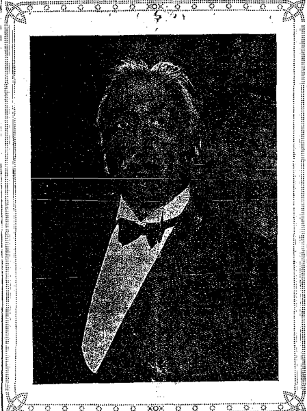
Primer Presidente de la Segunda República Española