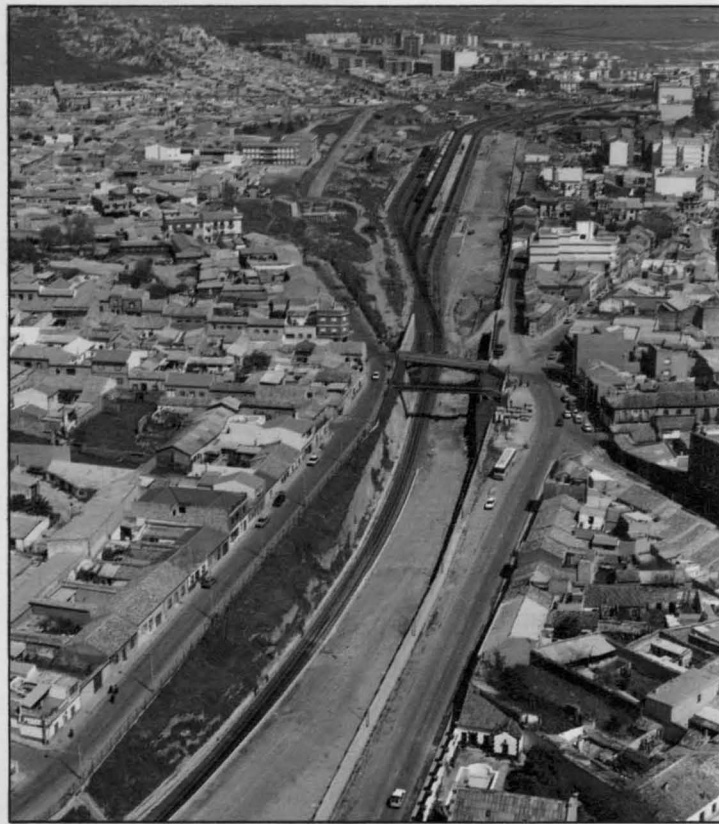
Vista aérea del trazado del Tren de Alta Velocidad, a su paso por Puertollano con la nueva estación.

La Presidenta de RENFE llegó a Puertollano en un tren especial desde Ciudad Real. Venía acompañada por el Gobernador Civil de la provincia, y fueron recibidos en la estación por el alcalde y miembros de la Corporación Municipal.