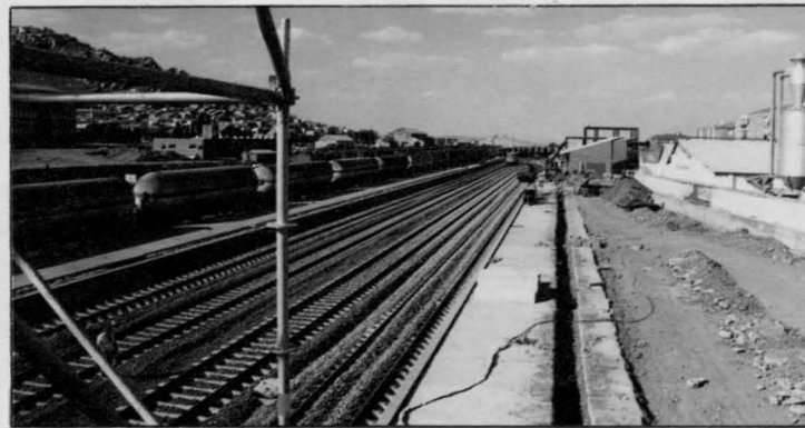
Vista general de las obras de la nueva red de vías y andenes para el AVE.