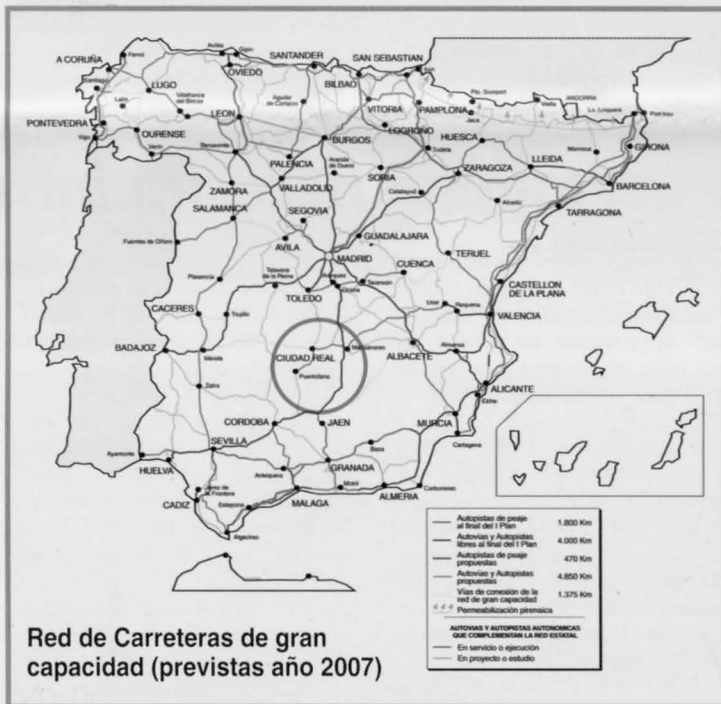
Red de Carreteras de gran capacidad (previstas año 2007)

Entretanto, la línea ferroviaria Ciudad Real-Manzanares va a ser acondicionada para que los trenes que circulan por ese tramo puedan aumentar sensiblemente su velocidad, hasta alcanzar entre 200 y 250 kilómetros por hora, lo que redundará en una mejora más en las comunicaciones.