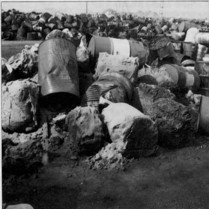
El Ayuntamiento puso en conocimiento de La Consejería de Industria el almacenamiento ilegal.

La empresa MPRISA ha sido sancionada con 15 millones de pesetas para el depósito ilegal de residuos tóxicos procedentes