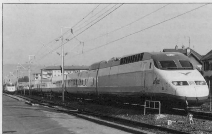
Atractiva imagen del Tren de Alta Velocidad en la Estación de Puertollano durante su viaje de pruebas.