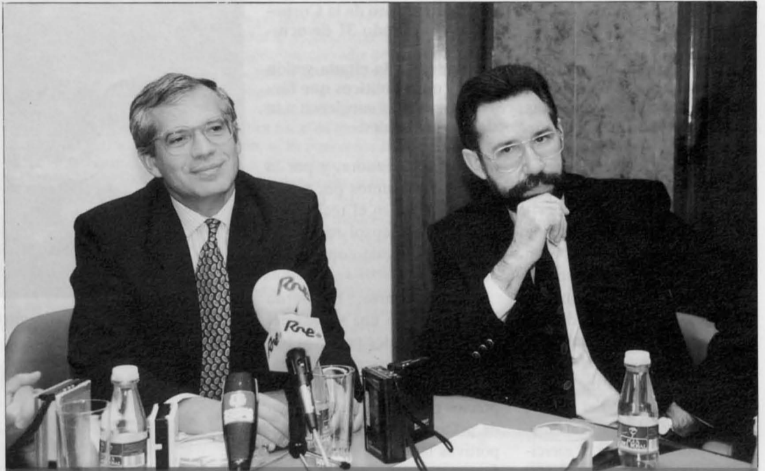
El Ministro de Obras Públicas y Transportes, José Borrell, acompañado del Alcalde, durante la rueda de prensa en Puertollano.

Velocidad Madrid-Sevilla, por parte de determinados colectivos, el Ministro de Obras Públicas y Transporte manifestó durante la rueda de prensa que «sería bueno que en este país nuestro, fuésemos capaces, entre todos, de desarrollar una actitud cultural, —porque es un problema cultural en el fondo—, positiva y constructiva hacia lo que estamos demos-