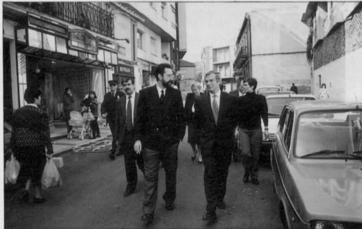
El Alcalde, Santiago Moreno, acompaña al Ministro José Borrell, durante su recorrido por nuestra Ciudad.