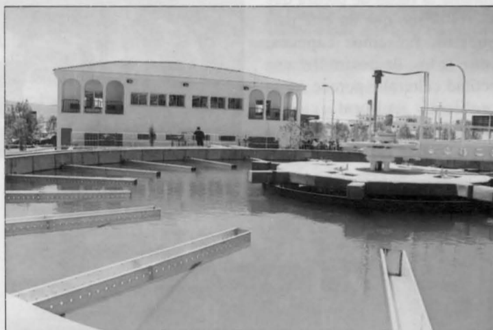
La subida del metro cúbico de agua se destina al aumento de los costes de funcionamiento de la Potabilizadora.

ñas informativas y formativas dirigidas a padres, educadores, alumnos, etc.