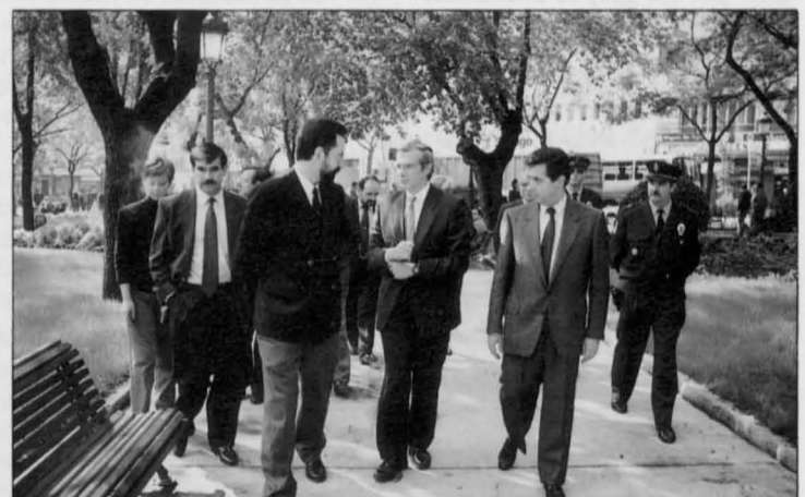
El Ministro de Obras Públicas y Transportes alabó la remodelación del Paseo de San Gregorio y se quedó gratamente impresionado de nuestra Ciudad.

trando ser capaces de hacer. La línea de tren Madrid-Sevilla es una obra de ingeniería que, después de la obra del túnel del Canal de la Mancha, es la segunda en importancia en Europa. Ha movilizado los recursos y las capacidades de nues-