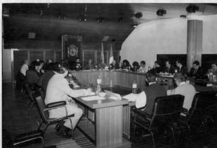
Sesión Plenaria del Ayuntamiento el 31 de octubre, presidida por el Alcalde, Santiago Moreno.

En lo referente a ordenanzas fiscales es destacable, por último, la reducción de un 50% en algunos de los precios por el servicio de Matadero y transporte de carne, a fin de aumentar la demanda del servicio.