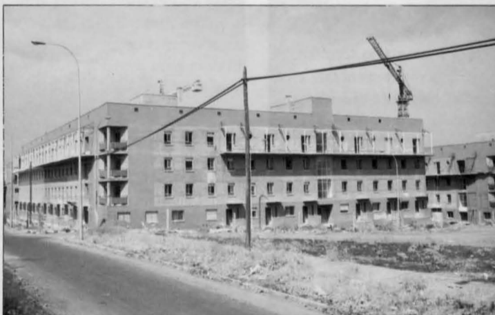
En los últimos ocho años se han invertido más de 2.000 millones de pesetas en la construcción de 600 viviendas sociales.

Esta propuesta surge como consecuencia de un hecho cada vez más frecuente: un alto porcentaje de viviendas destinadas a los que carecen de ella, debe ser destruido para realojar a los que ocupan viviendas que se han quedado inadecuadas, como, por ejemplo, determinados bloques de la calle Montesa que amenazan ruina.