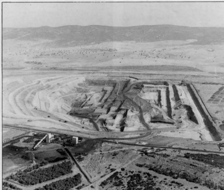
El Plan Energético Nacional (PEN) potencia la utilización de las minas de carbón a cielo abierto de Puertollano.

Una semana antes de producirse la decisión de la Comisión Técnica, el alcalde viajó en compañía de los técnicos de Endesa para avalar con su presencia la aceptación del proyecto por los ciudadanos de Puertollano. Otros dos proyectos, uno danés con participación alemana, y otro exclusivamente alemán, compitieron con el español con el objetivo