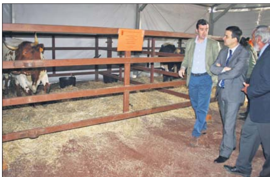
AGABE celebró un encuentro en la antesala de la Feria ganadera

En este marco, todos los asistentes tuvieron también ocasión de conocer de primera mano las nuevas perspectivas que surgen para la ganadería en el Valle de Alcudia, desde el punto de vis-