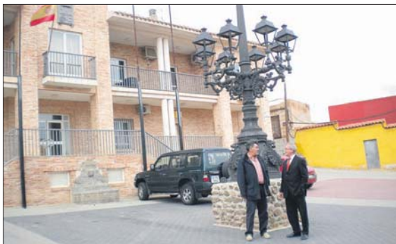
Remodelación de la Plaza de España y mayor accesibilidad en El Hoyo