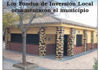
Los Fondos de Inversión Local ornamentaron el municipio