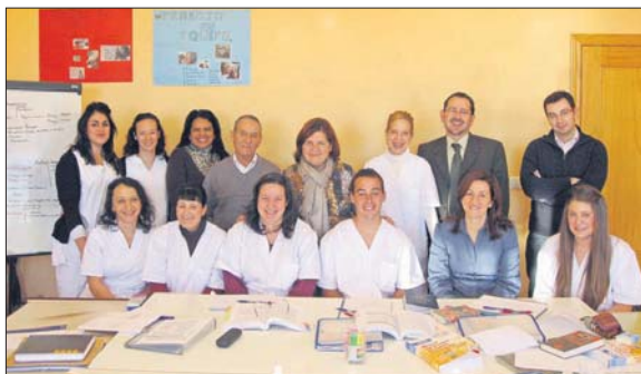
La consejera de Empleo conoció 'in situ' las acciones que se promueven

La responsable regional de Empleo, Igualdad y Juventud resaltó que esta apuesta formativa seguirá, además, la finalidad de que "sean políticas efectivas que ayuden a nuestros desempleados a mejorar sus expectativas reales de incorporarse al mercado laboral". Por ello, "seguiremos incrementando la formación en sectores emergentes", caso de las profesiones relacionadas con el medio ambiente, las nuevas tecnologías o la asistencia socio-sanitaria, "que han seguido creando empleo, a pesar de la crisis". Concretamente, en 2010 se han puesto en marcha 881 actividades de servicios sociales sin alojamiento para personas mayores y con discapacidad, habiendo crecido un 11% el número de con-