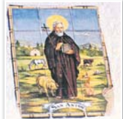
Azulejo que se conserva en casa de un vecino y que se usaba para colgar en las cuerdas para preservar a los animales de todo peligro