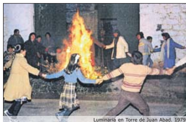
Luminaria en Torre de Juan Abad. 1979

El pasado 11 de enero reanudamos el taller de cuentacuentos, actividad habitual de la biblioteca durante el curso escolar y que se realiza todos los martes de 5 a 6 de la tarde. Además seguiremos con nuestras programaciones especiales en fechas habituales, como el día del Libro, día de la Biblioteca, Jornadas de Animación a la Lectura, etc.