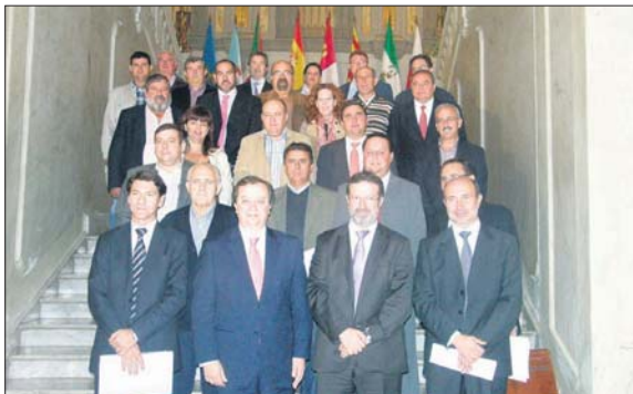
Merced al convenio de colaboración de Gobierno regional y Diputación

Ahora queda mucho trabajo por hacer y el más importante. Durante unos meses habrá que compaginar lo nuevo con lo viejo, ir solucionando los problemas técnicos que van surgiendo y acostumbrarnos a esta nueva forma de trabajar.