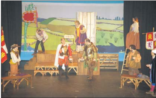
El afamado personaje membrillato cobra vida con Teatro Cachivaches