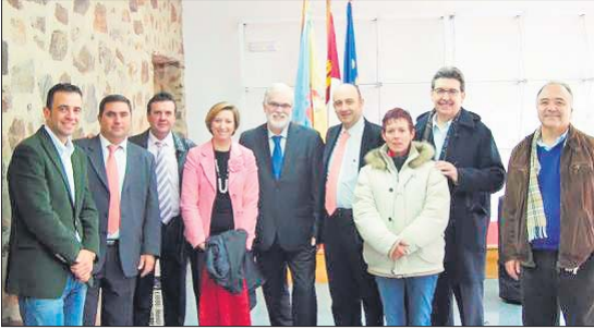
Alto Guadiana Mancha subvencionó este proyecto en La Solana