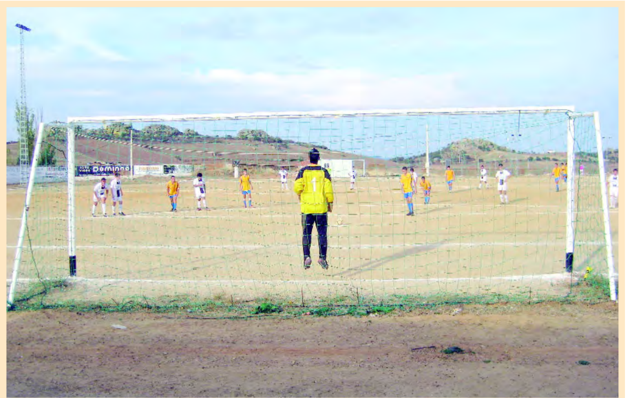
'El Morconcillo' echa el cierre

yectos, buena parte de ellos de mejora de la urbanidad y que, como principal objetivo, se marca la lucha contra el desempleo. En este sentido, el Ayuntamiento cerrará el año tras haber contratado a más de 300 parados. Página 10