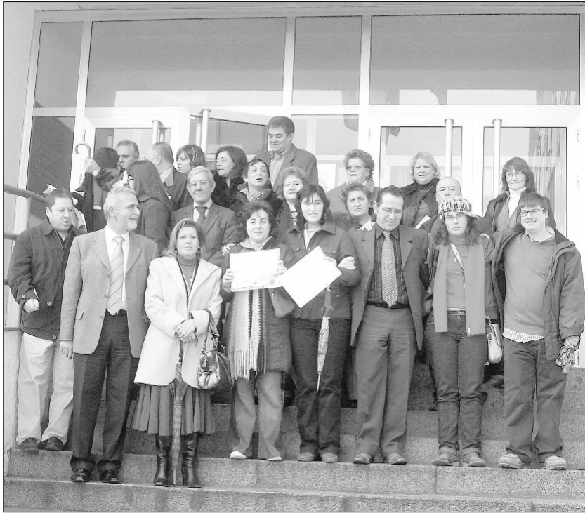
Giró en torno al diseño, la estampación y la serigrafía