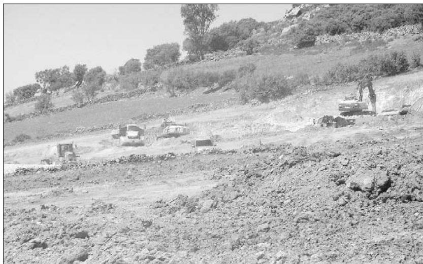
Incluye un Pabellón de Usos Múltiples y espacios de la Feria de Muestras

El proyecto, de titularidad municipal, es financiado al 50 por ciento por el Ministerio de Industria, Turismo y Comercio, a través de las Ayudas para la Reindustrialización de la Comarca de Almadén, además de la Junta de Co-