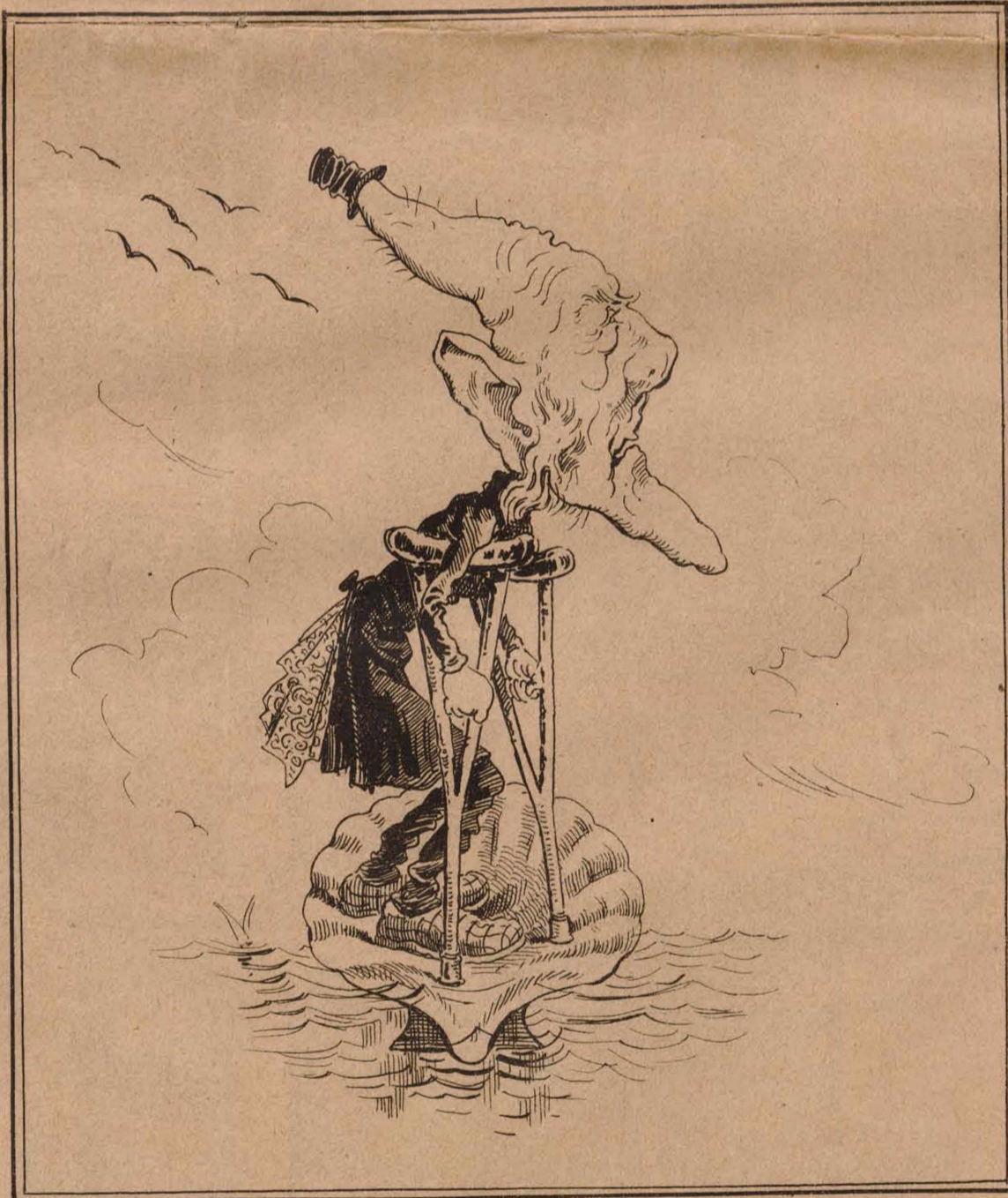
Caleidoscopio bufo.- Conchus Castañita.

Parece mentirijillas: éste es ministro en España, y resulta una castaña cruzando un mar sin orillas.