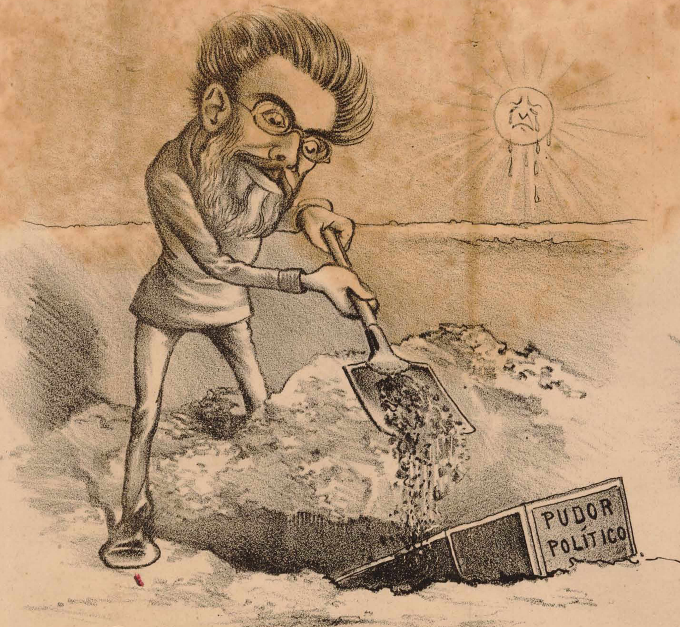
Porque se ve de su ambición cautivo también pretende sepultar á un vivo