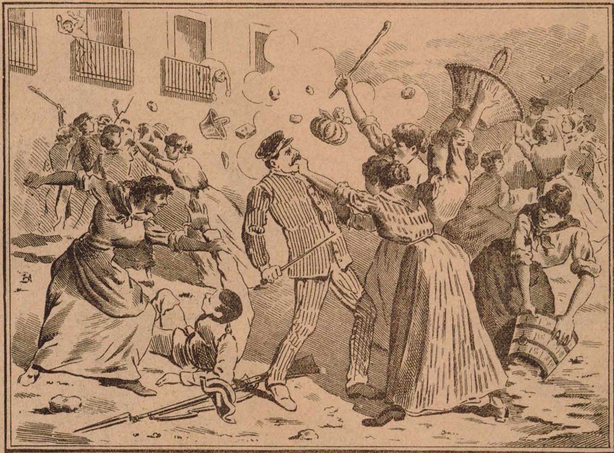
Es copia aqueste motín del que ocurrió en Pontevedra ¡Si Cánovas no se arredra, es porque tiene un mastín!