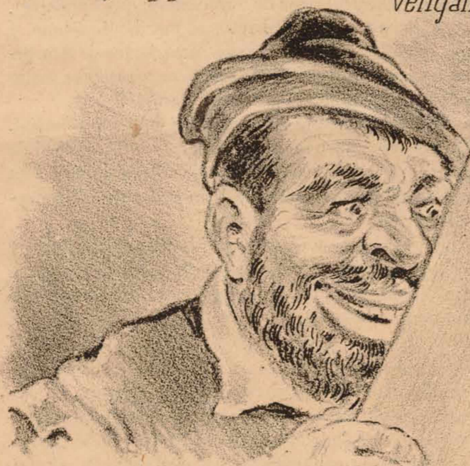
Buena oleografía publica el "Don Quijote." ¡ Ole ya! Valla una REPUBLICA que sale el dia 11.