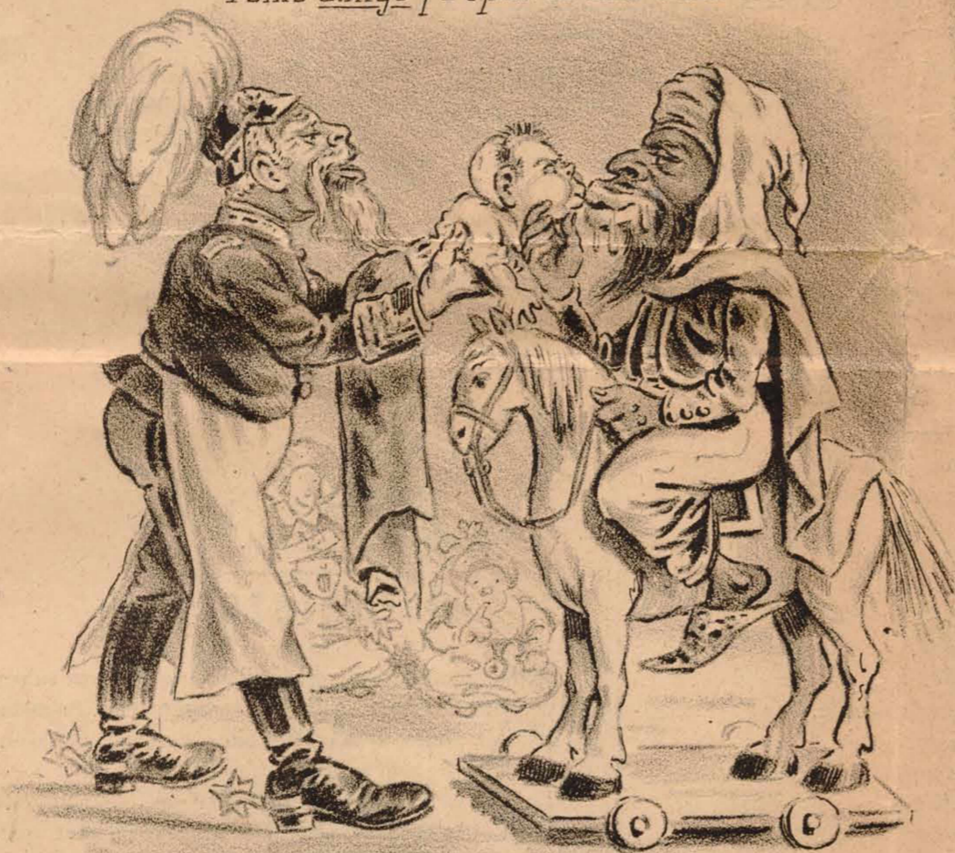
PRESENTACIÓN. Son hijos y yernos, ¡ todos hasta allí! -Dejad á los niños que vengan á mi.