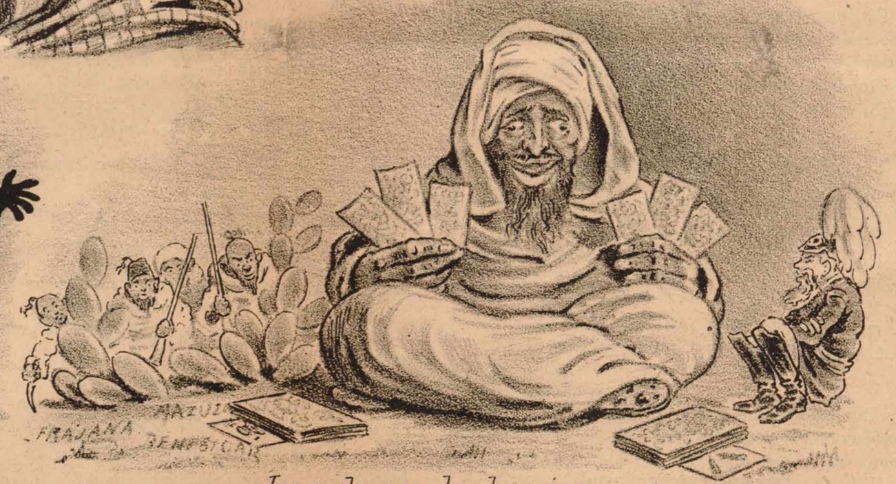
Jugando con dos barajas.