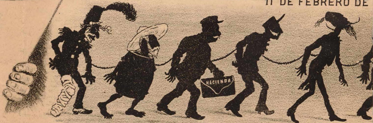
Comparsa politica apresada el domin