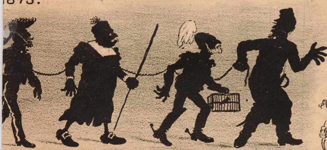
go de Carnaval.