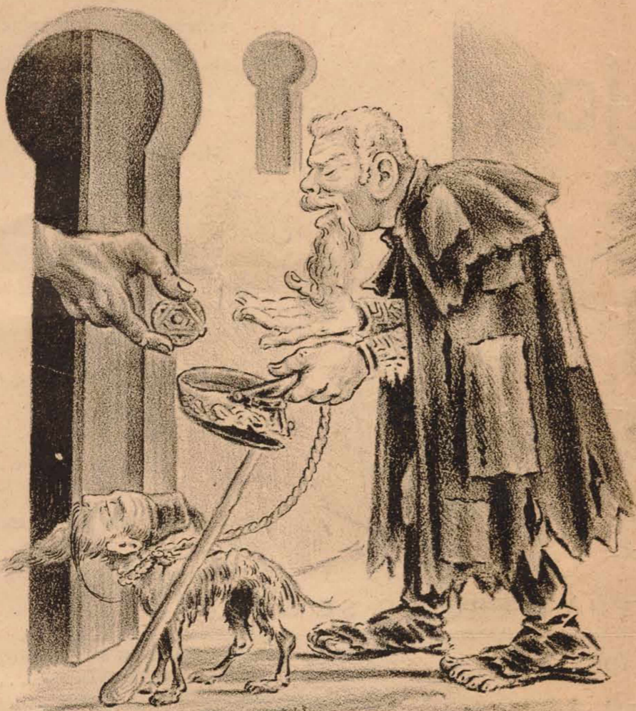
-Un ochavito ; Por amor de Dios! -Tome amigo y reparta entre los dos.