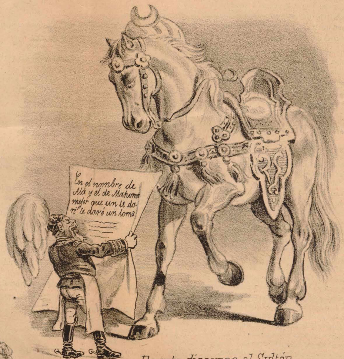
De este discurso al Sultán bien se enteró su alazán.