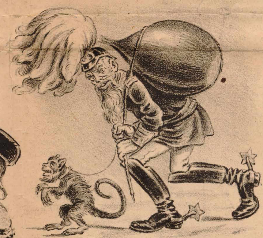
Ayer un mico, y hoy una castaña, buena indemnización me llevo a España.