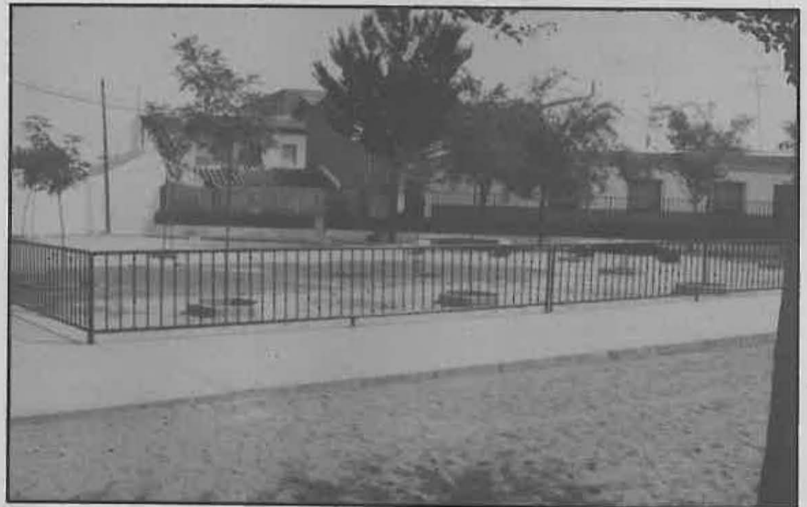
Los escolares de 3 años tendrán su lugar

directamente cerca del 75% y el resto del M.E.C.