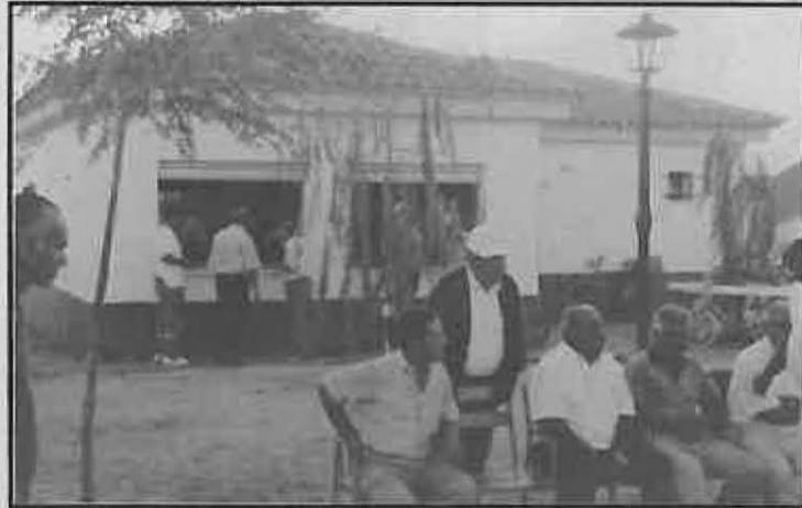
Las instalaciones al servicio de todos