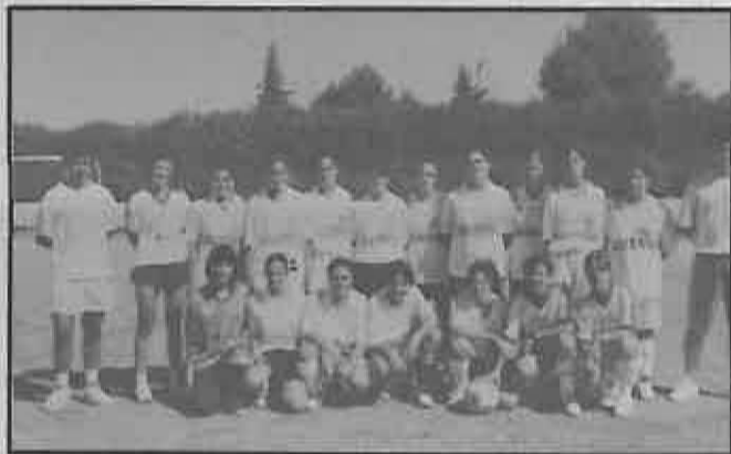
De deportes hasta fútbol femenino