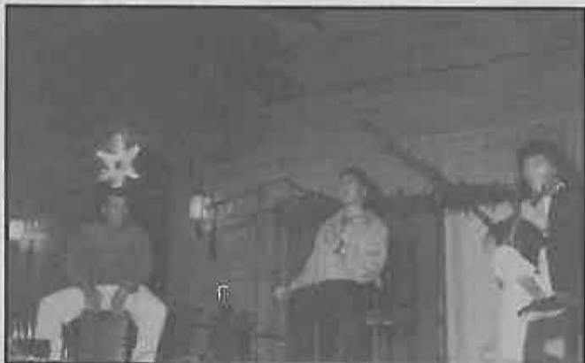
El festival flamenco abrió las fiestas