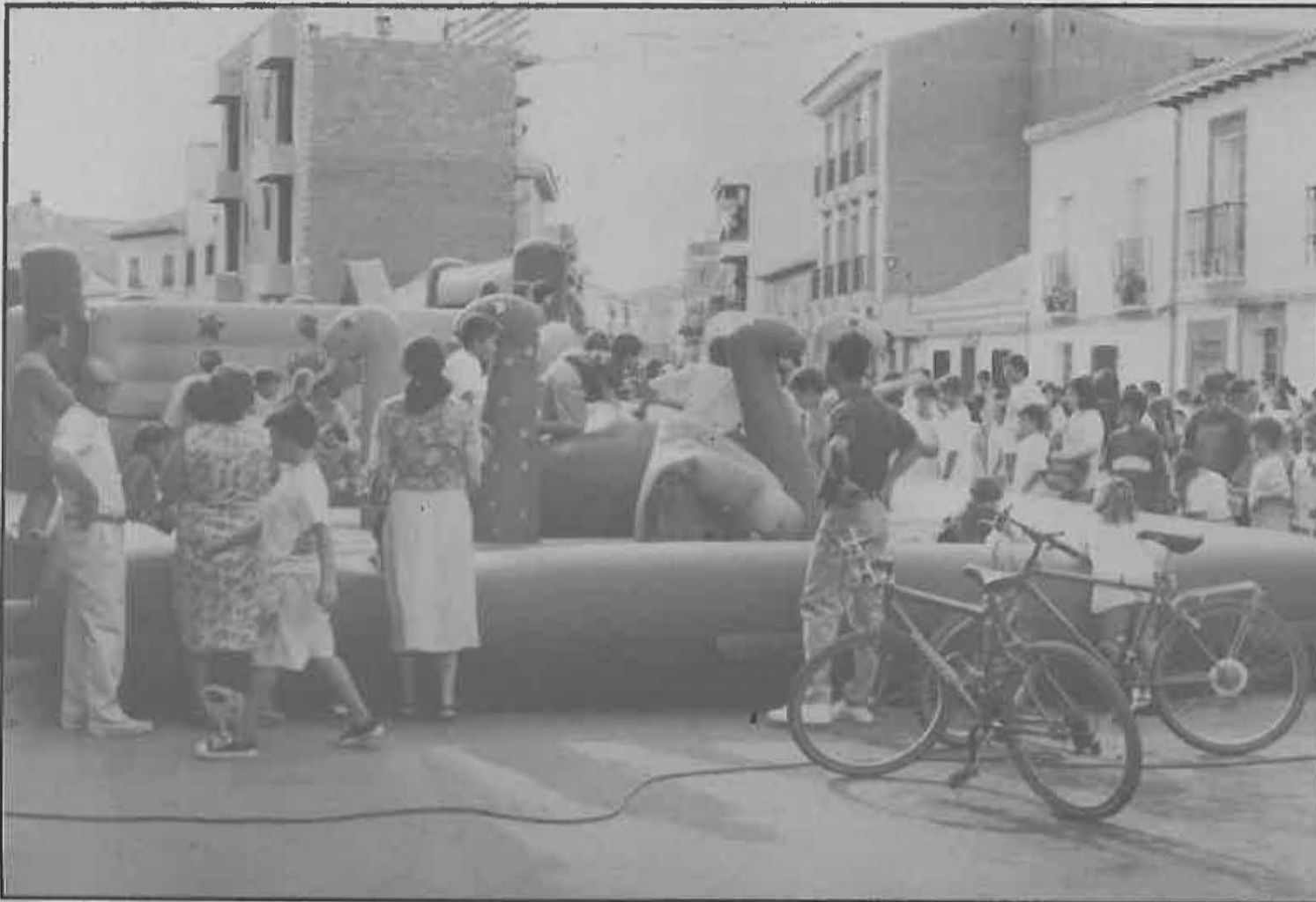
Los niños pudieron disfrutar del Parque Guay

Con un amplio programa de actividades tanto culturales, deportivas como religiosas, se han celebrado las Fiestas Patronales en honor de "Ntra. Sra. de la Estrella", que se han caracterizado por una nota predominante: la alta participación en todas las actividades programadas.