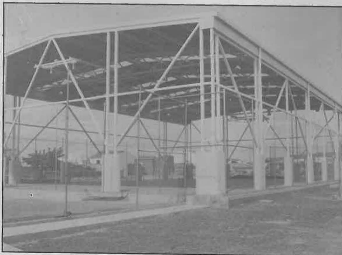
El colegio de la calle Ancha cuenta con una pista cubierta