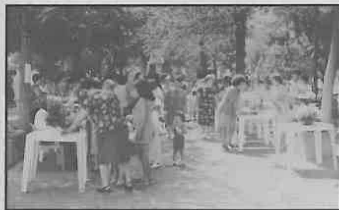
Concurso de centros florales