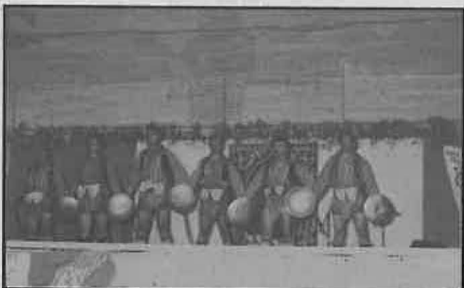
Turquía representado en Miguelturra