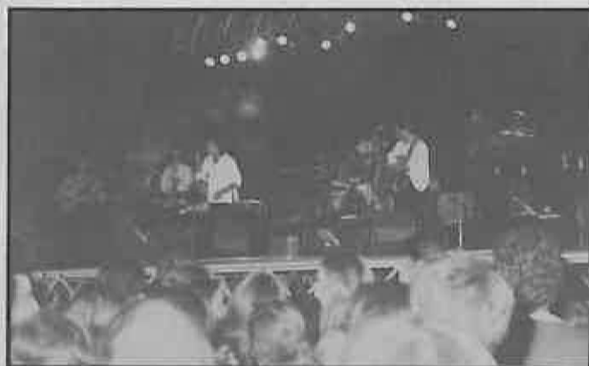
KETAMA reunió 2.000 personas