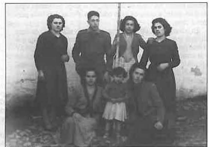
En el mismo lugar posan un grupo más reducido en compañía del hijo del sastre, desaparecido ya (26-1-50).