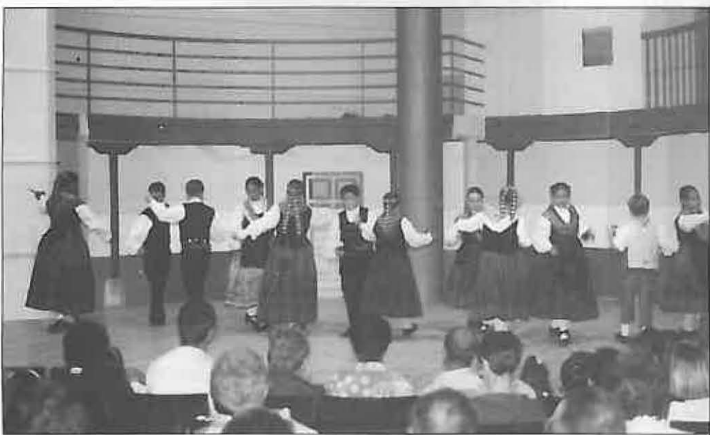
Los niños de manchegas tuvieron su espacio

Dedicados fundamentalmente a los más pequeños, se realizaron en la semana del 15 al 21 de diciembre diversas actividades culturales con motivo de la Navidad.