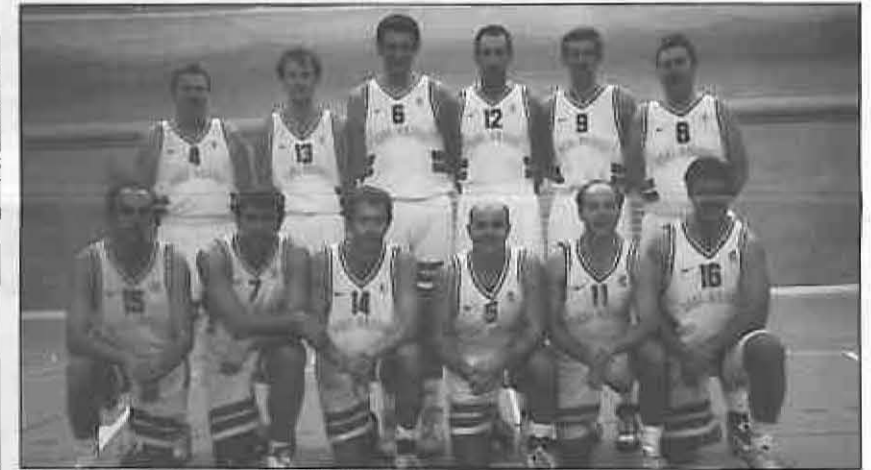
La atracción la puso el Real Madrid