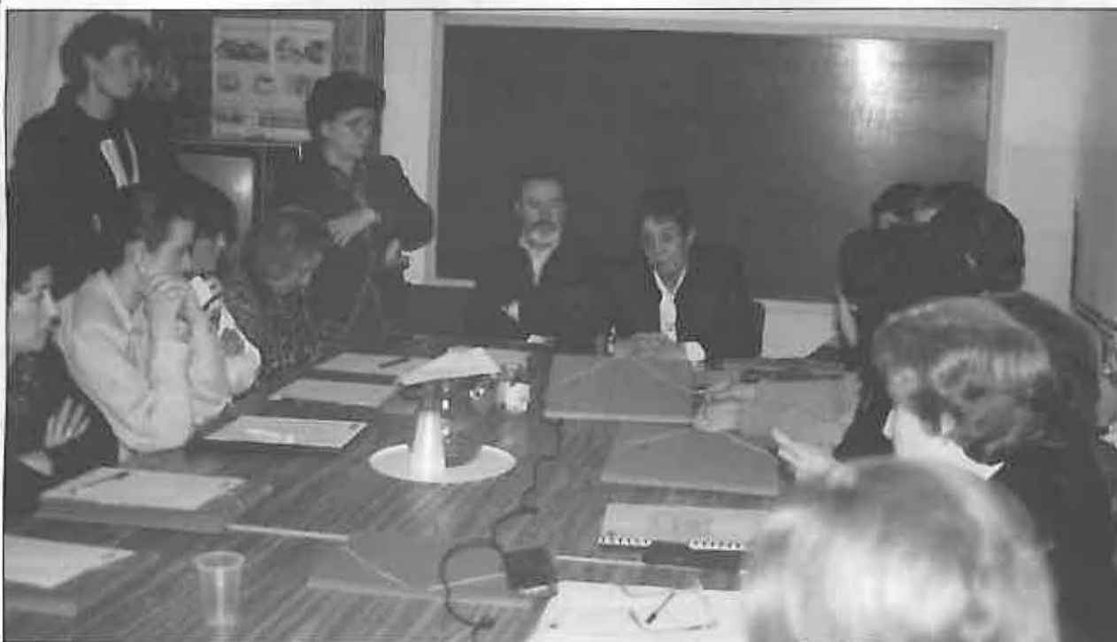
La delegada provincial y el alcalde inauguraron el curso

Como en años anteriores la CONSEJERIA DE BIENESTAR SOCIAL ha ofertado cursos de gestión y dinamización asociativa, dirigidos a asociaciones de mujeres que realicen actividades de carácter anual para facilitar la participación de la mujer en todos los ámbitos de la vida social.