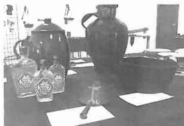
Imagen de la exposición de objetos antiguos