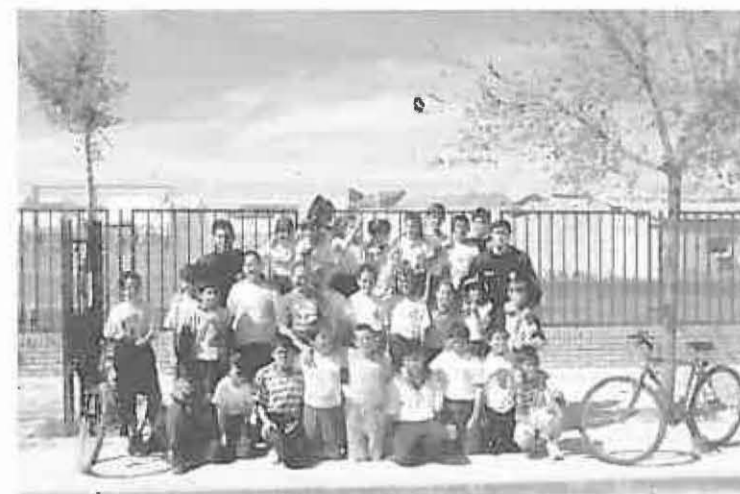
Grupo de chavales junto a policías locales