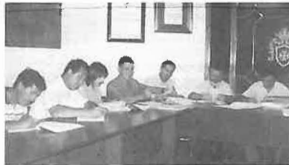
Momento de la firma del convenio

Visto expediente tramitado para la aprobación del Acuerdo Marco del Personal Funcionario y del Convenio Colectivo del Personal Laboral del Ayuntamiento de Miguelturra, la Corporación, en votación ordinaria y por una-