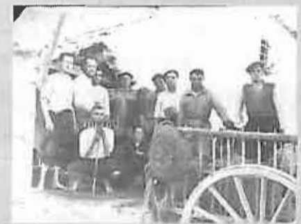
3. Las imágenes de labores agrícolas son muy frecuentes en esta sección. Valentín Díaz Rodrigo nos acerca a 1946 para ver a este grupo de trabajadores dispuestos a pisar la uva en la bodega de Jaramillo.