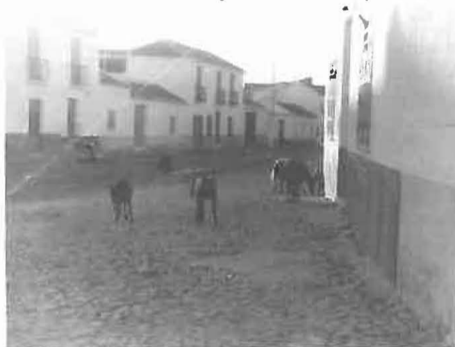
Calle Malpica. Años 60

«El rey Don Pedro despacho su mandamiento a Gonzalo Sanchez de Uceda jurado de cordova en que le ace saber como ante el rey Don Alfonso su padre habia