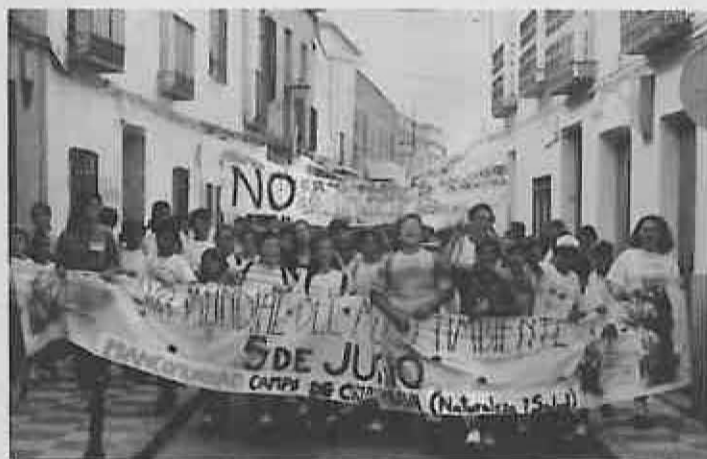
Participantes en la manifestación en defensa de la Naturaleza y Medio Ambiente

Para tal fin, se concentraron en Miguelturra unos 300 niños y niñas, con edades comprendidas entre los 10 y los 14 años, procedentes de los ocho municipios que componen la mancomunidad. Tras la llegada al municipio, los asistentes fueron concentrados en las inmediaciones del Parque, en donde se organizaron la mayoría de las actividades. Juegos, tirolinas y rápeles, fueron realizados durante todo el día. Asimismo, se presentó un espectáculo de música y magia a cargo de la cantautora Rosa Mª Muñoz de Morales y el mago