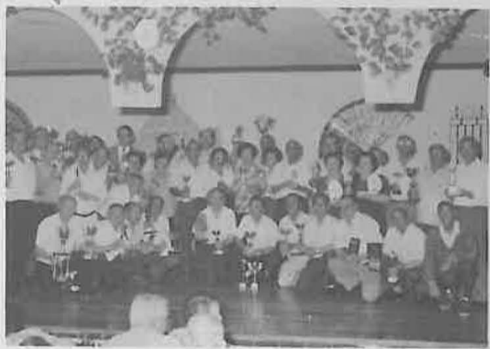
Ganadores de Trofeos en las distintas competiciones

Otro año más, desde esta Asociación de Jubilados, agradecemos la participación obtenida, esperando incrementarla en años sucesivos. Igualmente agradecemos la colaboración de organismos y entidades que hacen posible la celebración de estos VI Encuentros.