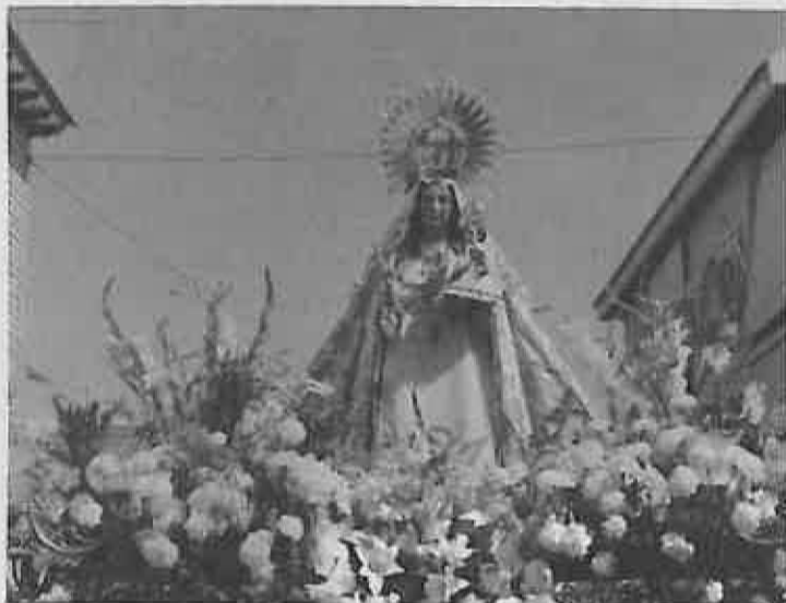
Imagen de Ntra. Sra. de la Salud

- Miércoles, día 13.- Durante este día habrá concursos de dardos, individual y por parejas, finalizando la jornada con la actuación de "Mercedes Abril" y su ballet y el gran cantante "Cigalita".