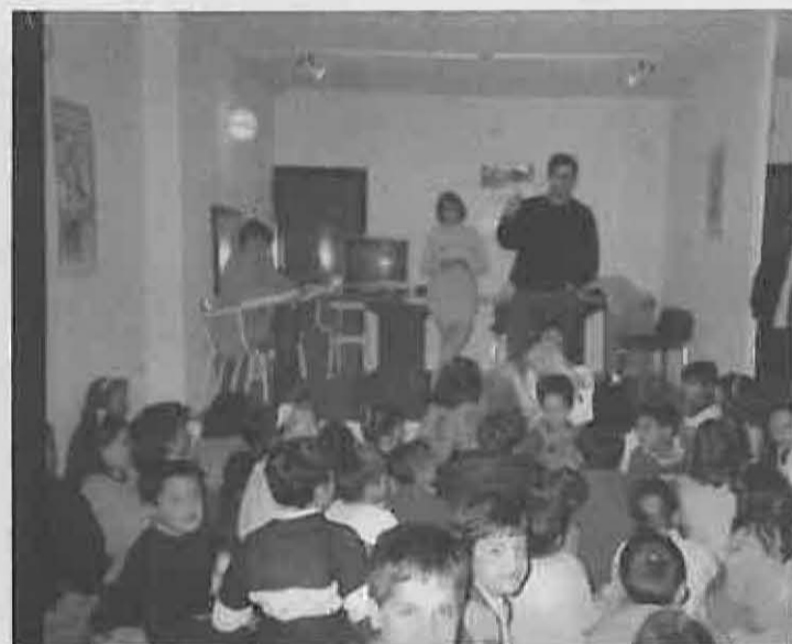
Taller de higiene buco-dental

Desde el pasado día 7 de junio, el Servicio de Ayuda a Domicilio se ha visto incrementado en 5 nuevos casos que se han su-