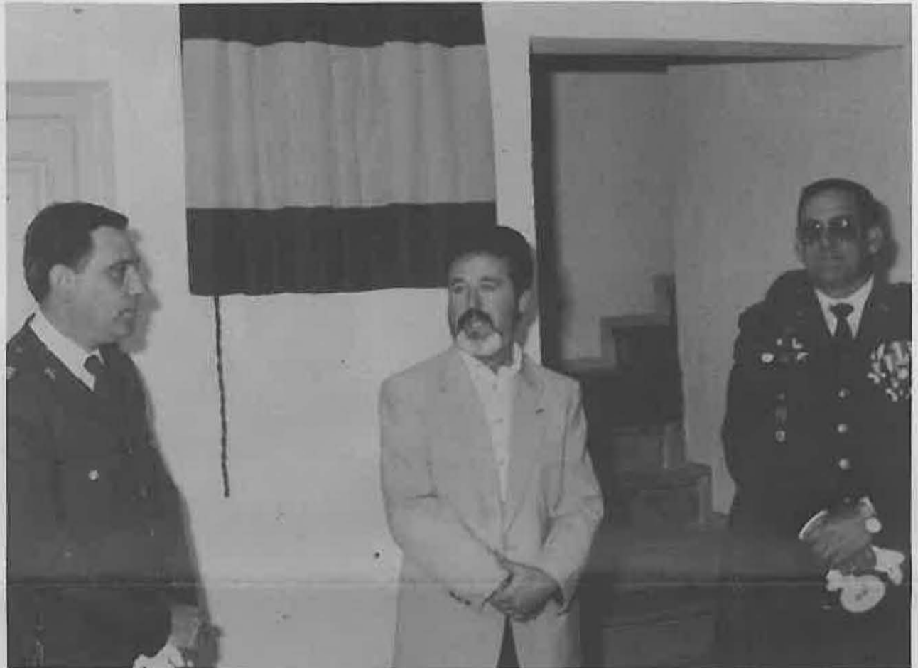
El señor Alcalde dirige unas palabras a los asistentes.

la Casa Cuartel donde se procedió al descubrimiento de una placa de cerámica ofrecida por el Excmo. Ayuntamiento, pronunciando unas palabras el Sr. Alcalde en las que destacó la ejemplaridad y entrega al servicio de unos hombres que lo habían dado todo por la sociedad y a la que servían incondicionalmente. Por su parte, el Comandante de Puesto, agradeció las pala-