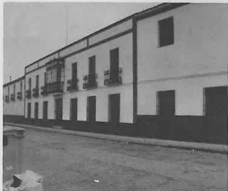
Premio a la fachada de MEJOR CONSERVACION

El premio que será de carácter simbólico, consistirá en la colocación en las fachadas ganadoras, de una placa artesanal como distintivo de este reconocimiento, de la que se encargarán los servicios de obras de este Ayuntamiento en el lugar que indiquen los propietarios.