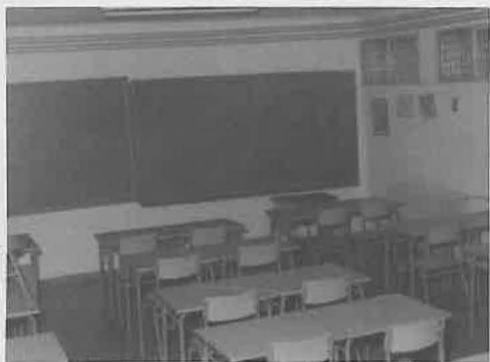
Los colegios serán su lugar de trabajo

Finalmente decir que ante cualquier solicitud, pueden dirigirse al Centro Social Polivalente para exponer su necesidad.