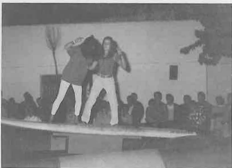
LA TABLA DE SURFING, una de las novedades