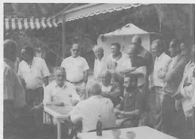
El Campeonato de Truque cuenta con muchos seguidores