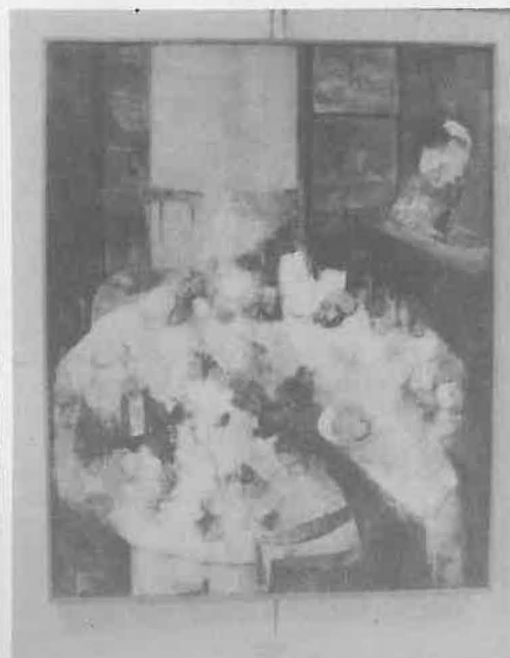
Obra ganadora del Primer Premio 1992

El próximo domingo, 10 de octubre, tendrá lugar a las 12 de la mañana, en el Salón de Usos Múltiples del Ayuntamiento, la entrega de los premios de los certámenes Carta Puebla 1993, correspondientes a las modalidades de Pintura y Novela Corta. Al acto asistirán, además de las autoridades locales, los ganadores de ambos concursos, estando también invitado todo el público en general.