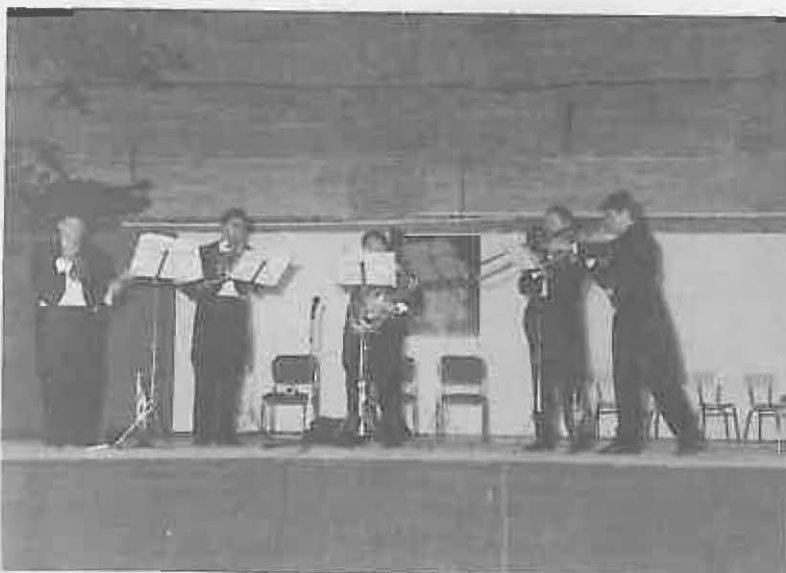
El QUINTETO "MADRID BRASS" puso la música de calidad