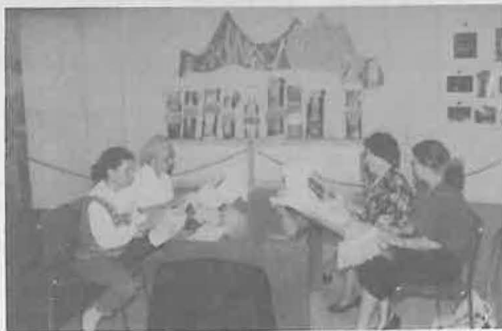
Participantes de Encaje de Bolillos en el curso 92/93

Patrocina: CONSEJERIA DE EDUCACION Y CULTURA - FONDO SOCIAL EUROPEO