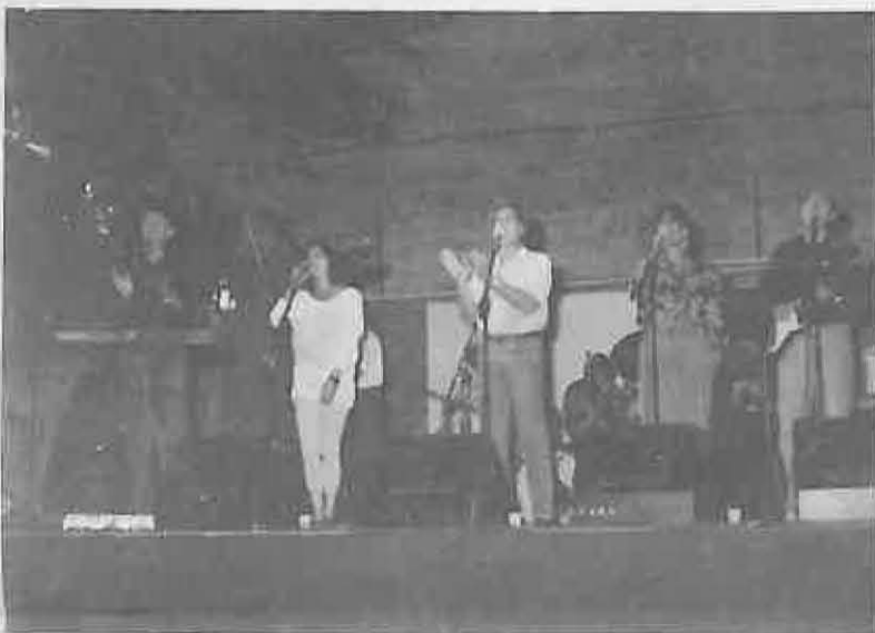
El Grupo JARCHA (Caja Madrid) abrió la semana