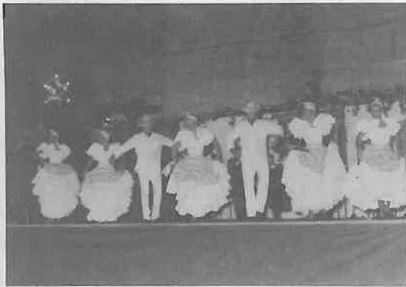
El Grupo GIRALDA DE SEVILLA fue de lo más destacado