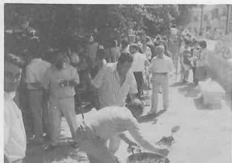
Todas las Peñas participaron en el Almuerzo