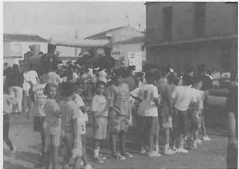
Los niños disfrutaron en el PARQUE GUAÍ