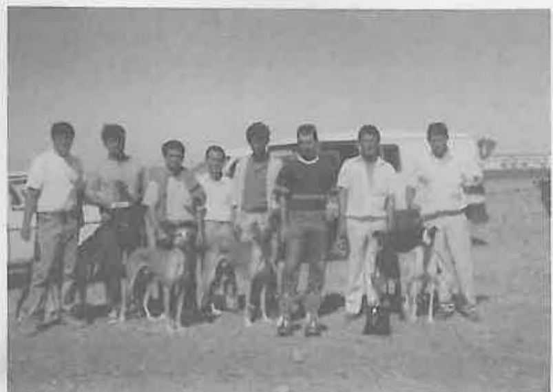
Las Carreras de Galgos, una competición original