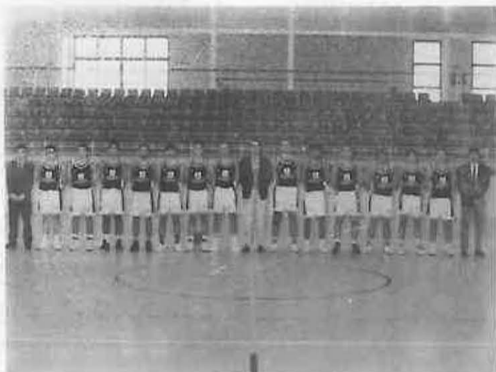
Plantilla del Club Baloncesto ALUCAL

Todos recordamos el apoyo que tuvimos del público durante el partido con el que inaugura-