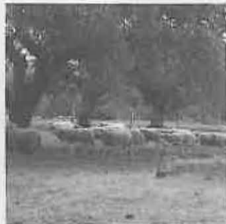
rales de Castilla-La Mancha.

Información: Delegación Provincial, Agencias de E. Agraria y Cajas Ru-