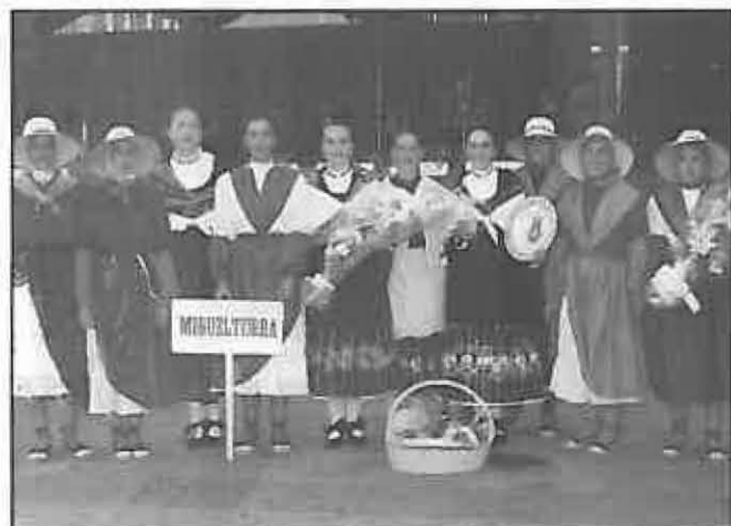
La Reina y Damas asistieron una año más a la Pandoga

Por último, destacar la importante labor que todos los colectivos locales realizan durante las fiestas ya que gracias a ellos, a su colaboración y participación es posible tener unas auténticas fiestas populares.