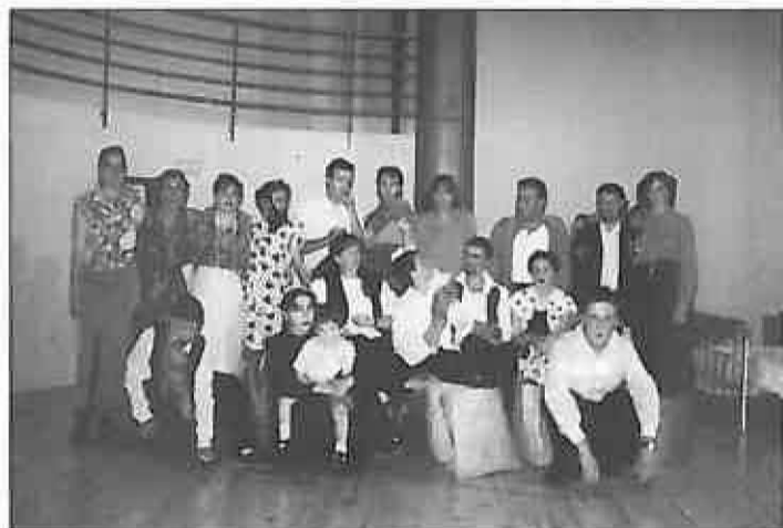
Participantes del Taller de Teatro

Durante la segunda quincena de este mes de septiembre, quedará abierto el período para la matriculación en los diversos cursos que anualmente programa el Área de Cultura a través de la Universidad Popular.