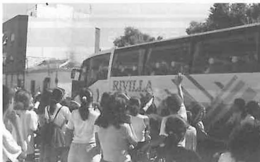
Momento de la salida del autobús con destino a Barajas

Es quizás ahora el mejor momento de llevar a efecto los muchos deseos de ayuda al pueblo saharauí que ha despertado entre nosotros esta experiencia y no dejar que el tiempo adormezca la especial motivación actual, aprovechando para promover en