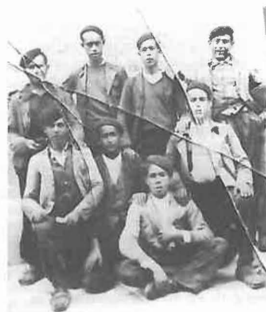
2. Aquí lo vemos —el primero de pie a la derecha— junto a otros jornaleros en la dehesilla de Lara. Era el año 1946.