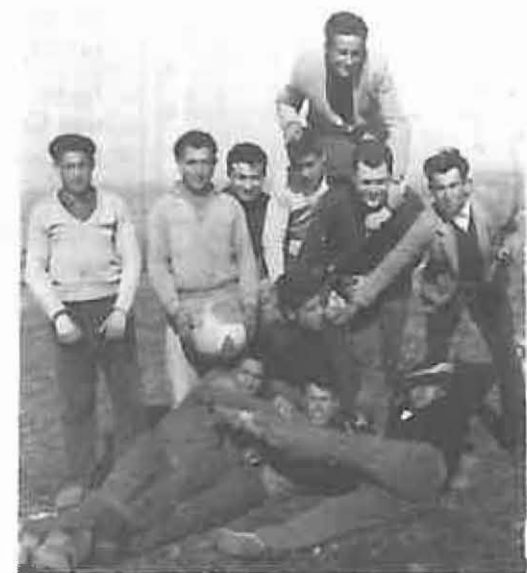
4. De la misma quinta es este grupo de amigos, reunidos en San Isidro para pasar un día de campo antes de salir cada uno a su destino (año 1963).