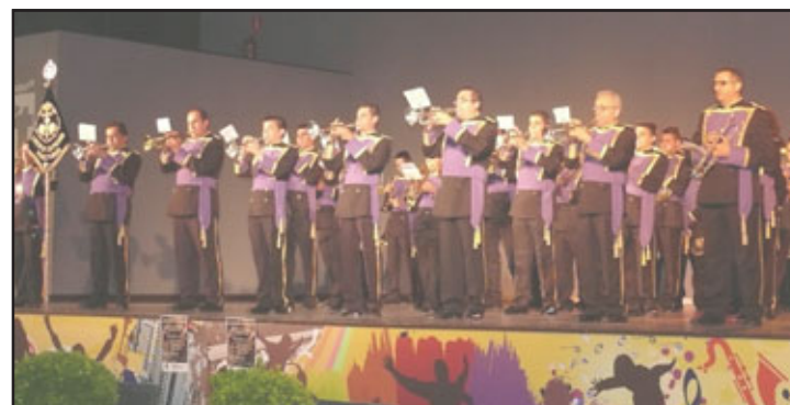
Banda de Música de la Hermandad del Cristo de la Piedad

Se recaudaron 1220 euros, destinados a los damnificados por el terremoto de Lorca, a través de Cruz Roja