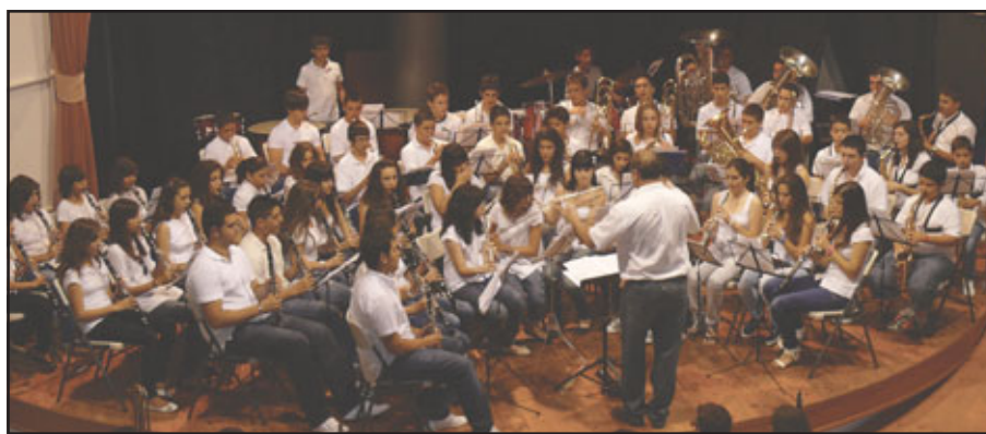
Banda Juvenil de Aldea del Rey y Moral de Calatrava