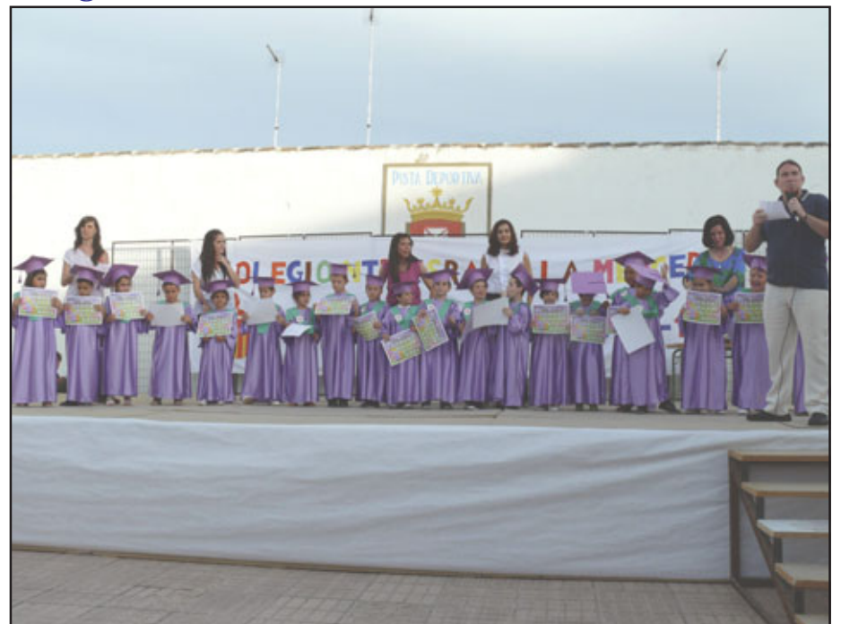
Colegio Ntr.ª. Señora de la Merced