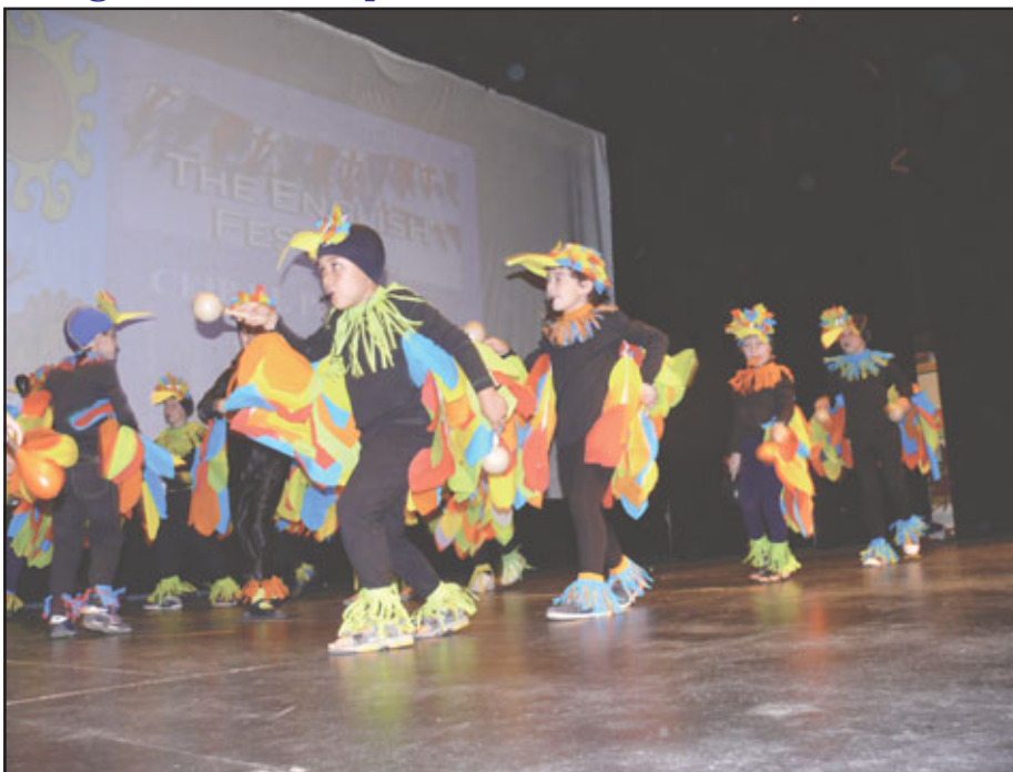
Colegio El Pradillo