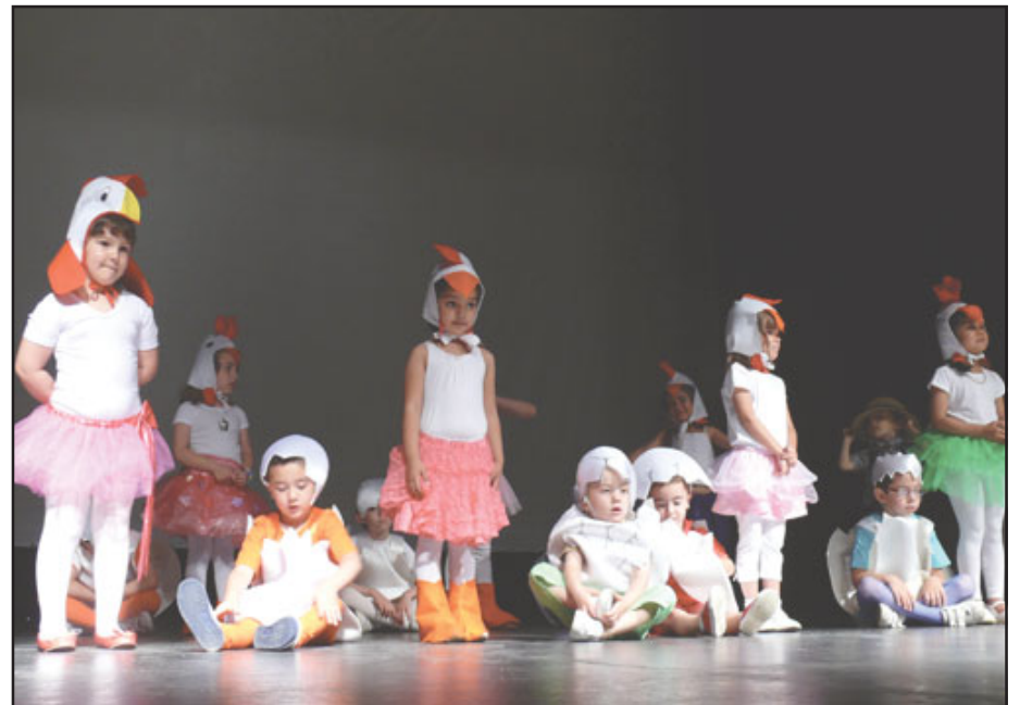
Colegio Stmo. Cristo de la Misericordia