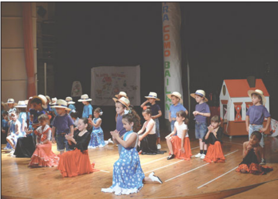
Colegio Clara Campoamor

Los centros educativos de la localidad clausuraron el año lectivo con sus fiestas fin de curso, dando participación tanto a todos sus alumnos como a sus familiares en una serie de emotivos encuentros en los que mostraron diferentes habilidades y, en varios casos, recibieron orlas y diplomas. Entre el reconocimiento a cada curso los alumnos deleitaron a sus padres con diversas actuaciones como canciones, audiciones de música, piezas teatrales, etc. Del extenso abanico de actividades dejamos alguna de las imágenes correspondientes a todos los centros.