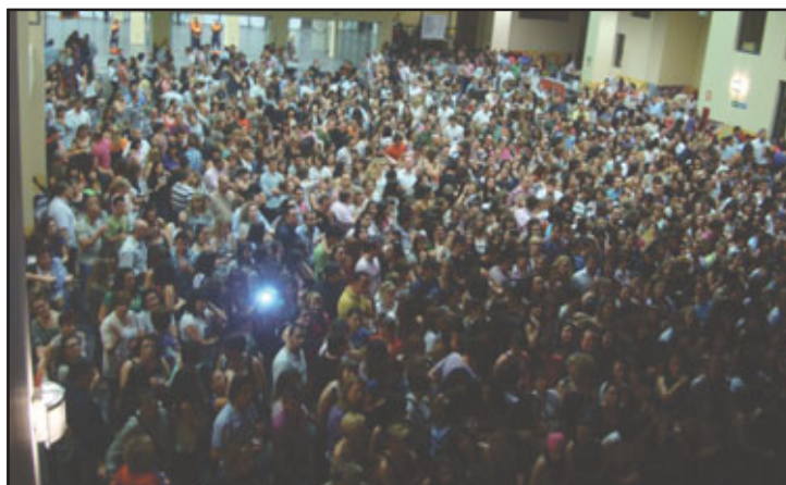
El público prácticamente llenó la sala principal del CERE

Además de su gran altura como músico que lo ha colocado con el cantante de moda, Alborán demostró una gran complicidad con sus seguidores, con quienes se mostró muy cercano. Hay que recordar que este concierto ha sido organizado por la empresa «Book Music» y ha contado con la colaboración del Ayuntamiento que ha cedido el espacio escénico del CERE. Un espacio que acogía por primera vez un concierto que además registraba una gran en-