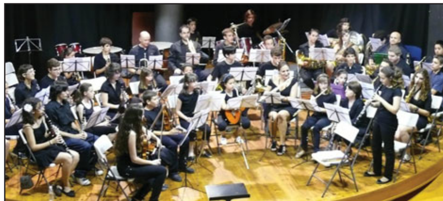
Banda Juvenil de Miguelturra

26, de nuevo en el escenario de la Casa de Cultura, actuación de los alumnos de Acordeón y Guitarra Flamenca.