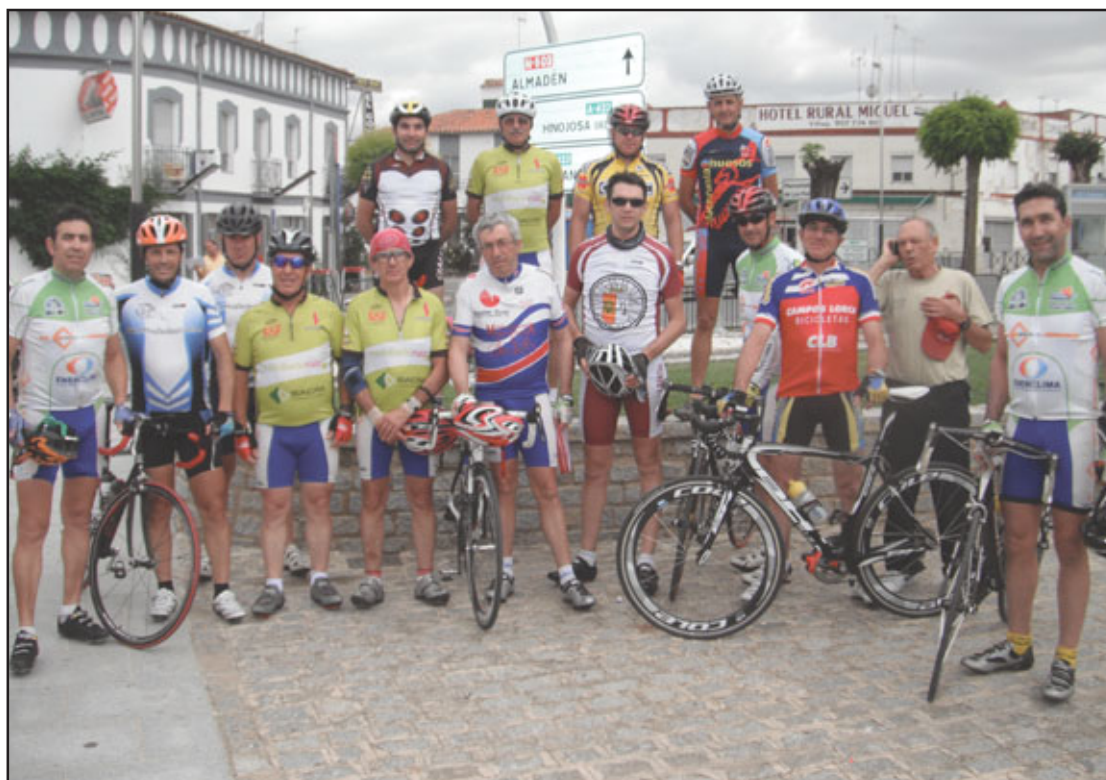
Los integrantes de la expedición, junto al presidente de la Peña, en un alto del camino

Trece miembros de la Peña Ciclista de Miguelturra y dos componentes de la Peña de BTT de Almodóvar del Campo realizaron por primera vez en su historia una ruta de cuatro días denominada « Ruta de Leyenda» cuyo recorrido fue: