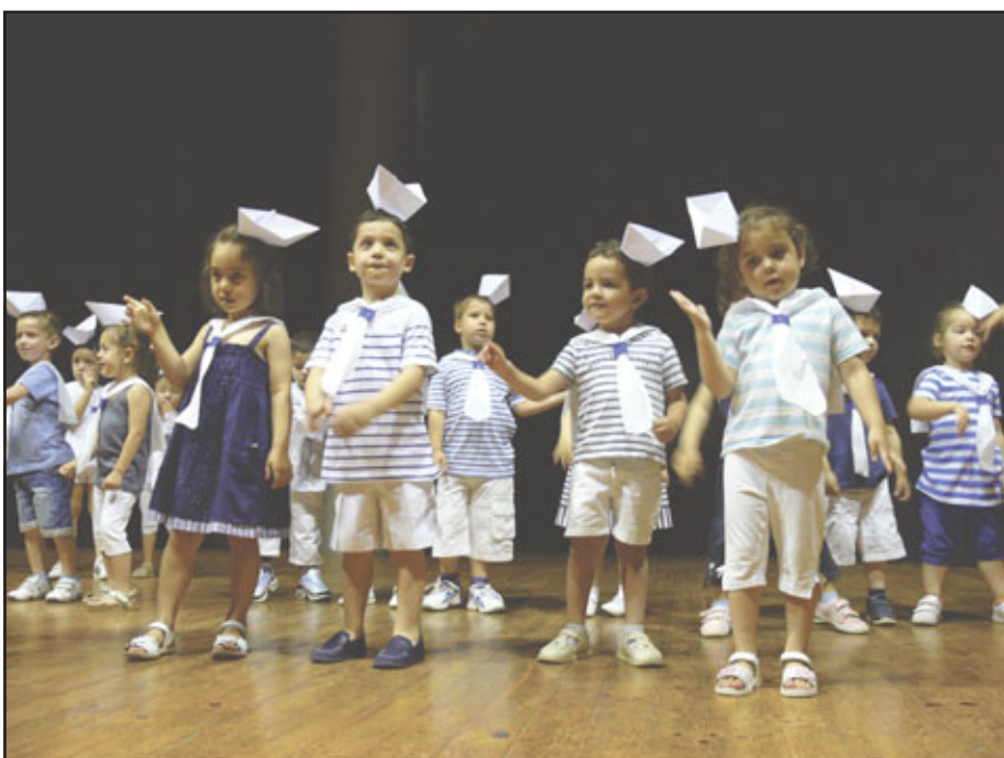
Colegio Benito Pérez Galdós