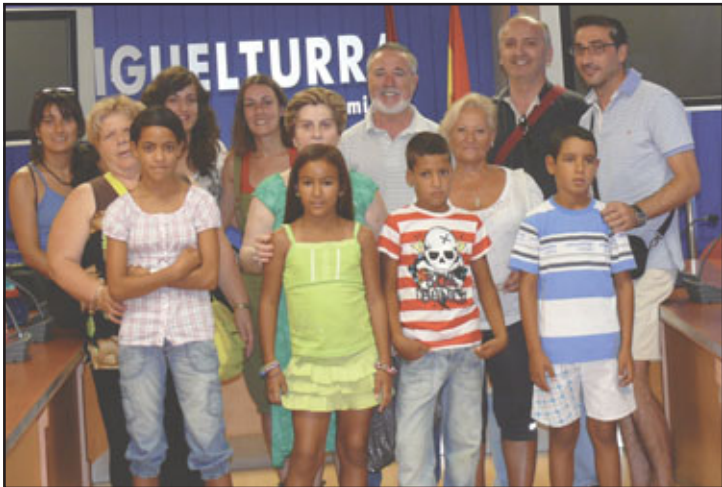
Recepción a los niños saharauís en el verano de 2010

La Asociación de Ayuda al Pueblo Saharaui de Miguelturra, Saymi, anima a las familias para que acojan a un niño saharauí este verano