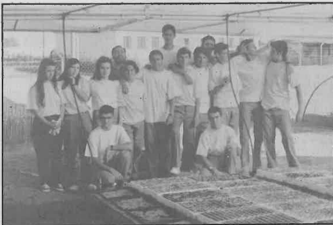
El Programa de Garantía Social fue el objeto de la visita

En Miguelturra, el curso comenzó su primera fase en el mes de junio, debiendo terminar en este mes de noviembre, dando así paso a la segunda en la que los alumnos estarán contratados por el Ayuntamiento a tiempo parcial durante seis meses; cubriéndose así el período de un año que ha de durar el programa.