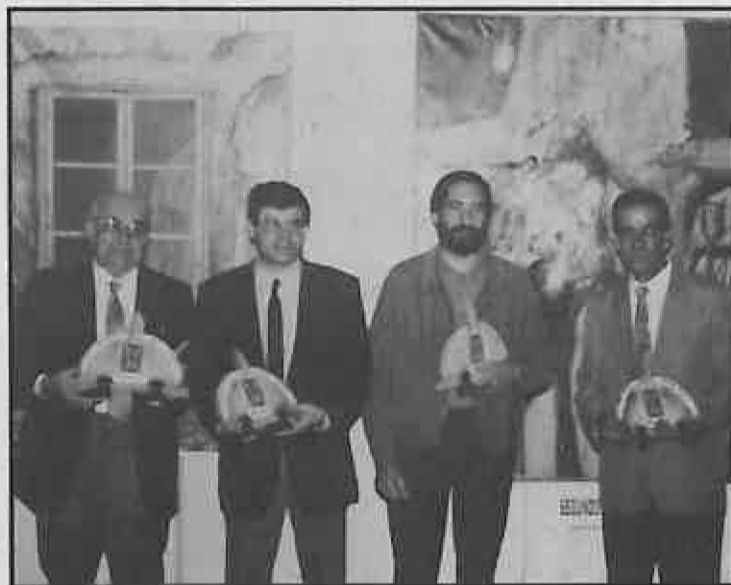
Los ganadores posan ante nuestra cámara

El pasado 16 de octubre, tuvo lugar en el salón de usos múltiples del Ayuntamiento el acto de entrega de premios a los ganadores de los distintos certámenes Carta Puebla 1994.