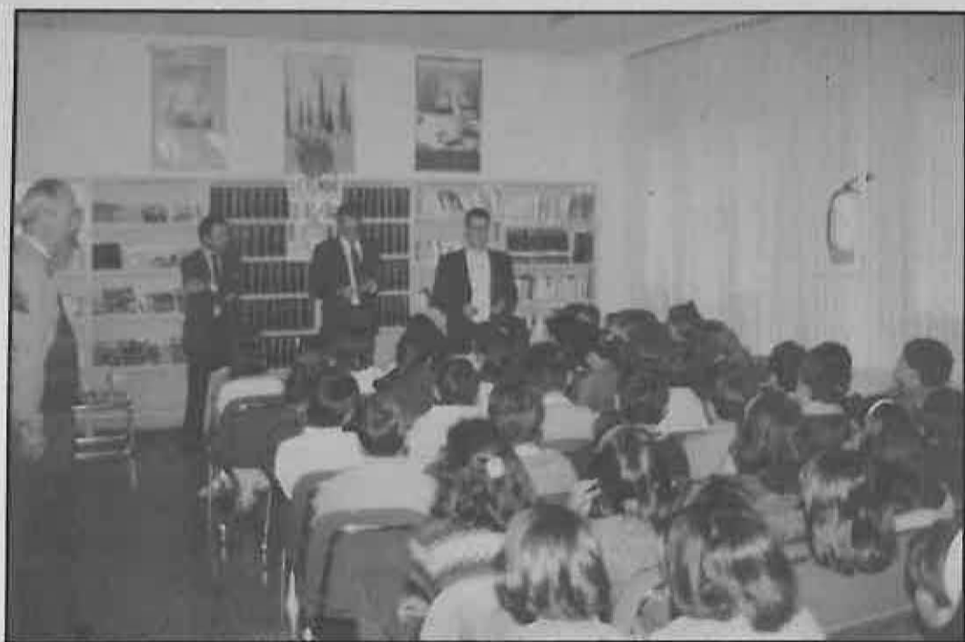
Un momento de las jornadas en 1993

Indicar que todas estas actividades, tendrán como marco la Biblioteca Municipal. De esta forma, el pueblo en general podrá conocer más y mejor las Bibliotecas, y ver que son algo más que un sitio donde se cambian libros, son centros donde se genera cultura y se despierta el interés por la lectura para crear un hábito lector en los jóvenes, imprescindible para su futura formación personal y profesional.