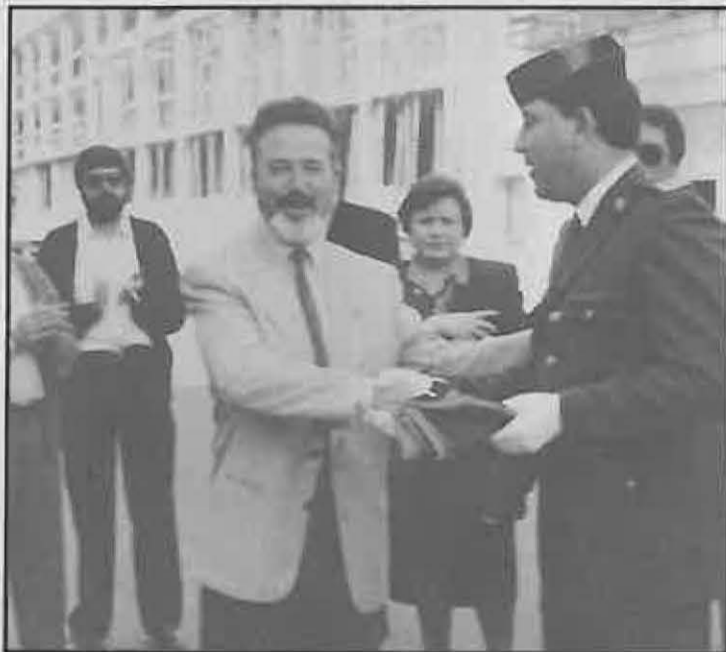
Al Ayuntamiento participó en varios actos

Año tras año, el Cuartel ve aumentar el número de ciudadanos que participan en las actividades que se programan en esta fecha tan destacada, siendo las competiciones deportivas las que se llevan la palma (fútbol-sala, tiro, dominó, petanca, etc.), teniendo todas ellas una característica común: la ampliación de las relaciones de los miembros del Cuerpo con el colectivo ciudadano al que se honran servir.