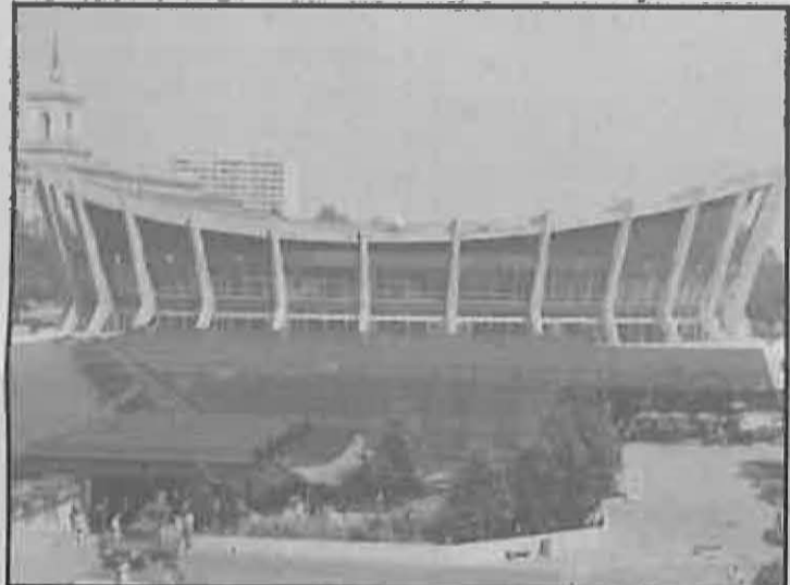
Palacio de Cultura de Varna (Bulgaria)

La respuesta del grupo Nazarín ha quedado condicio-