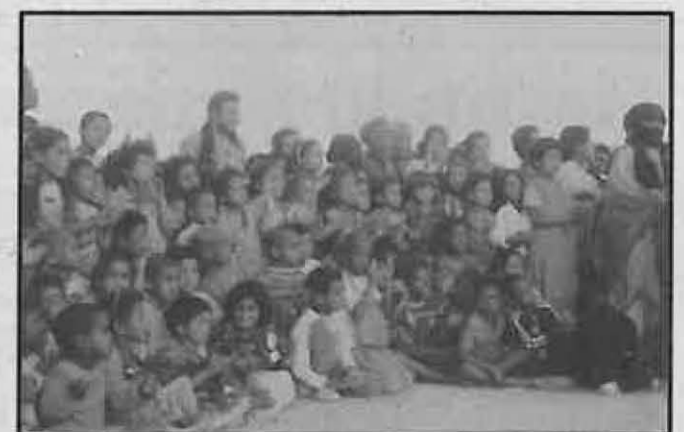
Las escuelas, objetivos prioritarios.

El objetivo del Ayuntamiento es conseguir la implicación de los colectivos sociales y locales para aunar esfuerzos a favor de esta campaña.