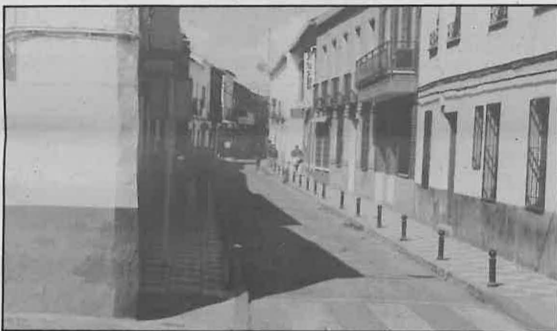
La C/ Cervantes será una de las renovadas

En el Pleno Municipal de cuatro de octubre, la Corporación aprobó los proyectos de obra que permitirán pavimentar las calles Cervantes y Miguel Astilleros por un importe de 313.268 ptas. y 912.123 ptas., respectivamente. También quedó fijada la parte del coste de las obras que deben satisfacer conjuntamente los vecinos de ambas calles por contribuciones especiales, asignando un valor al módulo de reparto de 1.741'45 ptas. para c/ Cer-