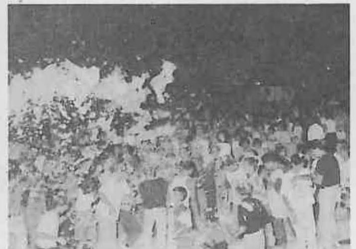
Fiesta de la espuma.

Con todo, el reto puede volver a plantearse. Una vez demostrado que la organización única del Ayuntamiento ofrece garantías; apostando por un grupo o solista de igual o superior categoría, y quizás, adelantándose en fecha a otros municipios, todo quedaría en manos de los miguelturreños y, sobre todo, de los jóvenes, para que los conciertos de música pop-rock dejen de ser en nuestro pueblo hechos aislados y, tal vez, también de ser deficitarios.