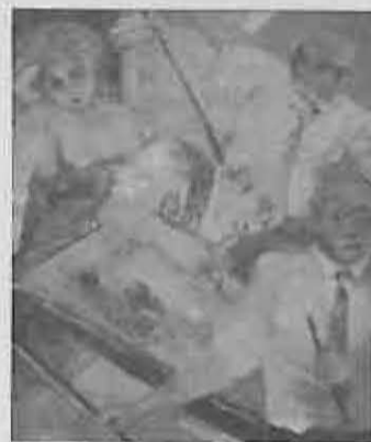
Primer Premio "Carta Puebla" 1991.