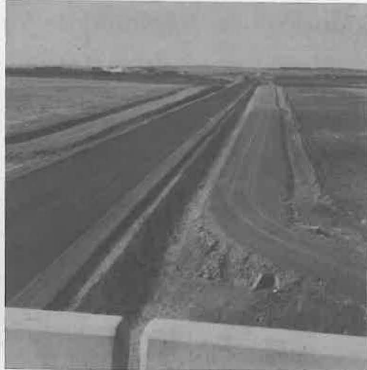
La carretera y los caminos laterales están casi terminados