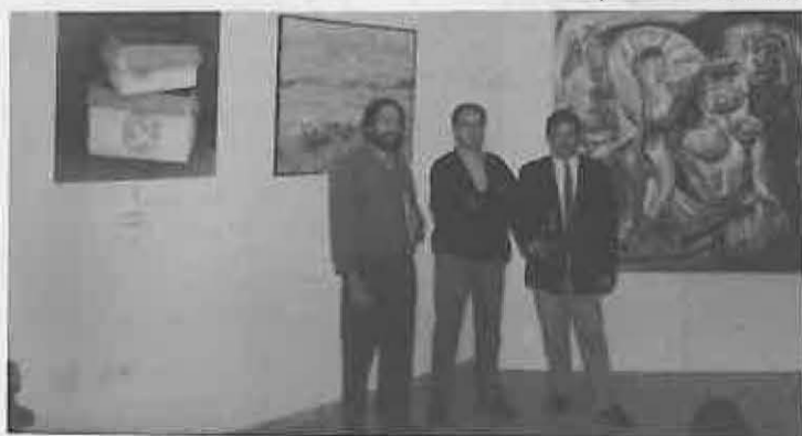
Los tres ganadores posan ante sus obras

Al finalizar la entrega de premios, se dió lectura a las Bases del XVI Certamen "Carta Puebla" que en esta nueva edición de 1994, contará con una importante novedad, el incremento a 400.000 pts. del primer premio del apartado de Pintura, manteniéndose en 200.000 pts. el segundo premio, quedando suprimido el tercero. En el apartado literario, se informó de la modalidad correspondiente, que será la de Poesía al tener carácter rotativo cada uno de los tres géneros que se vienen convocando (Poesía, Cuentos, Novela Corta).