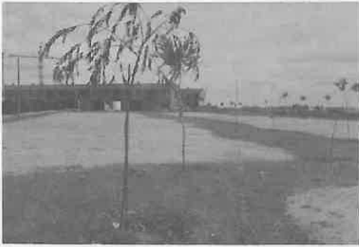
Terrenos cedidos por el Ayuntamiento

En su corta historia, este club cuenta ya con un importante palmarés, destacando un primer, un segundo y un tercer puesto en varios campeonatos de la provincia, siendo además terceros en la liga provincial; pero sin duda, con los jugadores más jóvenes es con quienes se han obtenido los mejores resultados, con dos primeros puestos por equipos, lo que les permitió participar en los campeonatos de España celebrados en Pineda del