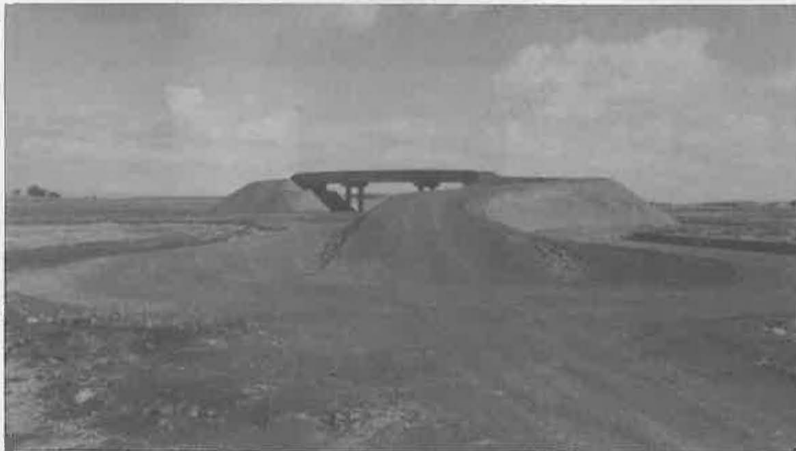
Los accesos a los puentes serán mejorados

Por otro lado, informaros del estado avanzado de las obras, estando prevista la apertura al tráfico de esta variante antes de terminar el presente año.