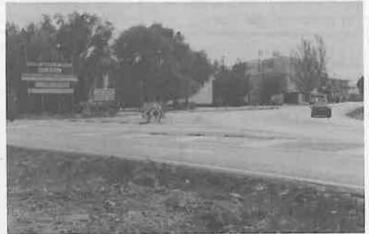
Se evitarán las esperas para entrar al pueblo

Para facilitar la entrada y salida de vehículos a nuestra localidad se construirán, en el próximo año, dos rotondas, situadas una en el actual desvío de entrada hacia la calle Real, y la otra a la altura de la nueva gasolinera, entrando al pueblo por las nuevas urbanizaciones de la zona de las Monjas.