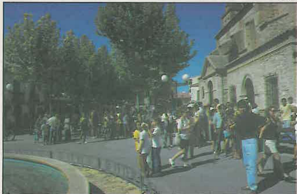
La Plaza de la Constitución congregó a cientos de personas para observar el eclipse