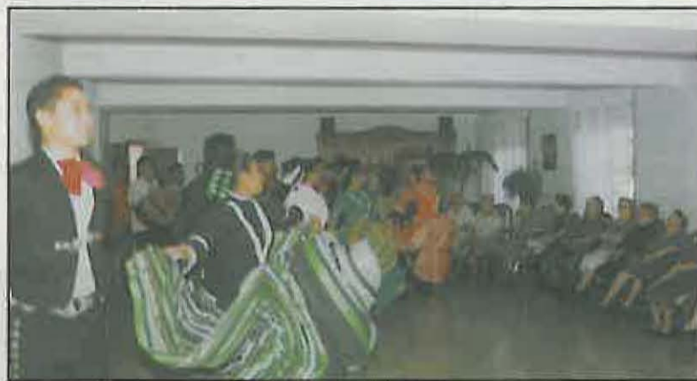
Como en ediciones anteriores, los participantes del Festival visitaron la Residencia de Ancianos

Además, gracias a la gestión del grupo Nazarín, Miguelturra se convierte durante cinco días (tiempo que los grupos extranjeros pasaron en nuestro pueblo) en sede provincial que este festival, que es también llevado a otras poblaciones como Puertollano o Argamasilla de Alba, sin que ello suponga un mayor gasto para nuestro ayuntamiento en relación con los de otros pueblos. Además ello permite la programación de otras actividades en nuestro pueblo sin coste adicional, como son las actuaciones realizadas durante el día 31 de julio y 1 de agosto en la residencia de ancianos de Miguelturra, y a la que asistieron la mayoría de los residentes y del personal que lo gestiona; no pudiendo