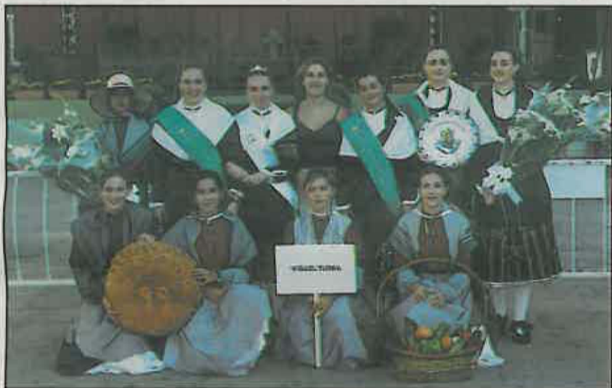
La reina y damas participaron como en años anteriores en la Pandorga representando a Miguelturra