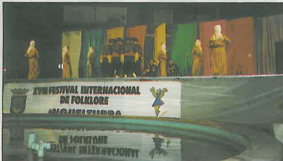
La Plaza de la Constitución fue el escenario del XVIII Festival Internacional de Folklore

Con todo, esperamos seguir en esta línea y poder ofrecer en el año 2000 un festival con mayor número de grupos y con diversas actividades culturales y festivas en su entorno.