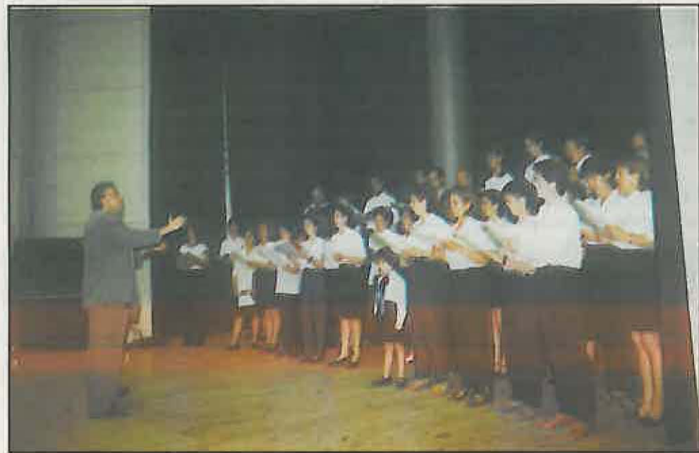
La Coral de la Escuela de Música participó en la clausura del curso 1998-99

Posteriormente se produjo el debut de nuestra coral polifónica con los nervios propios que requiere tal evento ya que la mayoría de la gente que la integra, no ha actuado nunca frente al público, fue entonces cuando pudimos comprobar la entrega,