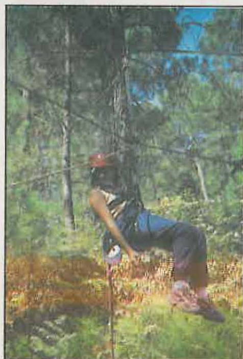
Los jóvenes disfrutaron con «la tirolina»

Según se desprende del cuestionario que rellenaron los participantes el último día, todos están entusiasmados con el campamento, manifestando su intención de participar en próximas ediciones. En estos momentos el equipo de educadores, evalúa el aprendizaje de los niños durante este periodo, dado que el campamento escuela está concebido como un instrumento para la Educación Ambiental, donde se combinan el juego con el aprendizaje a través de la investigación-acción.