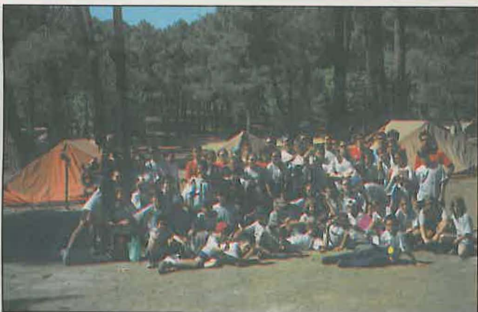
Monitores y participantes del Campamento «Riopar '99»

Del 1 al 15 del pasado mes de agosto, se desarrolló la XI Edición del Campamento Escuela de la Naturaleza, RIOPAR '99, situado en la Sierra de Alcaraz y con el incomparable marco de la Cueva de los Chorros y nacimiento del río Mundo, como escaparates naturales.