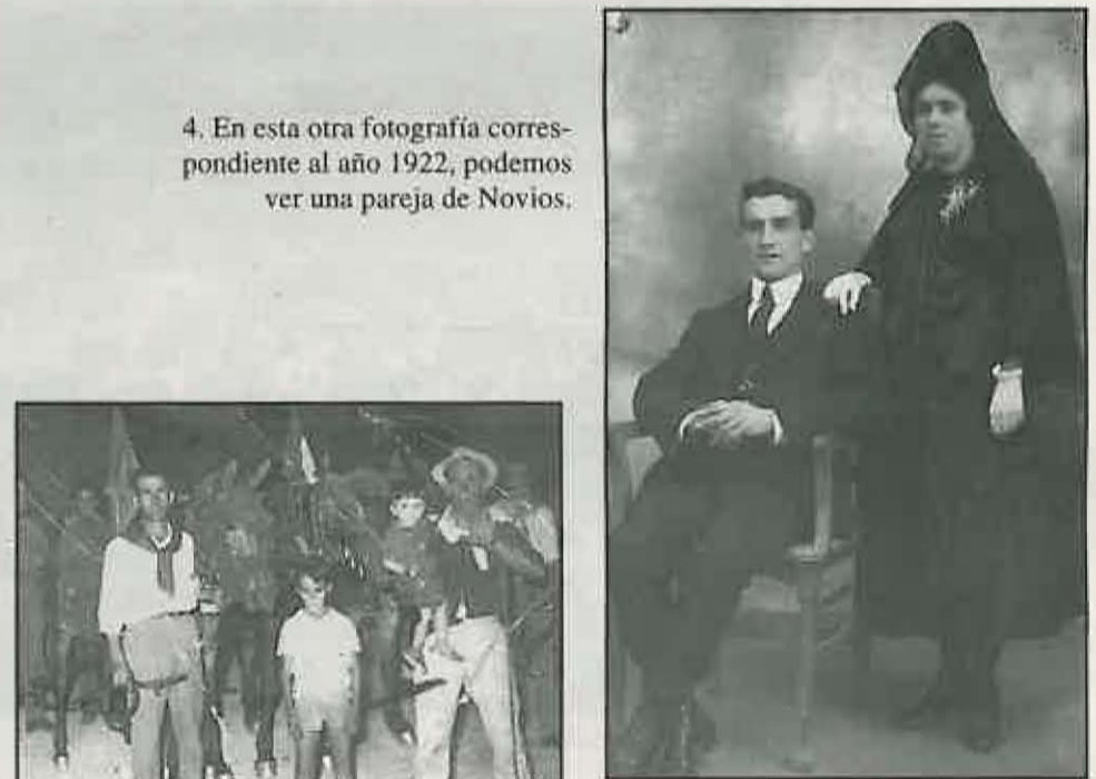
4. En esta otra fotografía correspondiente al año 1922, podemos ver una pareja de Novios.