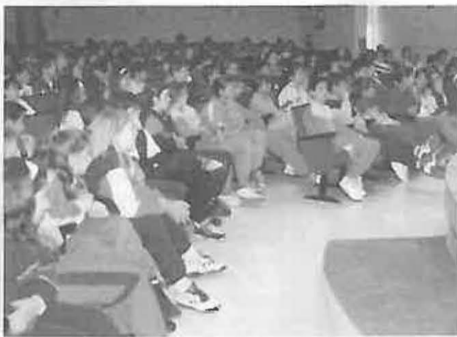
Los niños han participado asiduamente

El teatro, la música y el cine han sido los principales protagonistas de la programación presentada desde el Área de Cultura para el último tramo del año, coincidente en gran parte con las vacaciones de Navidad.