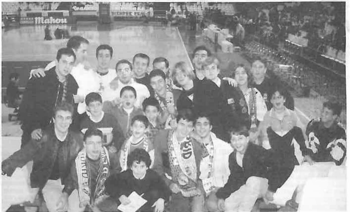
Varios jóvenes posan en el pabellón

Con motivo de la disputa del último partido de la liguilla clasificatoria del Campeonato de Europa de Baloncesto, el Patronato Municipal de Deportes, en colaboración con el Club Alucal, organizó un viaje para presenciar este encuentro, que enfrentó a los equipos del ULM de Alemania y el Real