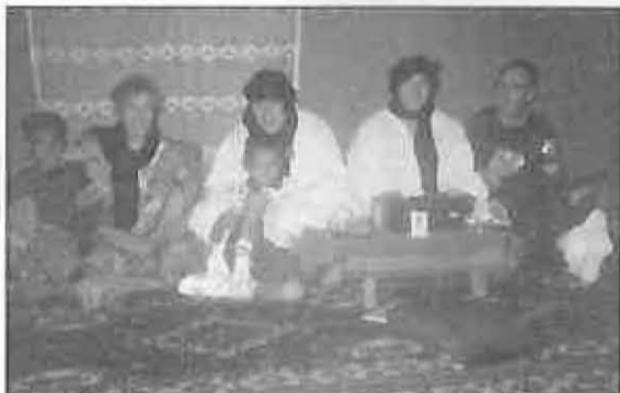
Migueltureños en una típica tienda

Desde Miguelturra se aportaron 8.200 kg. de lentejas y 485.084 pesetas en las que se incluyen ayudas procedentes de Pozuelo, Piedrabuena, Torralba, Carrión, Valenzuela y Moral.