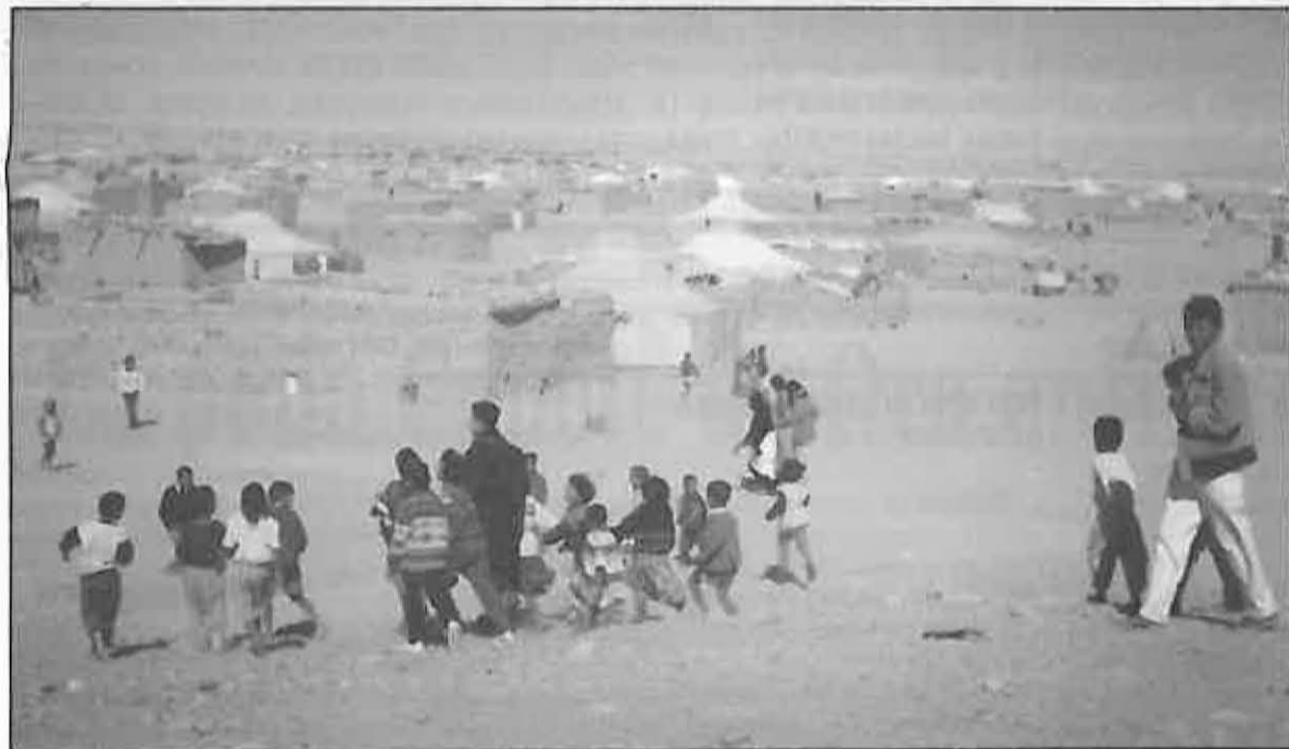
Los niños estuvieron en todo momento con los expedicionarios