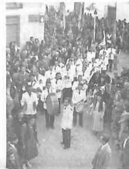
El ocho de mayo de 1949, la Banda Municipal desfila, junto a las típicas banderas gremiales, en la procesión del Stmo. Cristo a su paso desde la calle La Legión (hoy Miguel Astilleros) a la Plaza de la Iglesia.