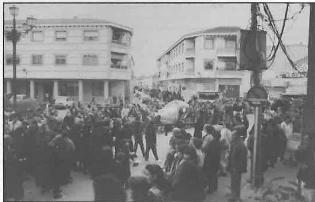
El miércoles de Carnaval será festivo