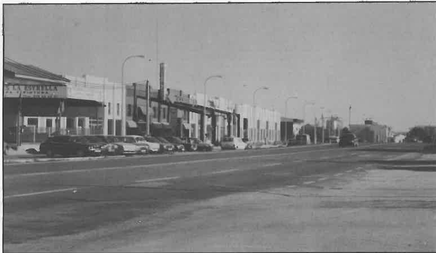
El Polígono Industrial ha contribuido a este aumento

Segun publica la revista EMPRESA del mes de octubre, editada por la Cámara de Comercio e Industria de Ciudad Real, el aumento de licencias experimentado en Miguelturra, unido al de la capital, Valdepeñas, Viso del Marqués y Bolaños, hace crecer el total de la provincia, a pesar de que son cerca de 50 las poblaciones que ven recortar este número.