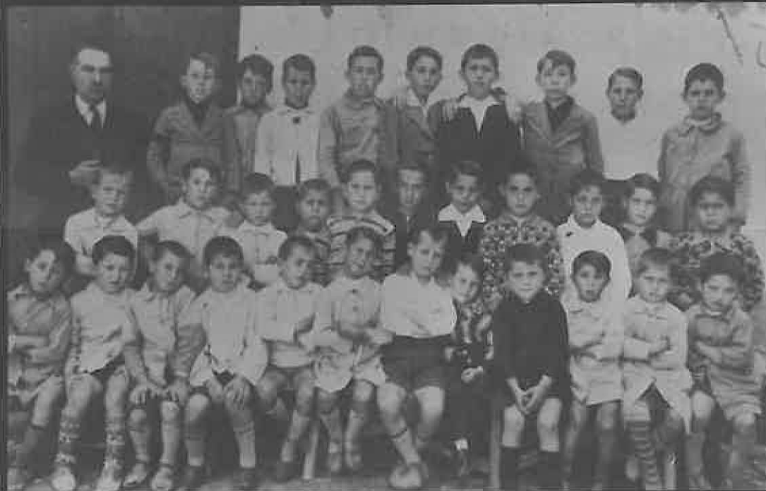
Escuela de D. Augusto (C/ El Pradillo). Año 1934.

Con esta nueva sección queremos publicar aquellas fotografías que muchas personas tienen de momentos importantes: bodas, comuniones, servicio militar,...., da igual que sean de personas, lugares o edificios. Sólo les pedimos una condición: su antigüedad (al menos con 30 años).