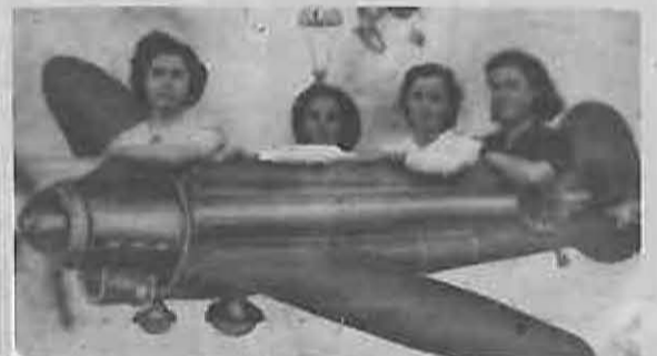
2. En el BIM nº 35 veíamos a unos aviadores de feria. Para no ser menos, ahora son las mujeres las que demuestran que ellas también vuelan, en esta instantánea de mediados de los cuarenta.