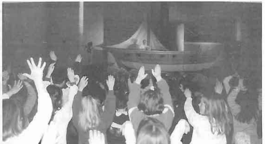
El público también participó en la obra.

Esta iniciativa del Área de Cultura no podría haberse llevado a cabo con éxito si no hubiera sido por la colaboración de los colegios así como de las profesoras que acompañaron a los niños, posibilitando el encuentro entre alumnos de distintos colegios.