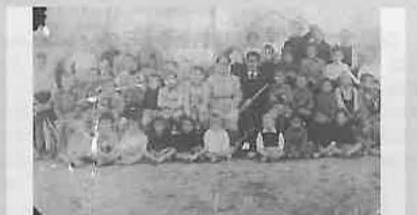
5. Jesús Romero Abad nos dejó varias fotografías. En este número publicamos esta foto de 1942, que corresponde a la escuela «Josito», situada en la calle Carretas.