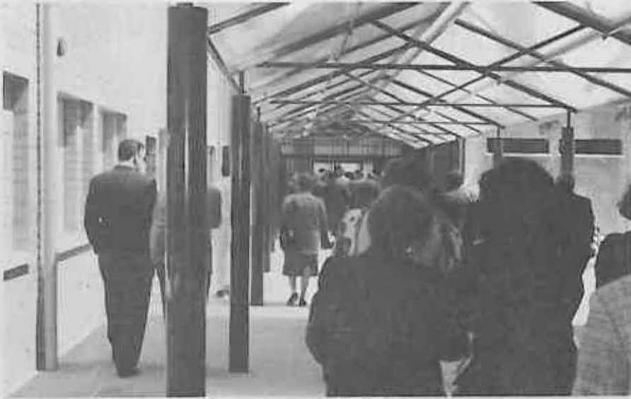
Los accesos al ala de Talleres están protegidos