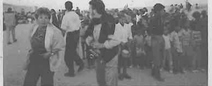
A la llegada, la Comisión fue recibida por la práctica totalidad de los refugiados en la daira Dchera