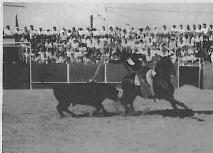
En el festejo no faltarán los rejones

que se obtenga será beneficioso para nuestro pueblo