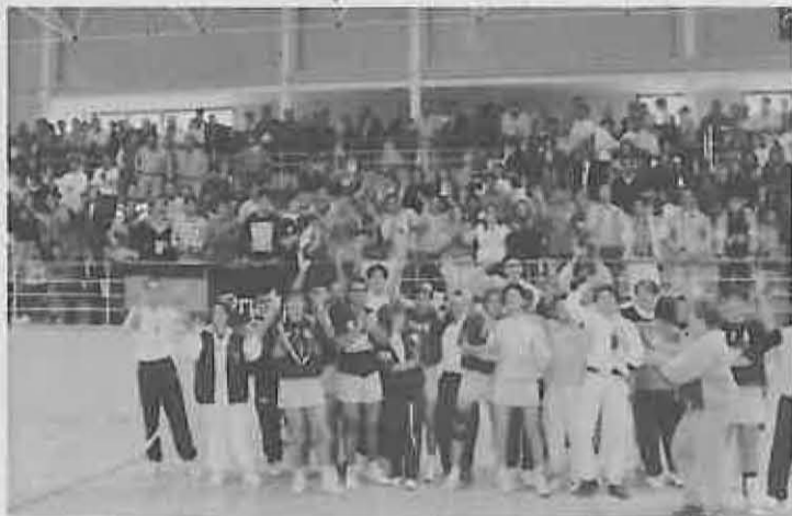
La A.D.V. se proclamó campeón del intersector

El pasado 9 y 10 de abril, se celebraba en el Pabellón Municipal del Intersector Nacional Juvenil Masculino de Voleibol, quedando 1º clasificado y Campeón, la ADV Miguelturra. Por segunda vez en su historia, el equipo juvenil masculino entra en la Final Nacional, al no perder ni un solo set ante magníficos equipos como el CV J.L. Poulet de Puerto Santa María, IBLA Melilla y el CV Gran Canaria.