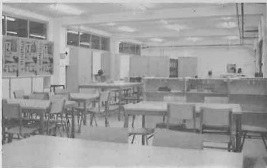
El Aula de Pretecnología, una de las mejor equipadas