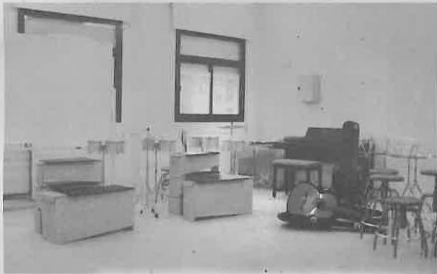
El aula de Música dispone de variados instrumentos