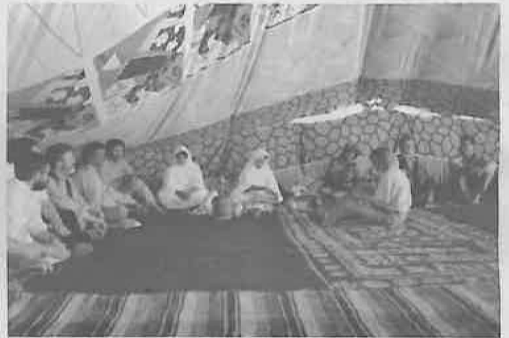
Dentro de su humildad, los anfitriones dieron un digno trato a sus visitantes. El té no faltó en los momentos de descanso