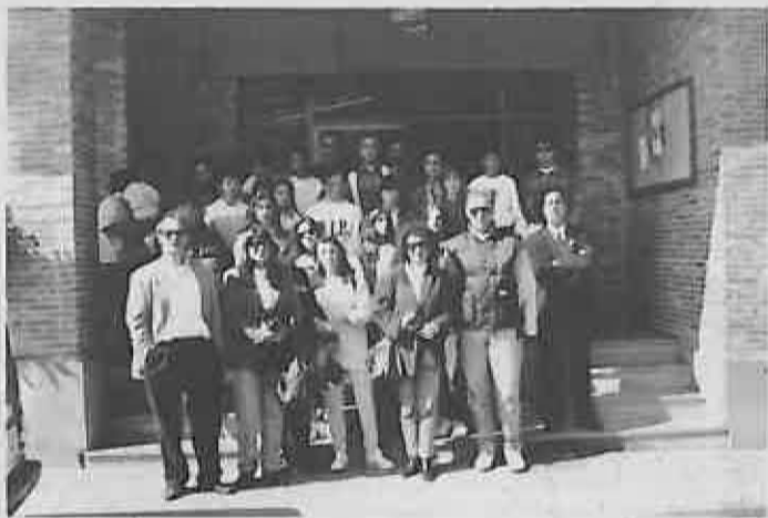
Nuestros visitantes posaron ante el Ayuntamiento.

En nuestro próximo boletín informaremos de esta visita.