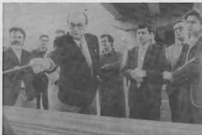
Momento de la inauguración oficial

El Consejero de Obras Públicas, Aureliano López Heredia, inauguró el pasado 15 de abril la variante de Miguelturra, que une las carreteras C-415 y C-512, permitiendo el paso de tráfico desde Pozuelo de Calatrava hasta la carretera de Fuensanta sin pasar por Miguelturra.