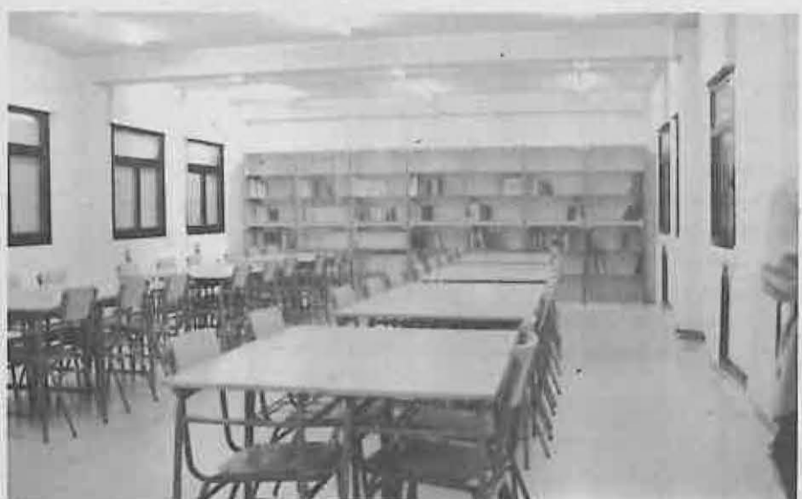
El Instituto dispone de Biblioteca propia