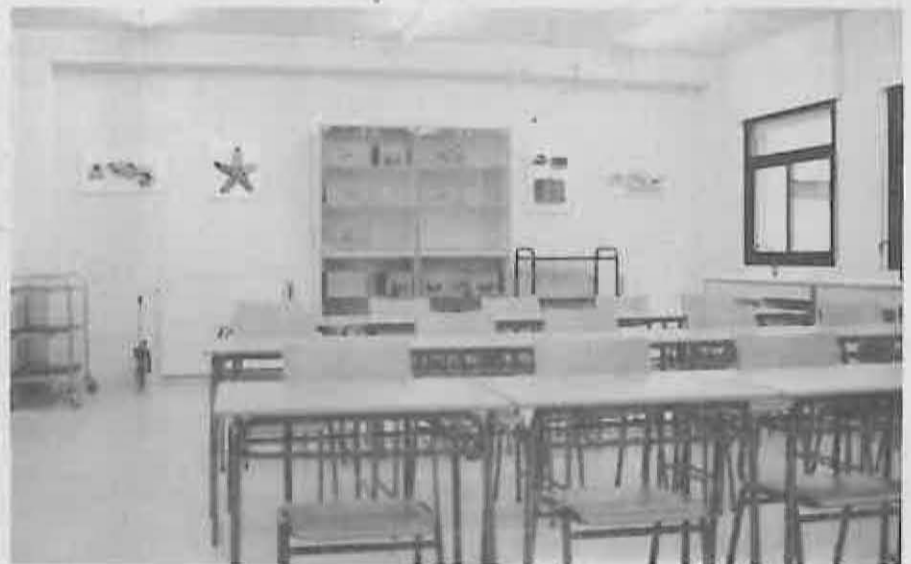
Sala de Ciencias Naturales