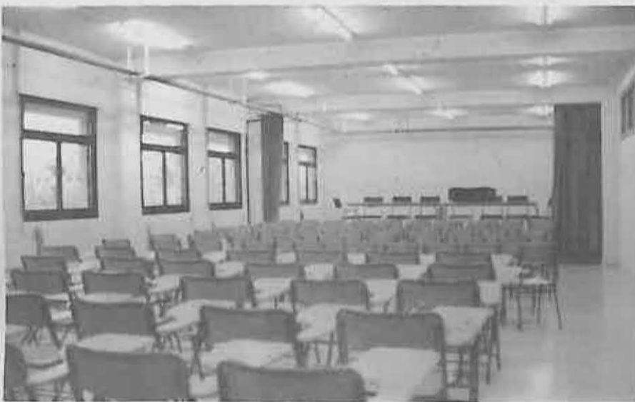
Salón de Actos con capacidad para 150 personas