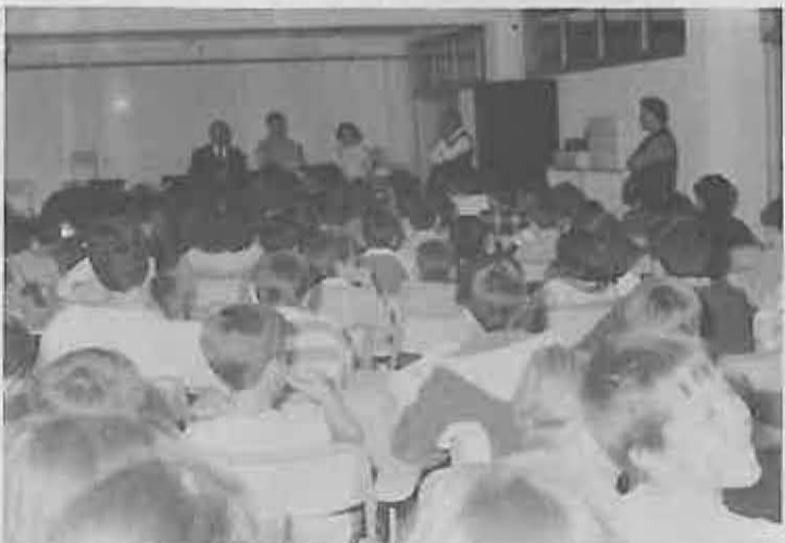
La inscripción fue muy alta

Indicar por último, que en este proyecto de la Mancomunidad de Municipios del Campo de Calatrava, participan los Ayuntamientos de: Almagro, Bolaños, Carrión de Calatrava, Granátula de Calatrava, Miguelturra, Pozuelo de Calatrava, Torralba y Valenzuela de Calatrava.