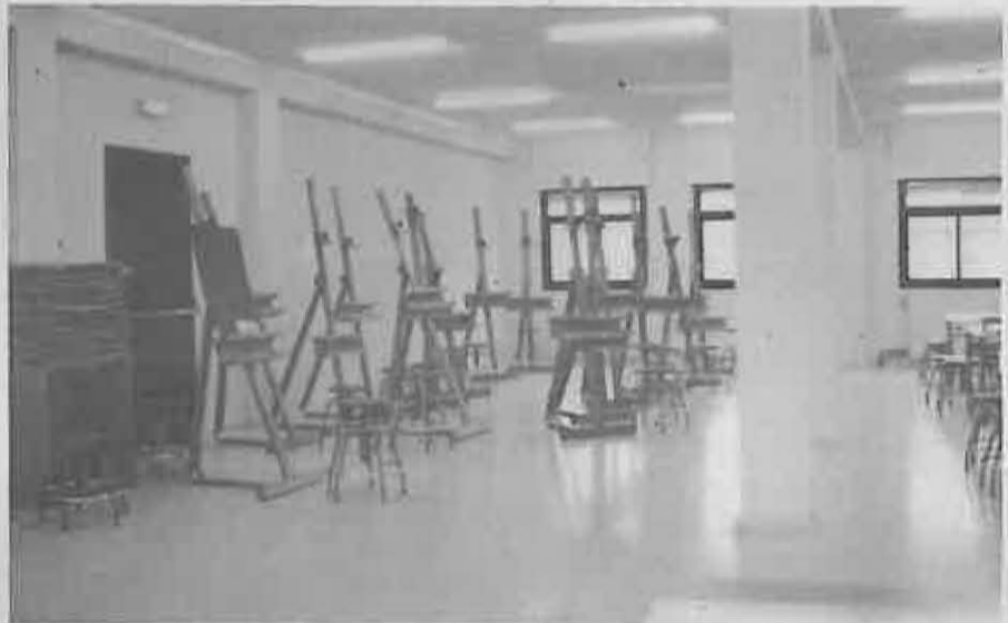
Aula de pintura