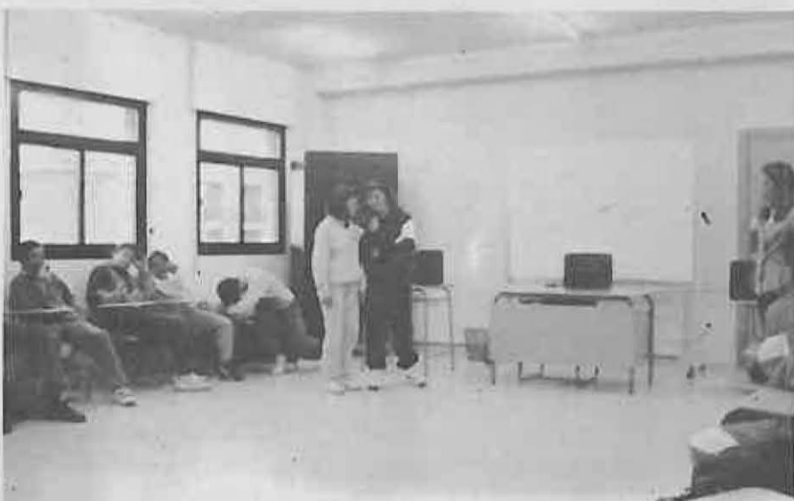
El Karaoke, una práctica más del aula de música