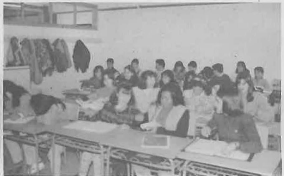
Dispone de 28 aulas para alumnos