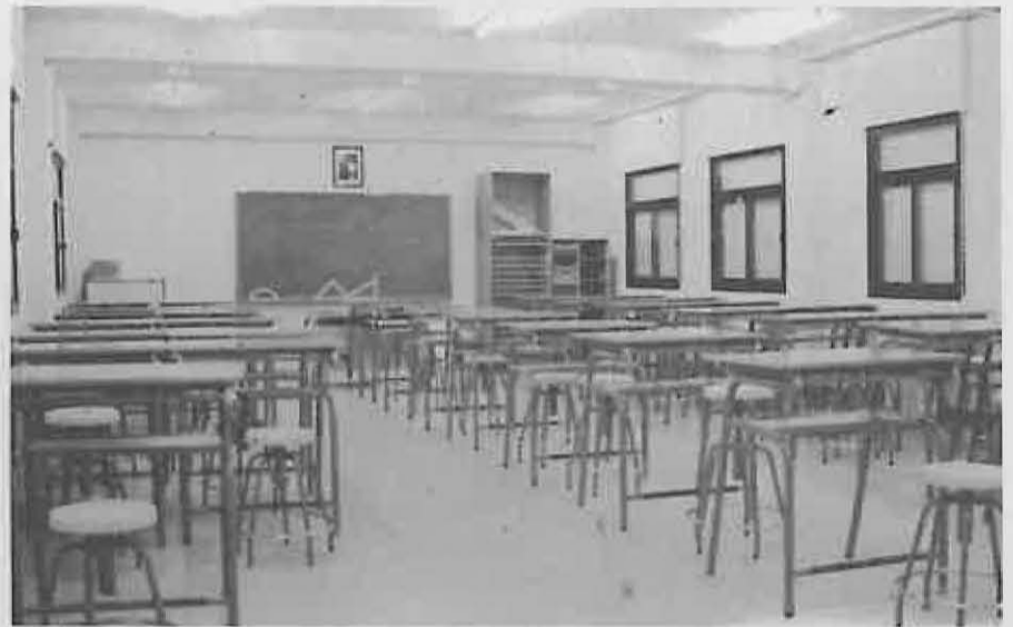
Sala de Dibujo