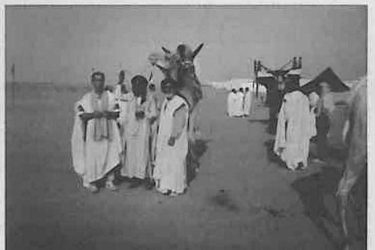
La dureza del clima aconsejaba el uso de prendas acordes. Nuestros embajadores pasaron como propios nativos.