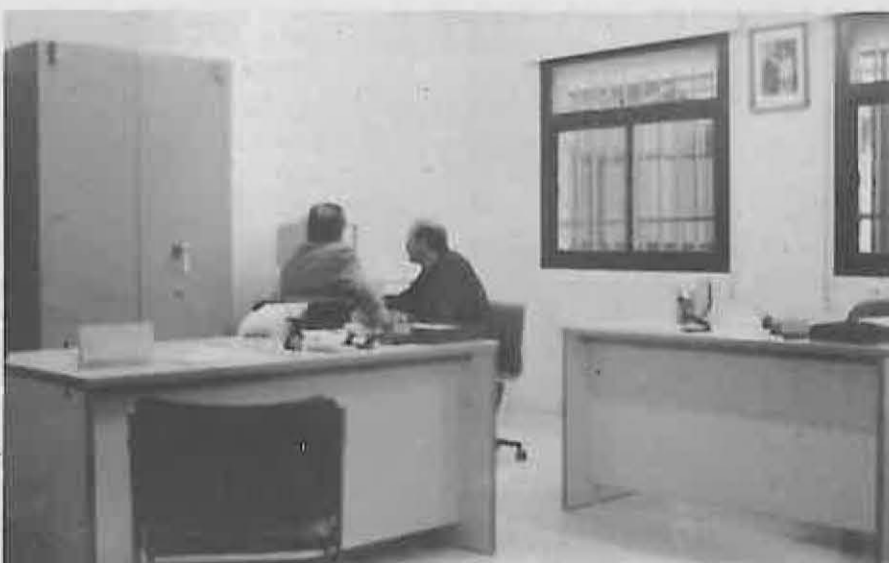
La Secretaría, debidamente informatizada