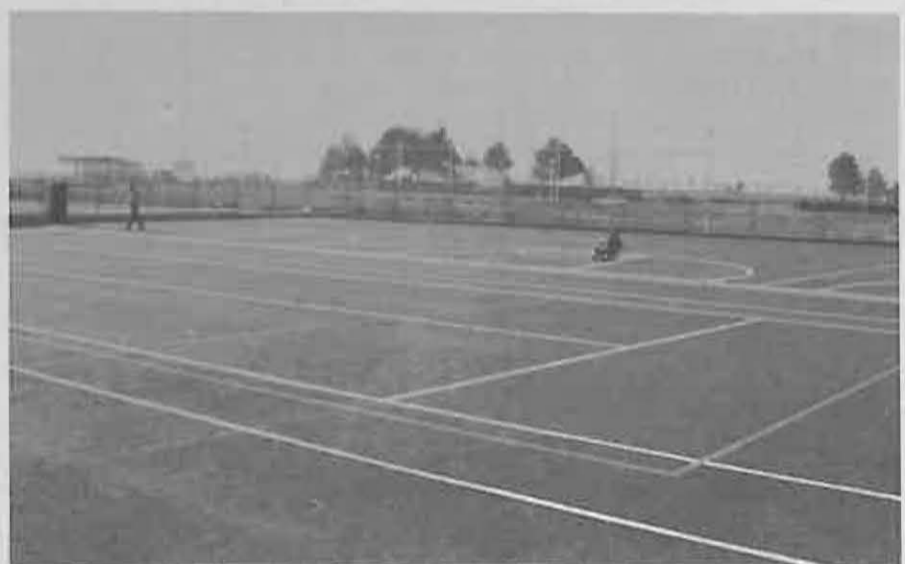
Además del Gimnasio, el Centro cuenta con dos Pistas Polideportivas