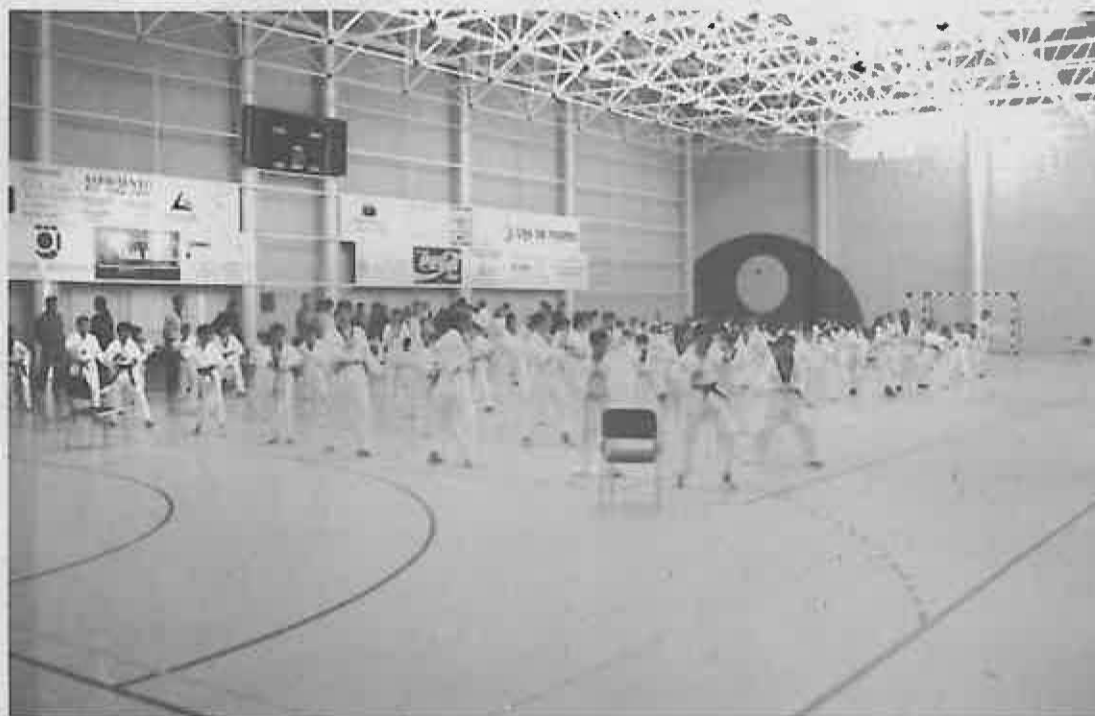
Se registró una amplia participación

El sábado día 16, tuvo lugar el II Campeonato Provincial de Taekwondo "Villa de Miguelturra" en categoría infantil.