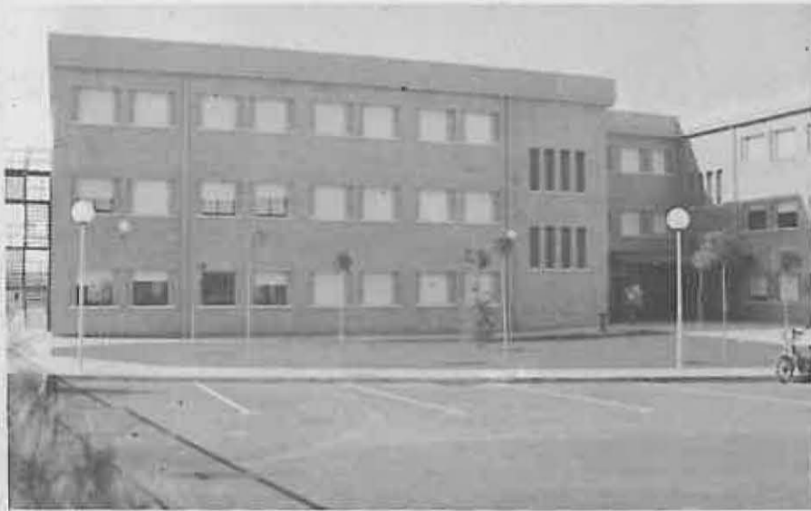
El centro dispone de amplios espacios