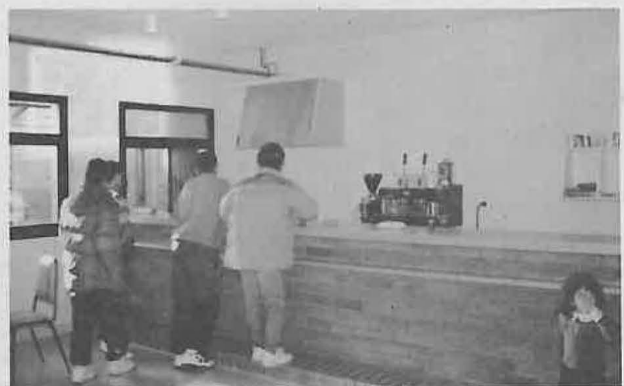
El Centro también dispone de Cafetería propia