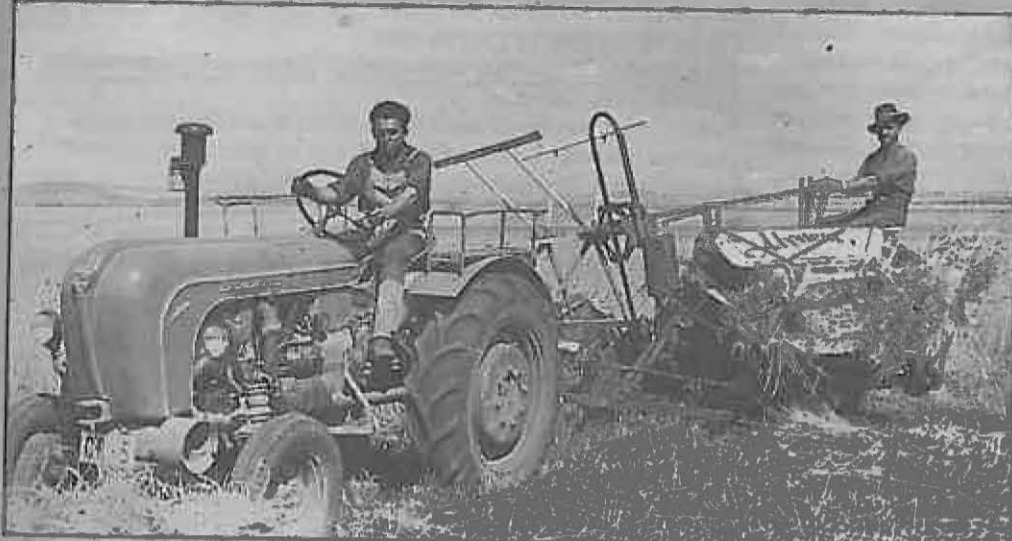
Octavio Marín nos trae esta imagen de 1955 en la que dos segadores manejan una de las primeras máquinas. Obsérvese la matrícula del tractor CR-5.