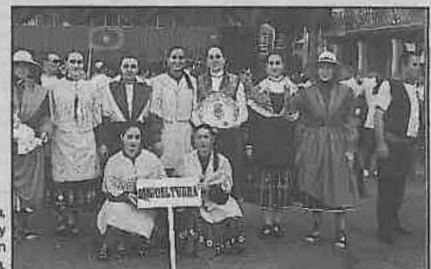
Reina, Damsas de Honor y acompañantes en la Pandorga.

NUEVO TELEFONO DE LA PARADA DE TAXIS: 242020