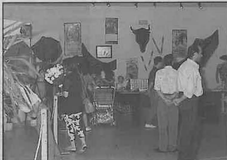
EXPOSICION TAURINA EN EL AYUNTAMIENTO

Se ha perdido un anillo sello de comunión, con las iniciales J.M. Quien lo encuentre puede entregarlo en las oficinas de la Casa de Cultura.