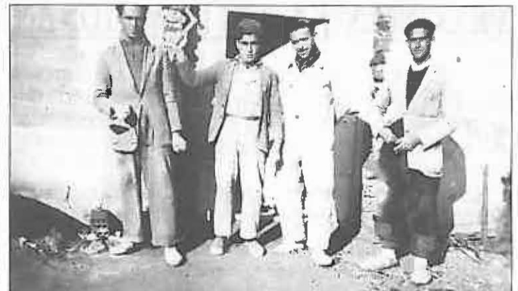
También de 1951 es esta fotografía de albañiles que se encontraban trabajando en el anejo de Las Casas.