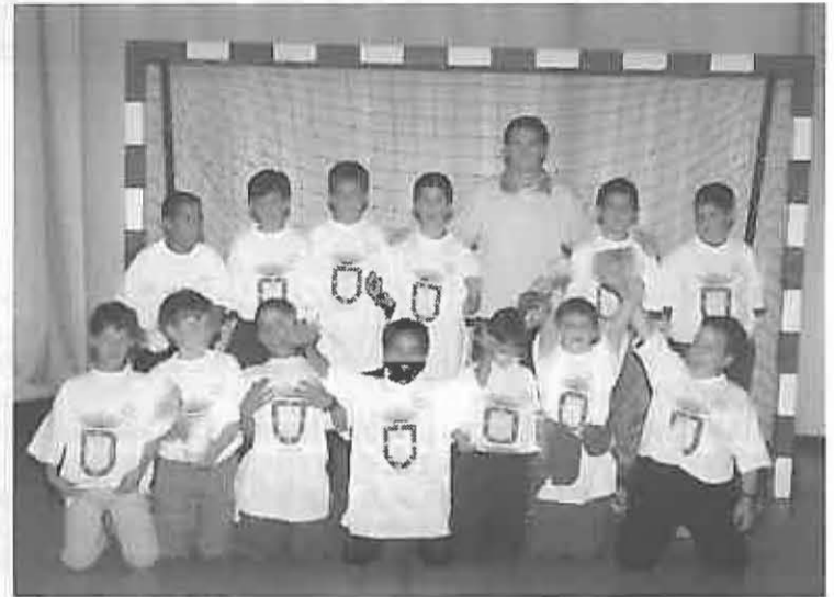
Componentes de la escuela de fútbol

Más de seiscientos niños y niñas de las Escuelas Deportivas de categorías Benjamín, Alevín, Infantil y Cadete, asistieron a la Clausura de las Escuelas Deportivas en el Pabellón Municipal, con diferentes demostraciones de juegos deportivos de los futuros deportistas de Miguelturra.