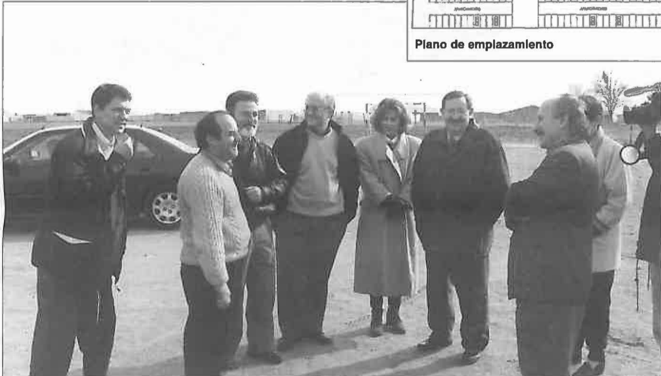
Los delegados provinciales de las diferentes consejerías durante su visita reciente al Barrio