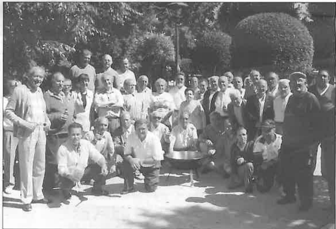
Los jubilados posan junto al alcalde y la delegada provincial

Desde el 8 al 15 de junio se ha venido celebrando un amplio programa de actos, con motivo de una nueva edición de la Semana Cultural de los Jubilados de Miguelturra y para la que han contado con la colaboración de la Junta de Comunidades; el Ayuntamiento, (con la Concejalía de Bienestar Social y el Patronato de Deportes) y la Caja de Madrid.