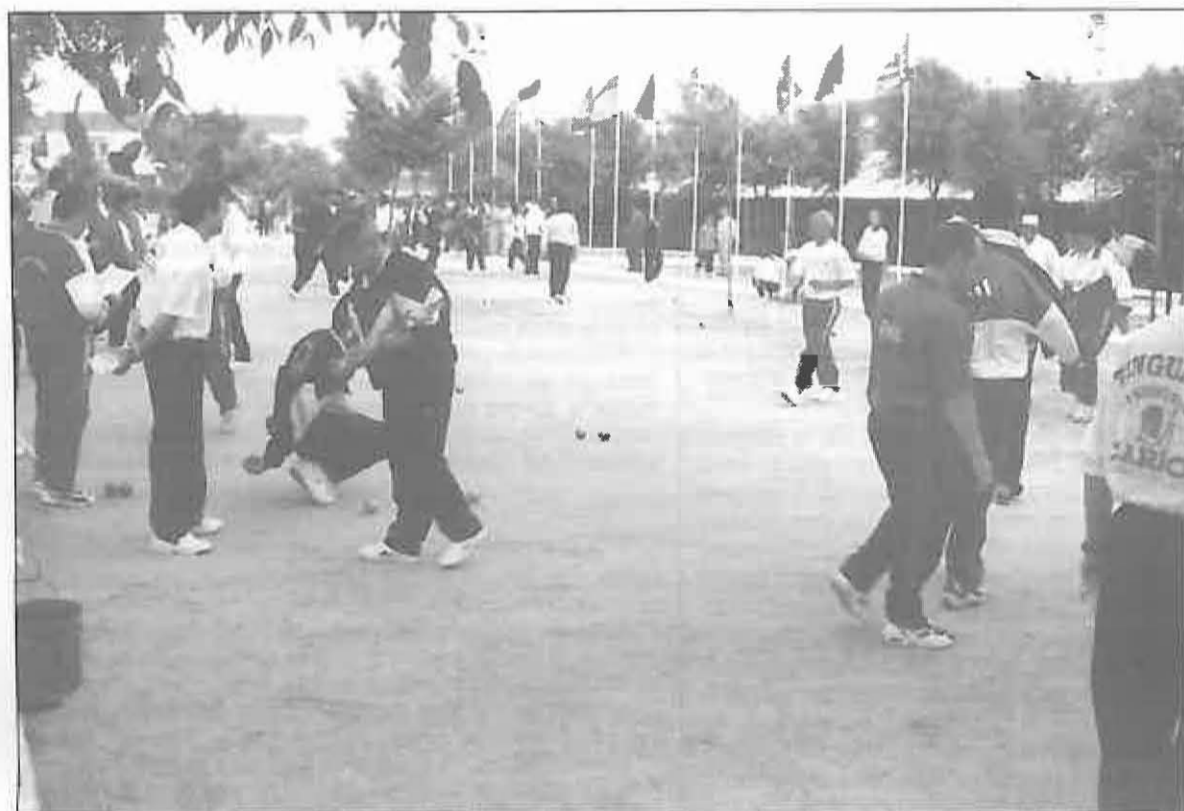
Los mejores jugadores de España se dieron cita en los campos Primero de Mayo

Miguelturra ha sido sede del XL CAMPEONATO DE ESPAÑA DE PETANCA DE CLUBES DE 1ª CATEGORÍA, organizado por la Federación Española de Petanca, el Patronato Municipal de Deportes y el