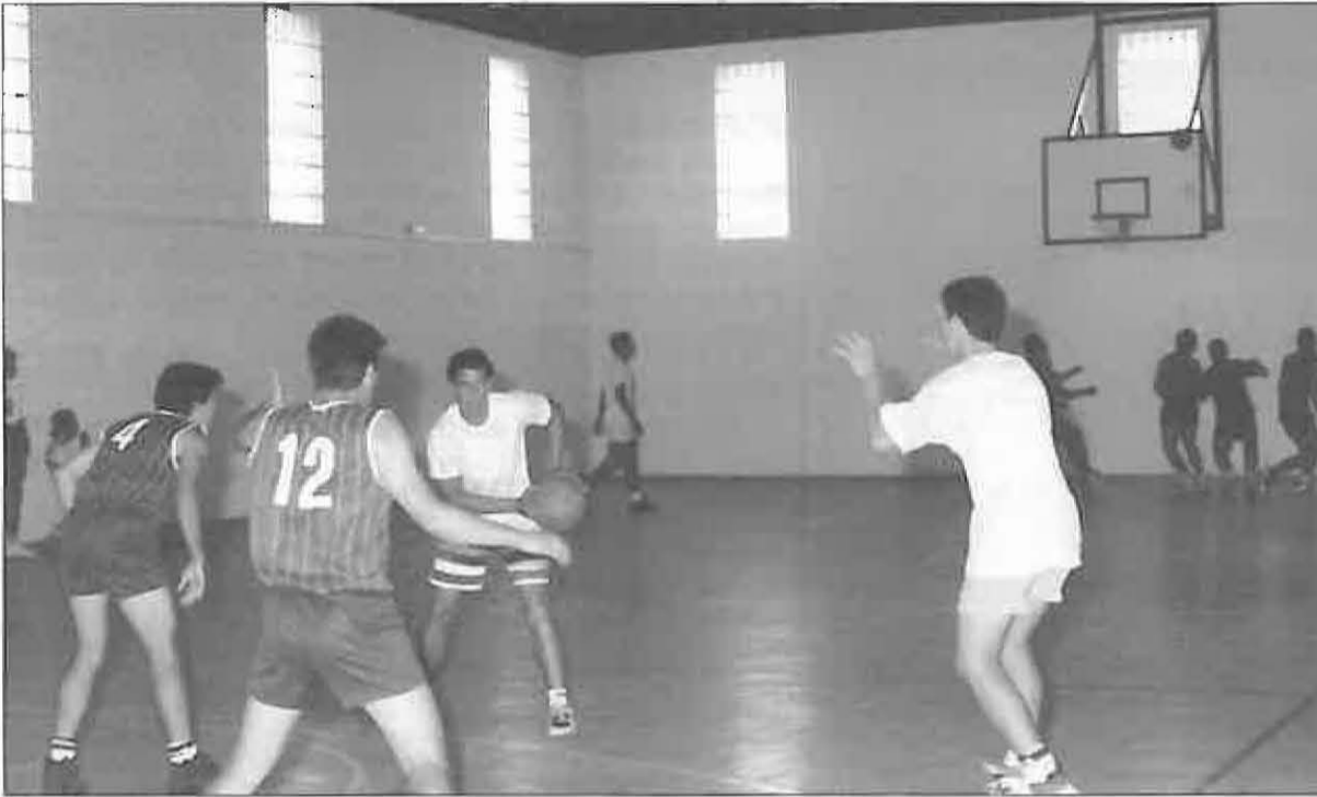
Recientemente, se ha realizado, en las instalaciones del instituto "Campo de Calatrava", un campeonato local 2x2 de baloncesto en categoría juvenil, en el que participaron 16 equipos. Este torneo fue organizado por el C. Baloncesto Alucal y el Patronato de Deportes.