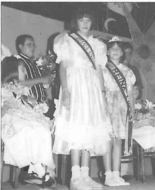
El 12 de julio será la proclamación de la reina y damas de honor.

20.00 h.: Partido de fútbol entre los equipos: Solteros-casados.