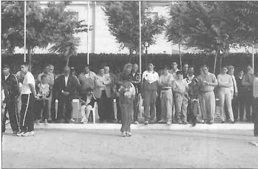
Componente del club local en plena competición