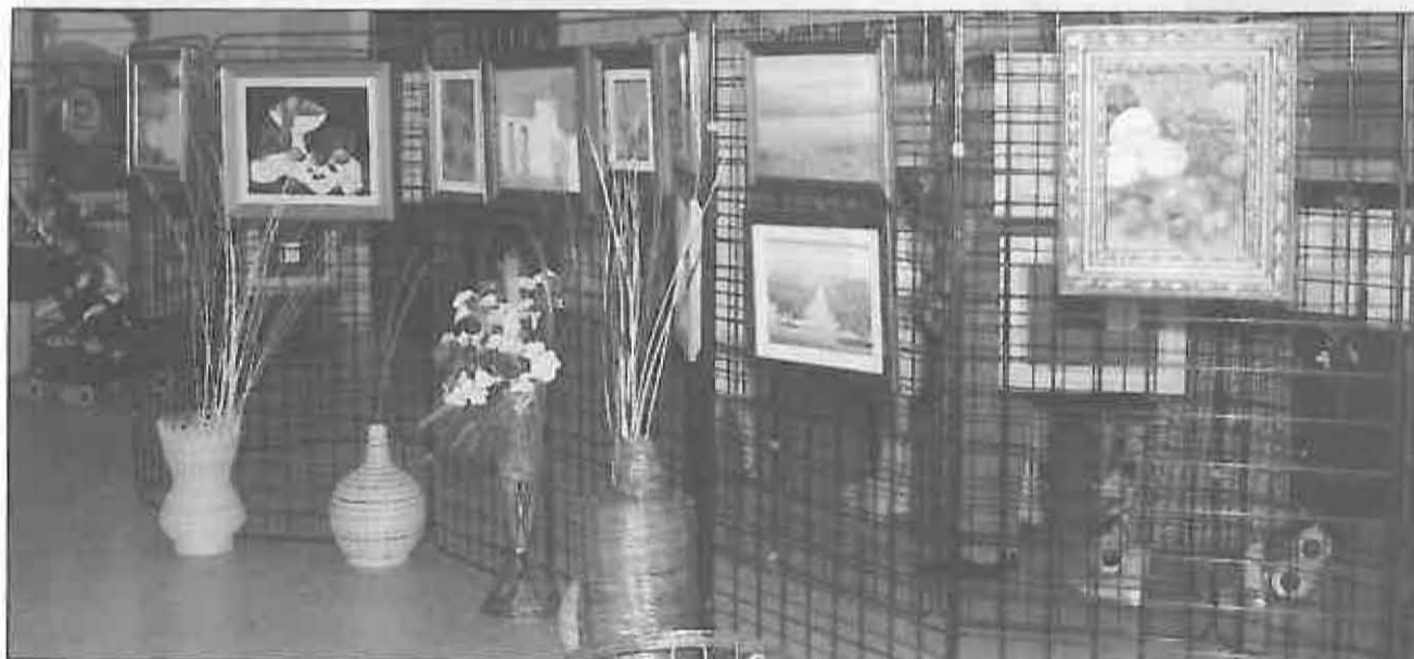
Vista parcial de la exposición colectiva

El grupo de teatro «Flauti Flauti» continuó con estas jornadas haciendo un homenaje a Lorca en