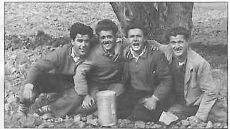
También estamos en la zona de San Isidro, pero ahora se trata de una típica comida de quintos (1956).