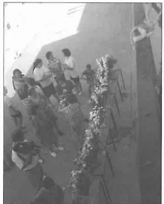
Concurso de centro florales