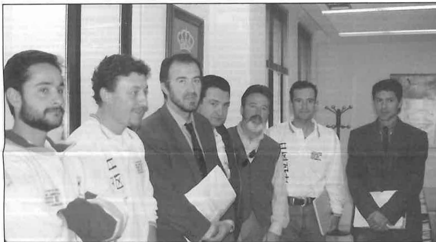
Expedicionarios y autoridades al término de la presentación oficial