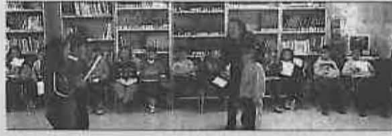
Biblioteca Municipal de Miguelturra con la animación 'La gallina ciega' de Gloria Fuentes