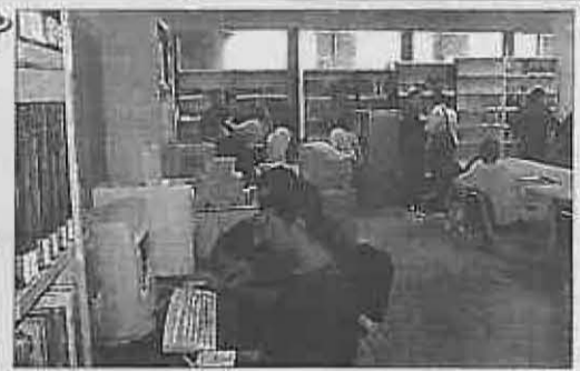
200 nuevas personas se han inscrito en los dos últimos meses

Para el uso de Internet es necesario ser socio de la Biblioteca y reservar hora previamente, ya que debido a la enorme demanda, se han tenido que establecer turnos en horario de mañana y tarde con el fin de que el usuario disponga con seguridad, de hora determinada para las con-