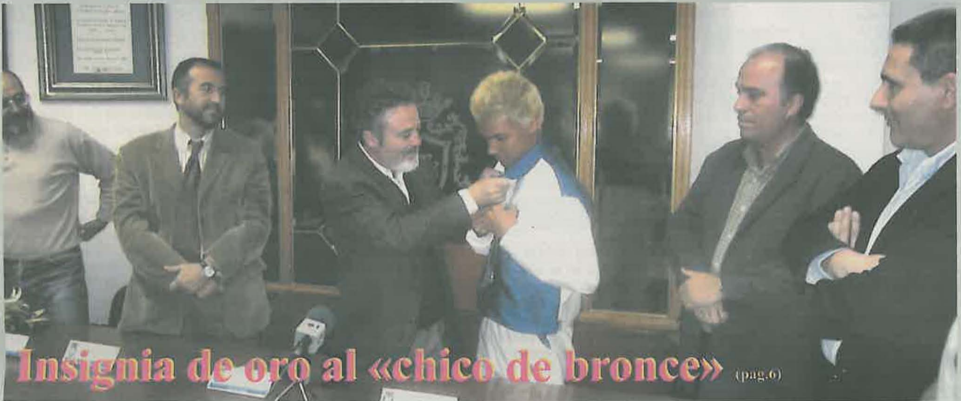
Insignia de oro al «chico de bronce» (pág.6)