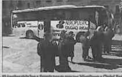
Aerobús visita la estación de Ciudad Real