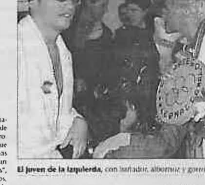
El joven de la zapatería, con torradillo, albornoze y gares, le dio la "medalla" al charringo internacional