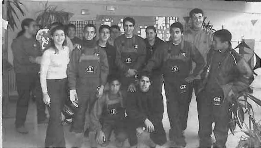
Alumnos y monitores del curso 2000/01 en la Casa de Cultura

ración de un año, siendo los últimos 6 meses en los que los alumnos permanecerán contratados por el ayuntamiento al tiempo que completan su formación ocupacional. (M.G.R.)