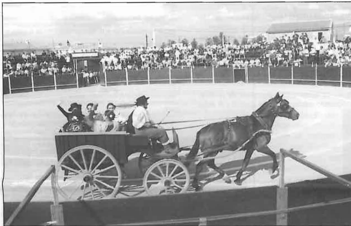
Los migueltureños tendremos la mejor feria taurina de la historia