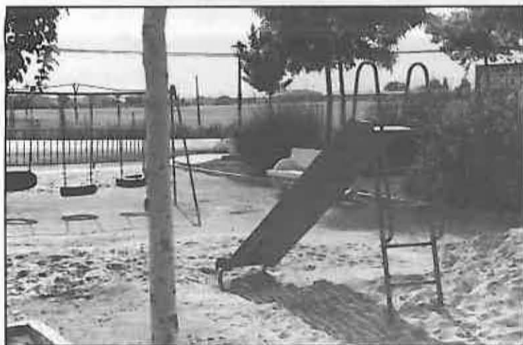
Jardines del Huerto La Lopa