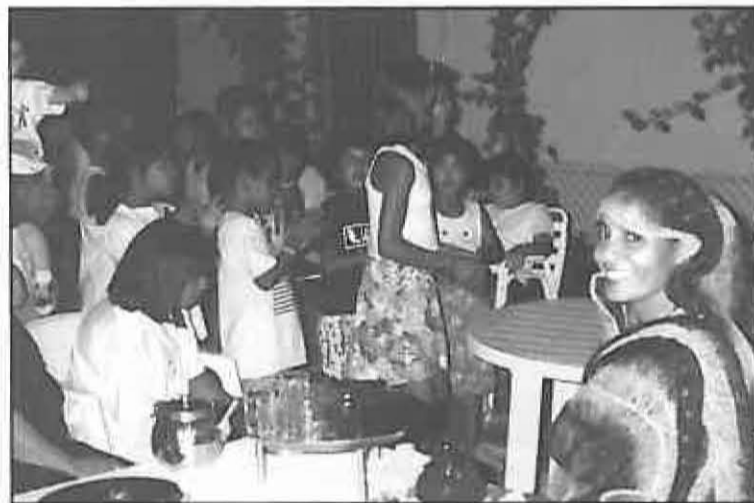
Los niños participaron en varias fiestas

Agradecemos igualmente la imprescindible colaboración del equipo médico y personal del Centro de Salud de nuestra localidad, que desde el primer momento han utilizado todos los recursos a su alcance para cumplir los objetivos establecidos, en lo relacionado con el tema sanitario, dando prueba una vez más de su profesionalidad. Nuestro agradecimiento igualmente al Cine Paz y al responsable de la Piscina Municipal que han facilitado entrada gratuita a los saharauis. Gracias a los voluntarios/as, que han colaborado en cada una de las actividades programadas y nuestro agradecimiento general a numerosas personas de nuestro pueblo, que directa o indirectamente han colaborado con el Proyecto Vacaciones en Paz.