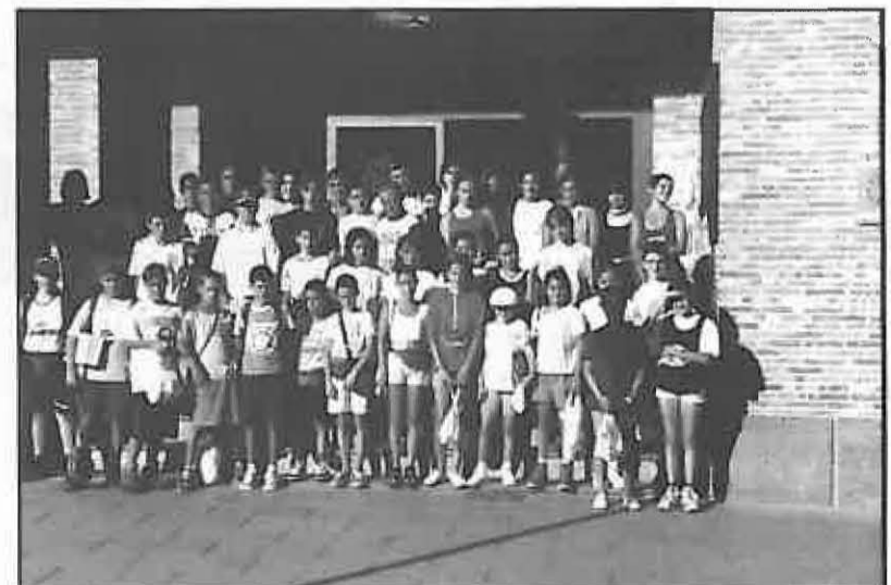
Participaron 40 niños de la mancomunidad

Durante los quince días que ha durado el campamento los asistentes han realizado multitud de actividades de ocio, tiempo libre y naturaleza, que ha hecho que la palabra aburrimiento no tuviera cabida en el programa, quedando muchos participantes motivados a participar en futuras ediciones.