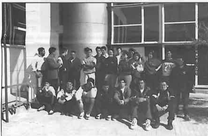
Alumnos/as del programa de Garantía Social

Por último, se puede incluir el desarrollo de distintos programas de formación-empleo que complementan una fase de enseñanza no retributiva y otra parte de contrato laboral. Así, por un lado tenemos un programa especialmente destinado a mujeres, en la modalidad de albañilería y dos programas de Garantía Social para jóvenes en las especialidades de Jardinería y Mantenimiento Básico de Edificios.