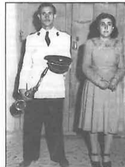
Aquí lo vemos acompañado de su esposa. Es un día señalado, pues fue cuando la Banda de Música estrenó este traje. Era a mediados de los años 40.