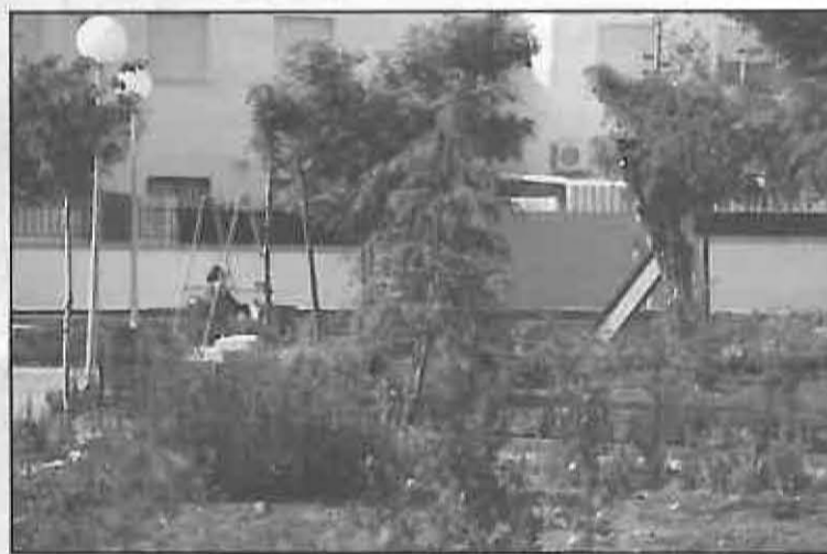
Parque de la calle las Viñas