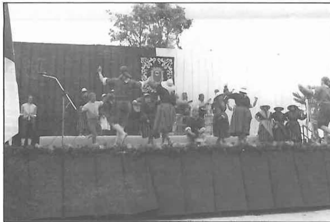
Nazarín durante una actuación en Valencia

Finalmente indicar que, una vez concluidas las fiestas, se iniciará un nuevo programa de formación para jóvenes mayores de 13 años, siguiendo la iniciativa tomada el año anterior y que se ha cumplido con bastante éxito, ya que un total de diez personas (cuatro hombres y seis mujeres) han seguido las clases habiendo participado varios de ellos en distintas actuaciones, tanto dentro como fuera de la localidad. Más adelante se dará una información más detallada, animando desde estas líneas a los jóvenes migueltureños a participar en este proyecto socio-cultural.