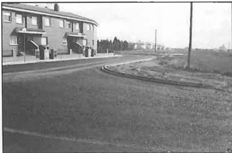
Paseo del Barrio Oriente

Por otro lado, se realizaron diversas mejoras en jardines, como la instalación de juegos infantiles en el Barrio Oriente, Huerto de la Lopa y calle Las Viñas, ampliándose así los puntos del pueblo en donde los más pequeños pueden pasar un rato divertido.