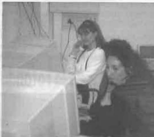
24 horas al día estarán atendidos por profesionales

Mantener a las personas mayores en su entorno habitual es uno de los principales objetivos de la teleasistencia.