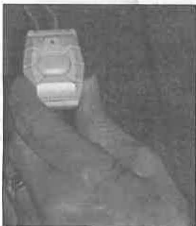
Este botón es el contacto directo

Por otro lado, como quiera que el sistema posibilita la atención en base, principalmente, a la comunicación verbal usuario-centro de atención, se excluyen también a las personas con deficiencias notorias de audición y/o expresión oral.