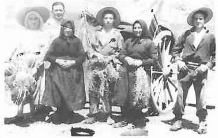
Aquí lo vemos junto a una cuadrilla de arrancadores de algarroba en la finca «Las Manoteras» (1964).