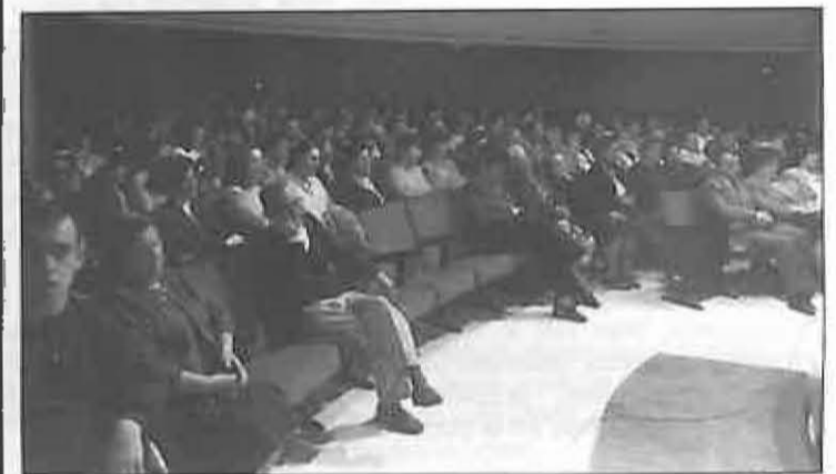
Mucho público asistió a los distintos actos