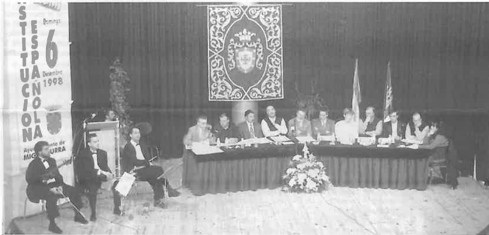
El Pleno Municipal aprobó la creación del Registro Local de Asociaciones