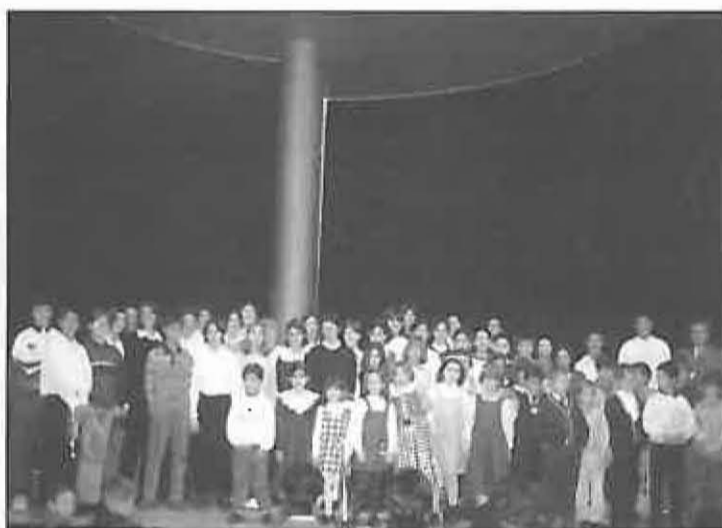
La Escuela de Música también hizo su acto

El mes de diciembre terminó con otra obra de teatro, esta vez a cargo del grupo FLAUTI FLAUTI, que puso en escena "Pluft el fantasma", dedicada también a los más pequeños.