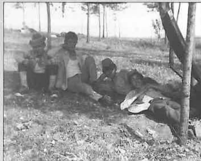
Estas dos últimas son del año 1969. En esta lo vemos junto a un grupo de amigos, buscando la sombra de un improvisado cobertizo.