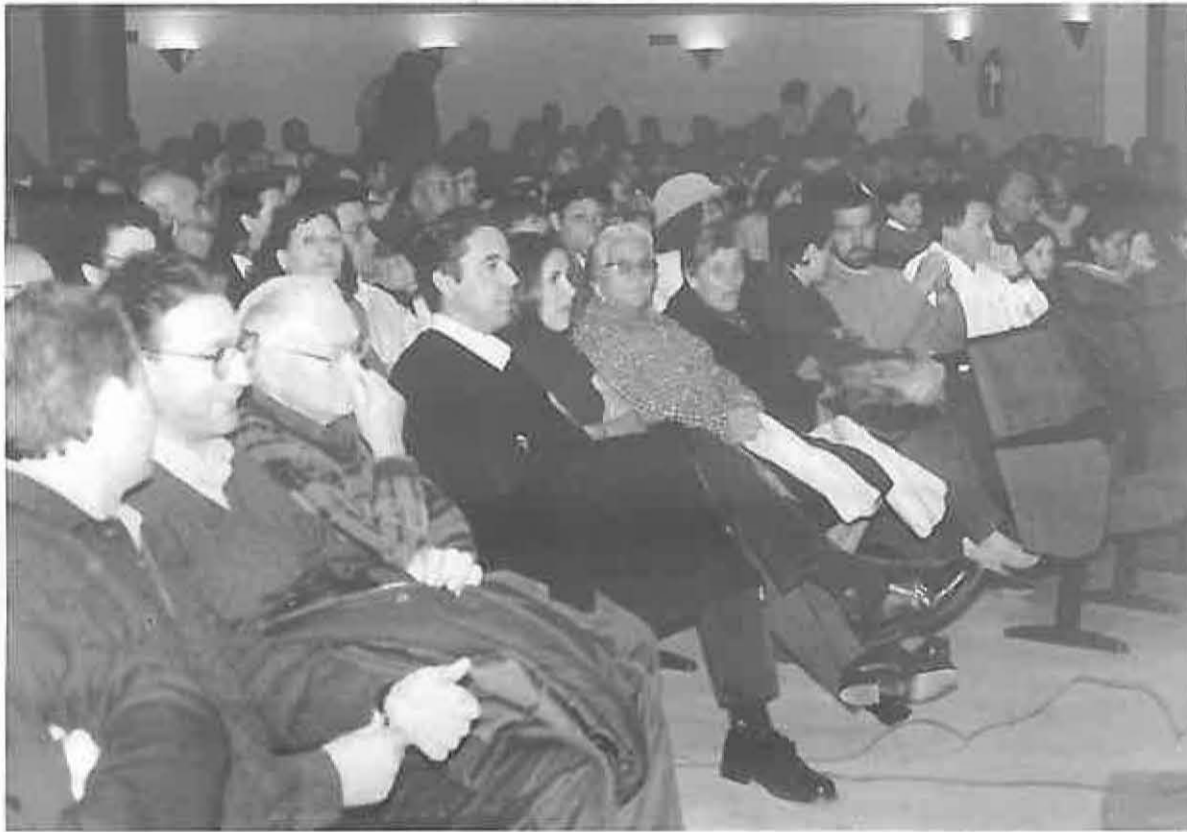
La Casa de Cultura quedó abarrotada

sino también la participación de las asociaciones, y eso ocurre en Miguelturra, donde, aún así, no debemos conformarnos y aspirar a una mayor participación».