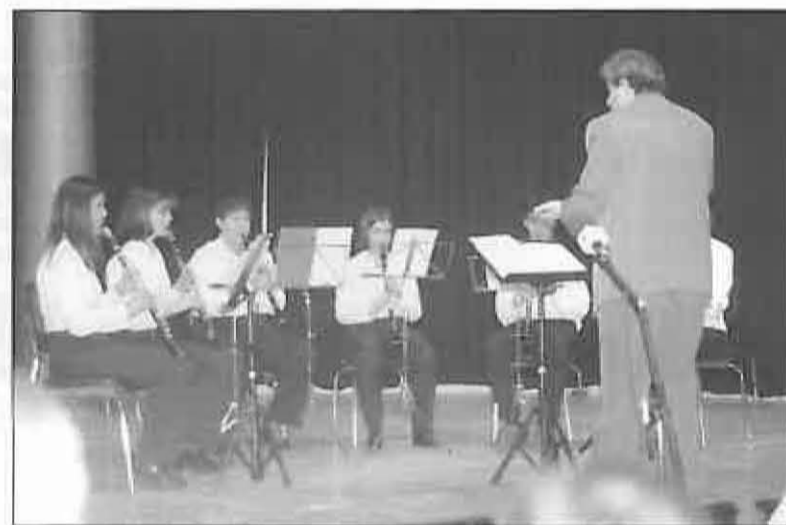
Actuación de alumnos durante la Navidad

La música incluso desempeña un papel en el aumento de la inteligencia, según otros experimentos de la Universidad de Tejas. Como ejemplo a seguir, en estados como Florida, ya se está debatiendo en los centros docentes el que los niños escuchen música clásica mientras aprenden otras materias.