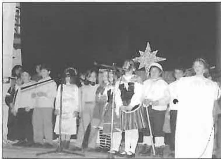
Niños de la catequesis cartan un villancico