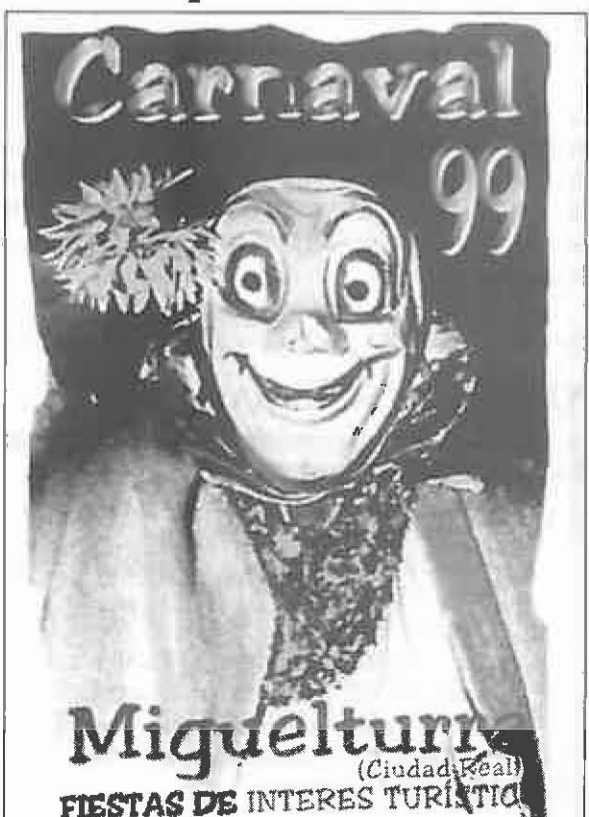
Una típica Máscara Callejera será nuestro cartel