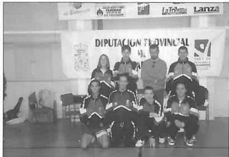
Integrantes del equipo de Miguelturra

Sobre las cuatro de la tarde finalizó la actividad después de que todos los deportistas y delegados fueran obsequiados con una comida informal (picnic), una camiseta, unos pinks y unos libros, donaciones de la Excma. Diputación de Ciudad Real y del Ayuntamiento de Miguelturra.