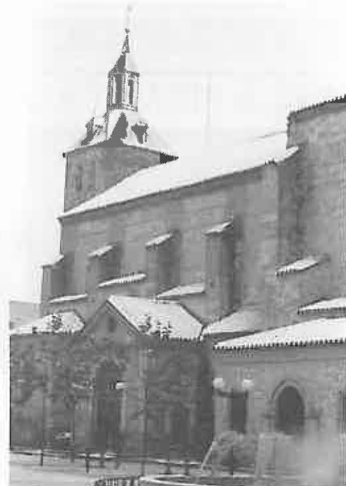
Imagen de la plaza en la tarde del día cinco

Finalmente, es necesario recordar a todos que, aunque está garantizado el abastecimiento para varios años, no se debe despilfarrar el agua porque tarde o temprano la sequía nos puede alcanzar de nuevo.