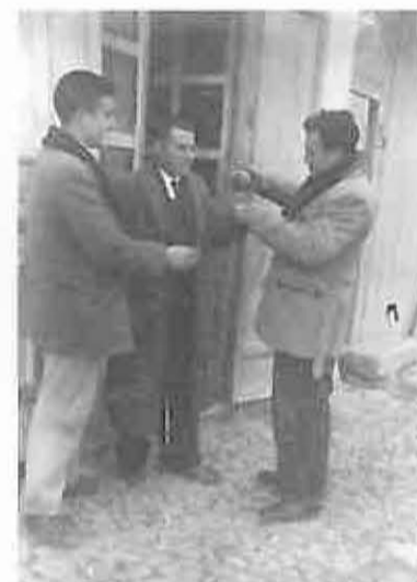
En ésta lo vemos a la puerta de la bodega, presto a probar un buen «caldo» de la tierra.