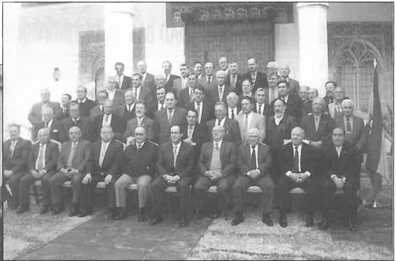
Todos los homenajeados posan junto al Presidente

En 1979 los ayuntamientos españoles vivieron su primera renovación democrática después de casi cuarenta años de dictadura.