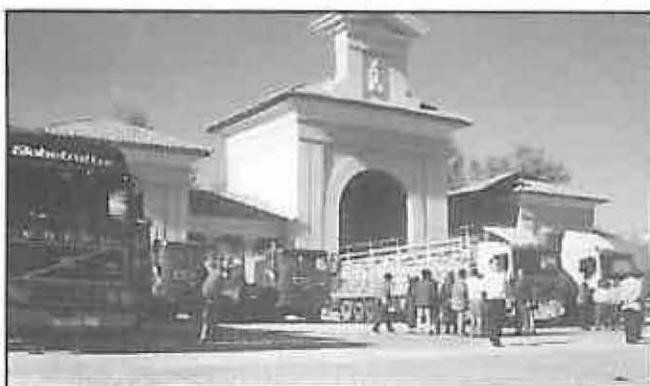
Varios camiones esperan el embarque

El pasado 21 de enero fueron aprobados los estatutos por los que se regirá la Asociación para la Cooperación con el Pueblo Saharaui, que es como se denominará la asociación humanitaria miguelturraña, aunque para mayor facilidad se la denominará SAYMI (Sáhara y Miguelturra).