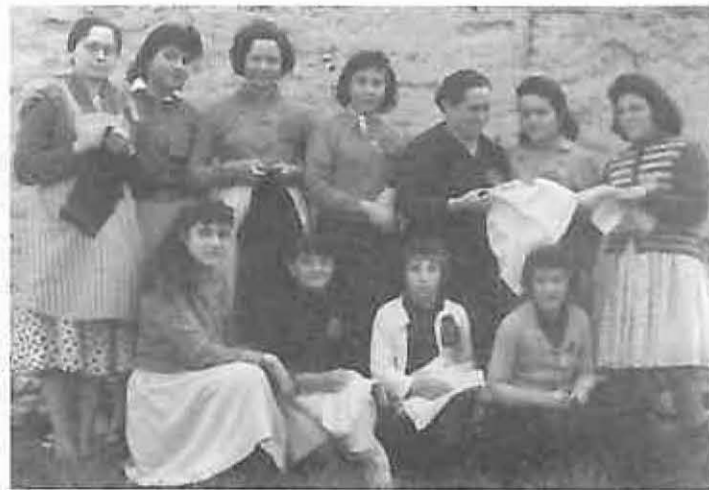
Aquí se encuentra un grupo de compañeras que participan en el taller de costura de Elvira, situado en la calle la Rosa. Era el año 1958.