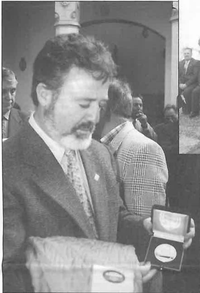
Román muestra la medalla recibida