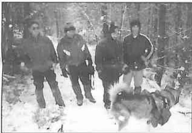
Integrantes de la excursión a la Sierra de Gredos

La Semana concluyó con una ruta de senderismo en la Sierra de Gredos, concretamente se visitó la zona de los Galayos. La ola de frío reinante en esas fechas diezmó la asistencia, pero la docena de personas que participaron gozaron con el paisaje alpino que presentaba la montaña y los bosques del lugar.