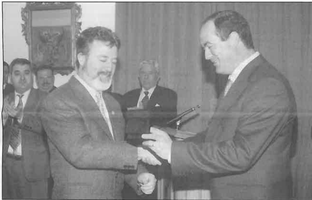
El Presidente Bono hizo entrega de medallas a cincuenta y siete alcaldes de la región