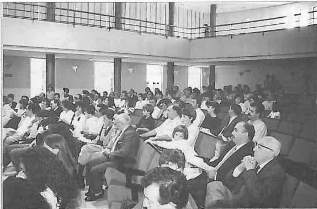
Los ganadores recibieron sus premios.

Por otro lado el espectáculo resultó impresionante: corredores, medios de comunicación, organizadores y público daban color y calor a la calle, y en el cielo ponían la nota original un helicóptero y dos parapentes con motor.