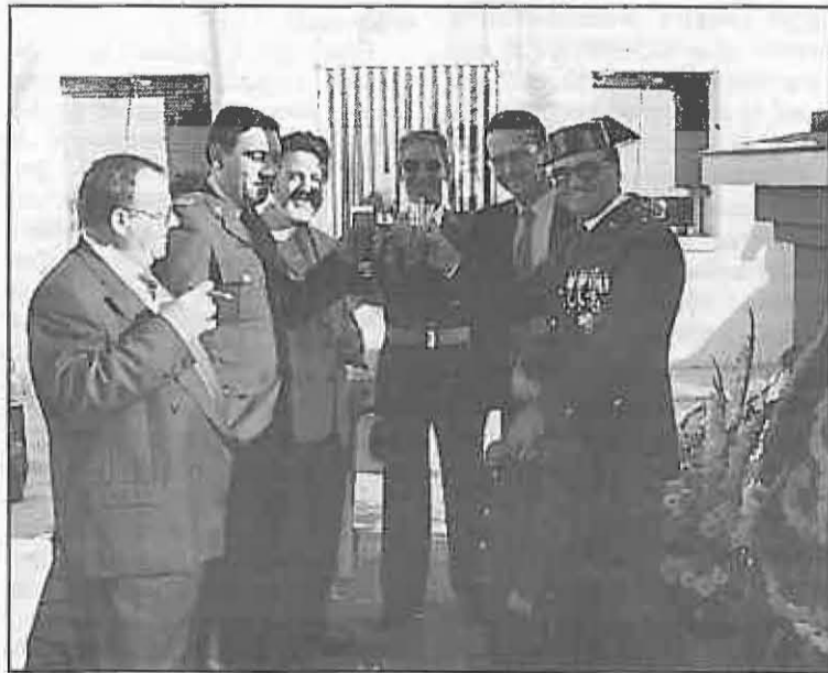
Las Autoridades brindan por la Guardia Civil

La fiesta del Pilar es una de las más importantes de las que se celebran en nuestro país, no en vano es la Patrona de España y también la conmemoración del Día de la Hispanidad. Pero también es la Virgen de la Guardia Civil. Por este motivo en la mayoría de los municipios, el Cuerpo celebra esta fecha con distintas actividades. En Miguelturra cada año la fiesta gana interés y consigue mayor participación, siendo una de sus principales características la apertura de la Casa Cuartel y de sus moradores a toda la población.