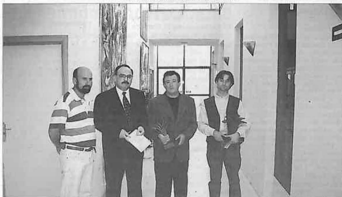
Los ganadores recibieron sus premios.

Al quedar dos vacantes libres en el Programa de Garantía Social que acaba de comenzar en este Ayuntamiento, se amplía el plazo de inscripción a este mes de Noviembre. Los interesados (jóvenes entre 16 y 21 años) pueden pasarse por la Casa de Cultura para obtener información.