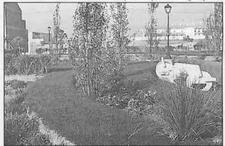
Los pozos han permitido el riego de jardines