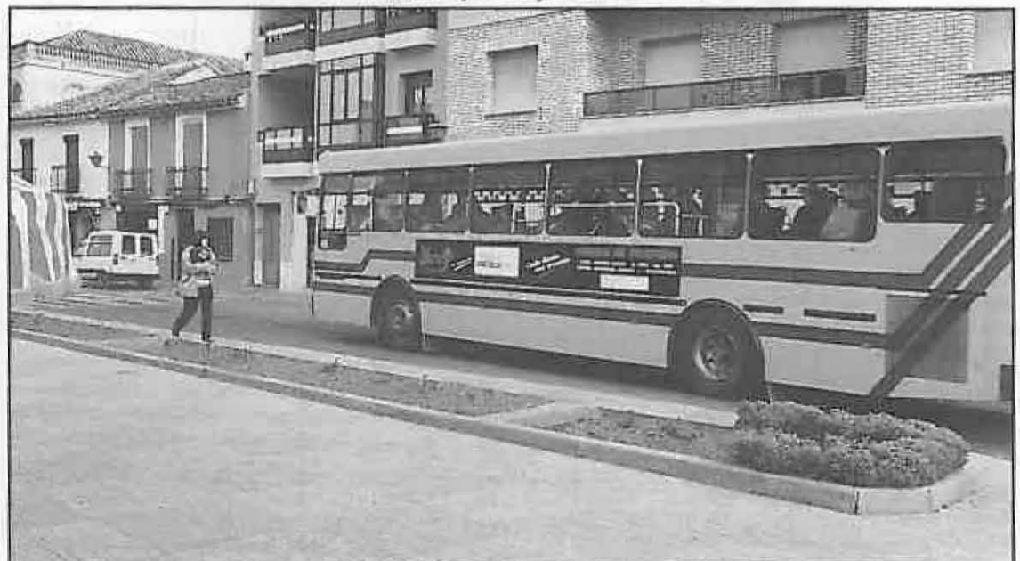
La Delegación de Transportes comenzó sus gestiones