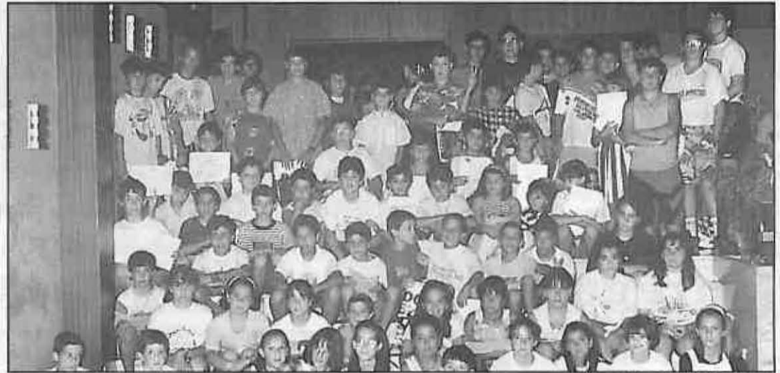
Niños de las Escuelas Deportivas

- Creación de la Sociedad Cooperativa "SERVIVAL" con 5 socias de la localidad. - Trámite de Prestación por hijo a cargo.