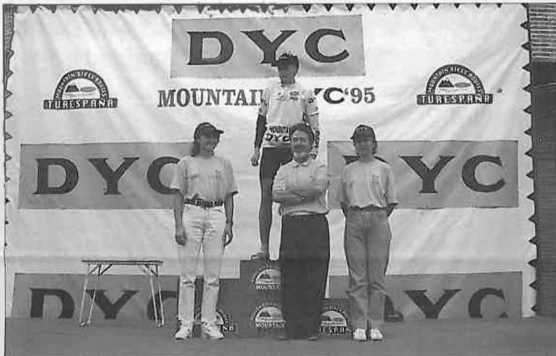
La Casa de Cultura recibió numeroso público.

El acto tuvo lugar en la recién terminada Casa de Cultura, con una masiva asistencia de público, sobre todo teniendo en cuenta que este tipo de actos suele atraer a pocos espectadores. Al mismo asistieron, además de los distintos ganadores de los distintos certámenes, la mayoría de los miembros de la Corporación, presidiendo el acto el Alcalde de la