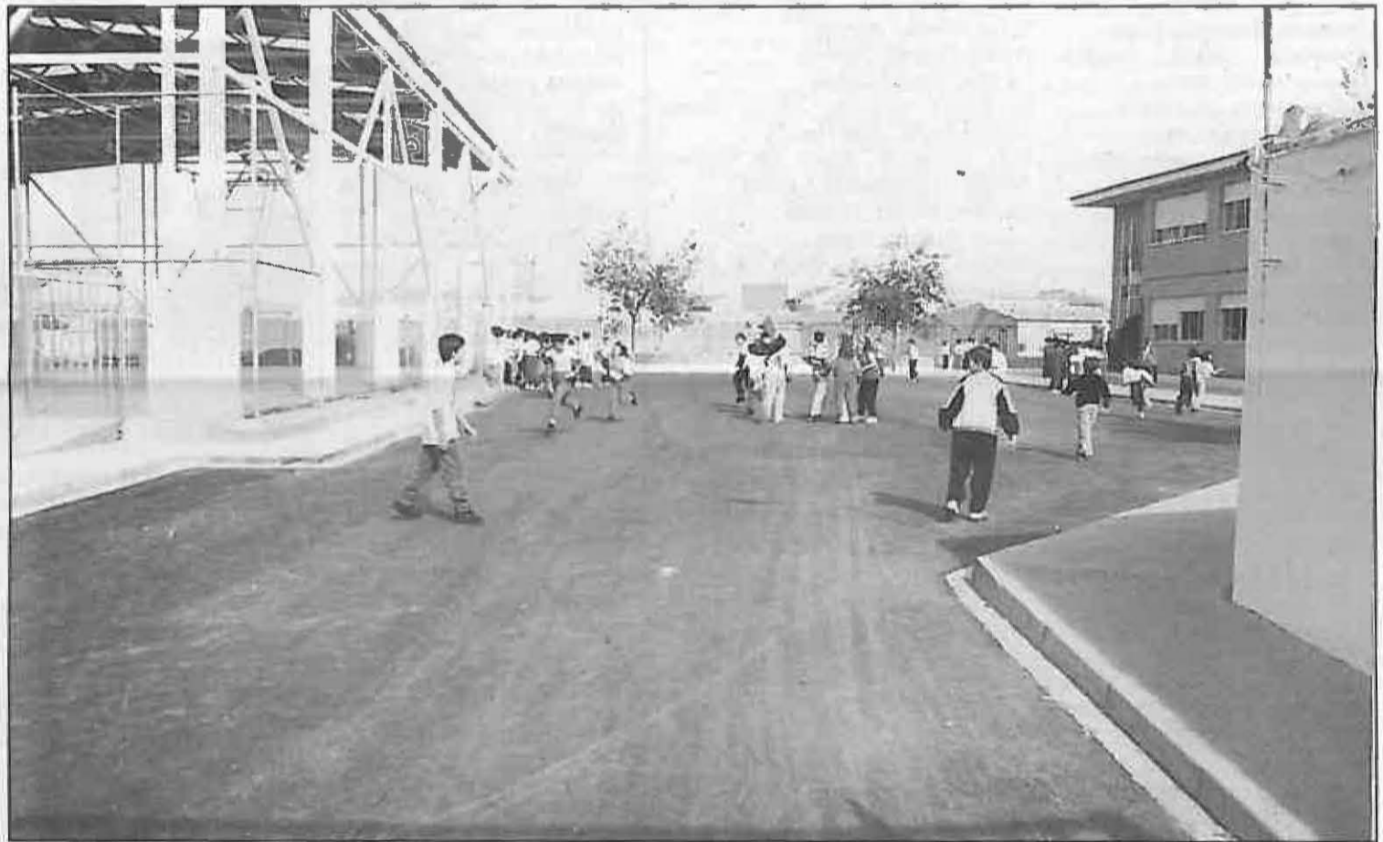
El patio de colegio ha sido asfaltado