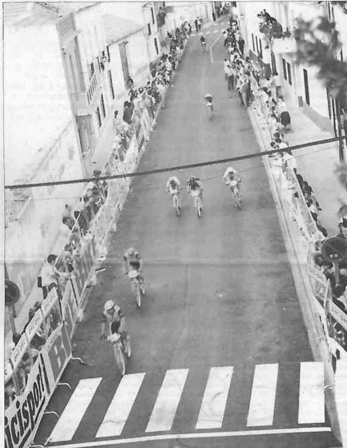
La carrera se rompió antes de la meta.