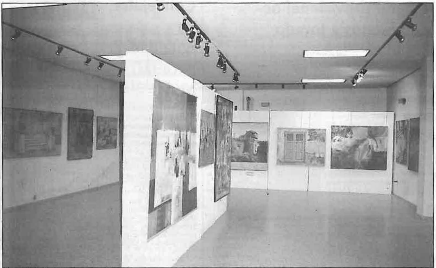
Exposición del Carta Puebla 1995